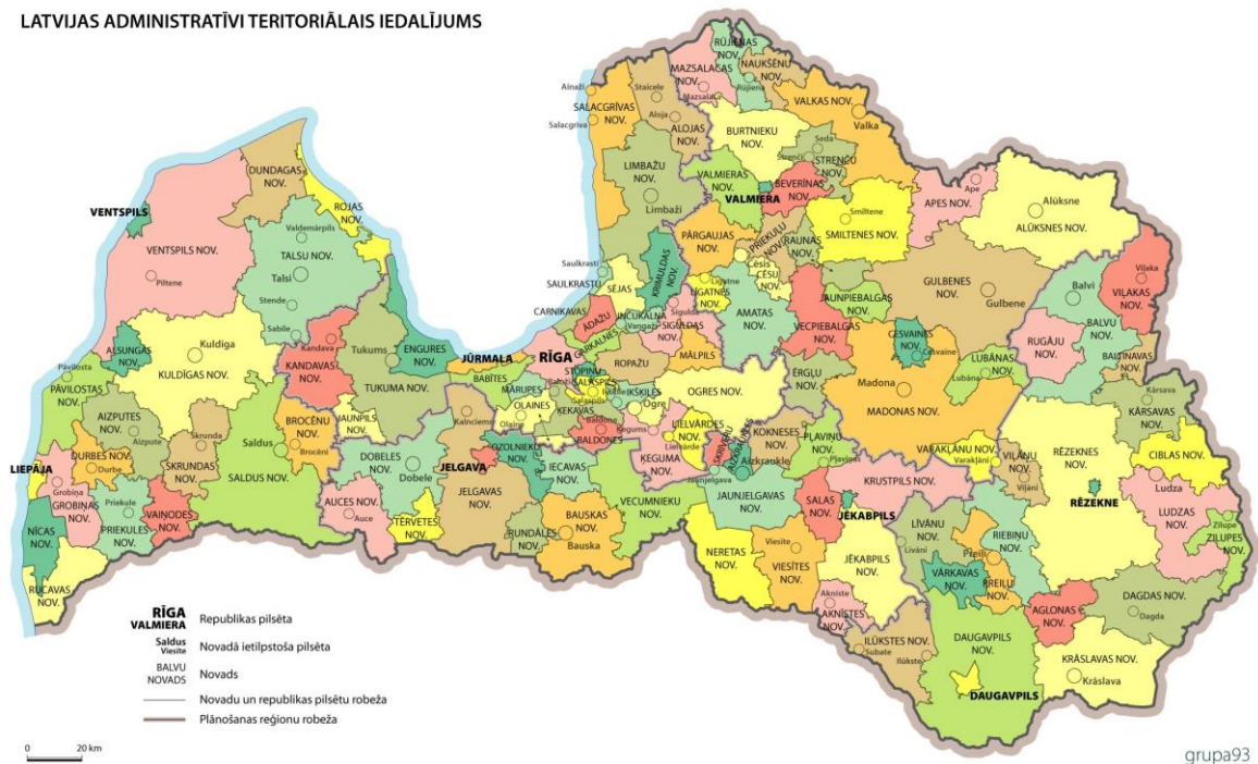
LATVIJAS ADMINISTRATĪVĪ TERITORIĀLAIS IEDALĪJUMS

Administratīvais centrs- Vecumnieki- atrodas 49.2 km no Rīgas, bet novada tālākais pagasts Skaistkalne atrodas 75.7 km no Rīgas. Novada ekonomisko pamatu veido transporta ceļi: Rīga – Skaistkalne; Rīga- Nereta- Subate; Vecumnieki- Bauska; Vecumnieki- Ogre; Bauska- Bārbele- Valle- Aizkraukle un dzelzceļa līnija: Krustpils- Jelgava.