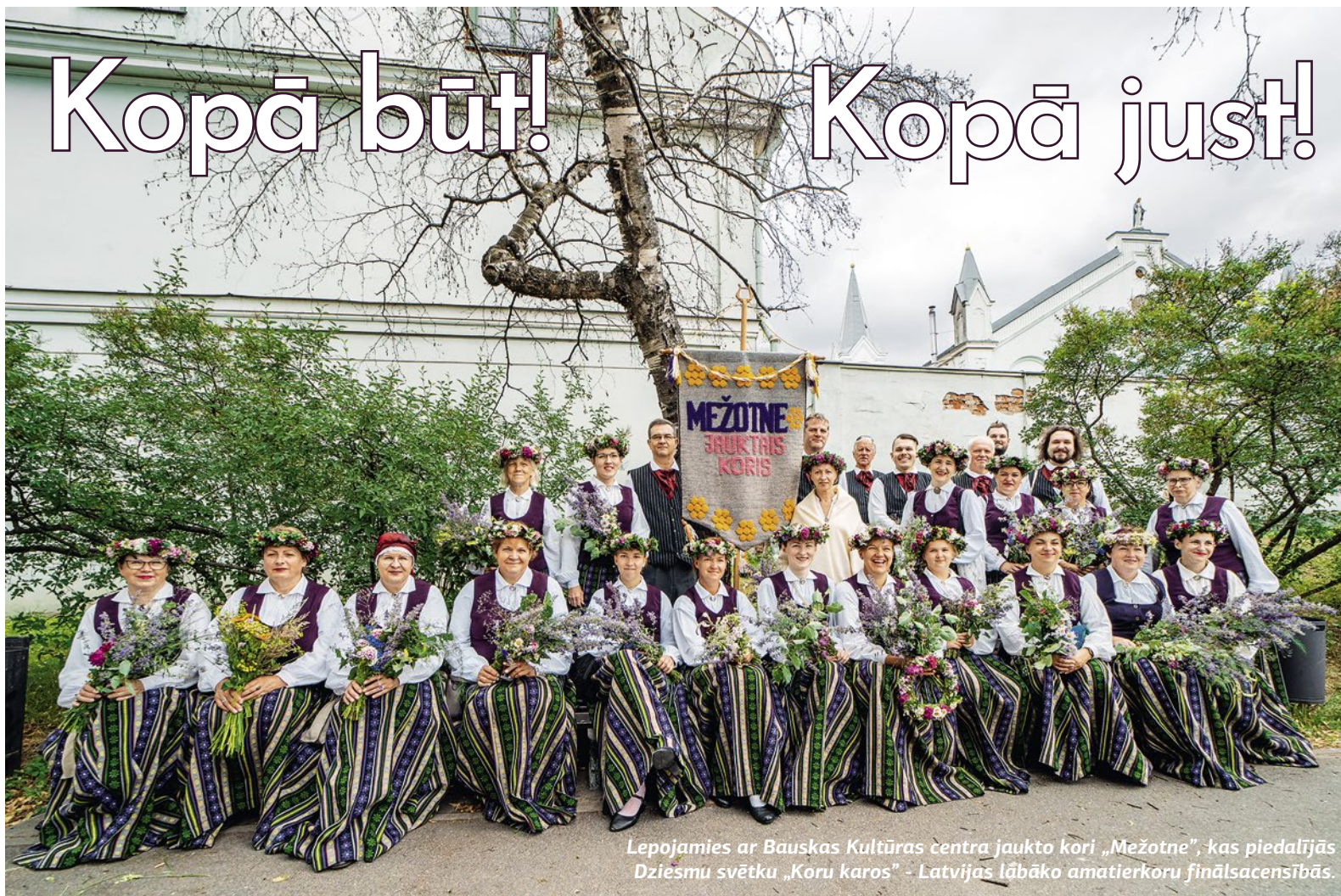
Lepojamies ar Bauskas Kultūras centra jaukto kori „Mežotne”, kas piedalījās Dziesmu svētku „Koru karos” - Latvijas lābāko amatierkoru finālsacensībās.