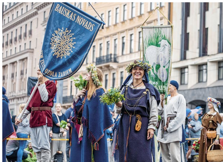
Tautas lietišķās mākslas studija „Bauska” - „Zem zelta ozola zariem”.

jauktie kori: „Četri vēji”, „Kamarde”, „Dzīle”, „Mežotne”, „Iecava”, „Mēmele”, „Grenctāle”, „Maldugunis”; sieviešu kori: „Skalve”, „Runda”, „VIA Stella”; bērnu koris „VIA Stella”; senioru koris „Sarma”; tautas deju ansamblis „Jandāls”; jauniešu deju kolektīvi: „Mēmelīte”, „Līdums”, „Jandāls studija”, „Madaras”, „Rakari”; vidējās paaudzes deju kolektīvi: „Līdums”, „Biguļi”, „Mēmele”, „Jezga”, „Dzirnavnieki”, „Iecava”, „Rundāle”, „Bārbele”, „Skaistkalne”, „Stelpe”, „Valle”, „Vēveri”; senioru deju kolektīvi: „Senbiguļi”, „Senvalle”, „Ozols”, „Iecavnieks”, „Šurpu turpu”; pūtēju orķestris „Skaistkalne” un Bauskas Mūzikas un mākslas skolas pūtēju orķestris; kokaletāju ansambļi: „Uguntiņa” un „Skandīne”; jauktais vokālais ansamblis „Mēs”; folkloras kopas: „Laukam pāri”, „Vecsaule”, „Trejupe”, „Tarkšķi”, „Tīrums”, „Dreņģeri”; tautas mūzikas kapela „Savējie” un Tautas lietišķās mākslas studija „Bauska”.