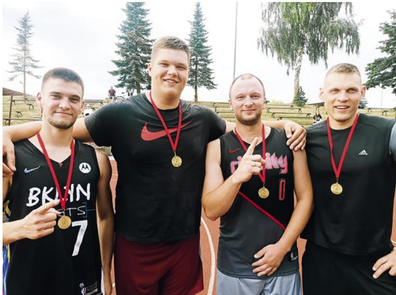
Bauskas novada atklātā čempionāta 3x3 basketbola 2. posma uzvarētāji pieaugušo grupā - „Rūķīši”.