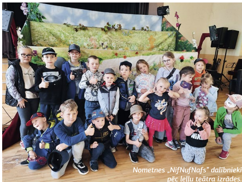
Nometnes „NifNufNafs” dalībnieki pēc leļļu teātra izrādes.