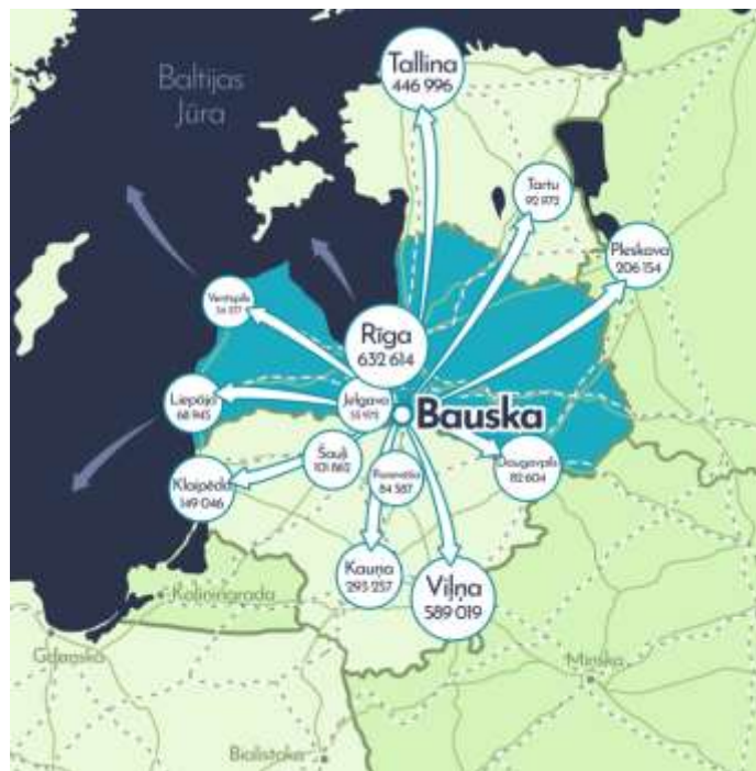
2.attēls. Apvienotā Bauskas novada novietojums Latvijā

Bauskas novads atrodas Latvijas centrālajā daļā (2. attēls), tā centrs Bauskas pilsēta atrodas ap 67 km attālumā no Rīgas un 19 km attālumā no Latvijas–Lietuvas robežas, Mūsas un Mēmeles upju satekā, vietā, kur sākas Lielupe. Kultūrvēsturiski jaunais Bauskas novads atrodas Zemgalē un robežojas ar Sēliju.