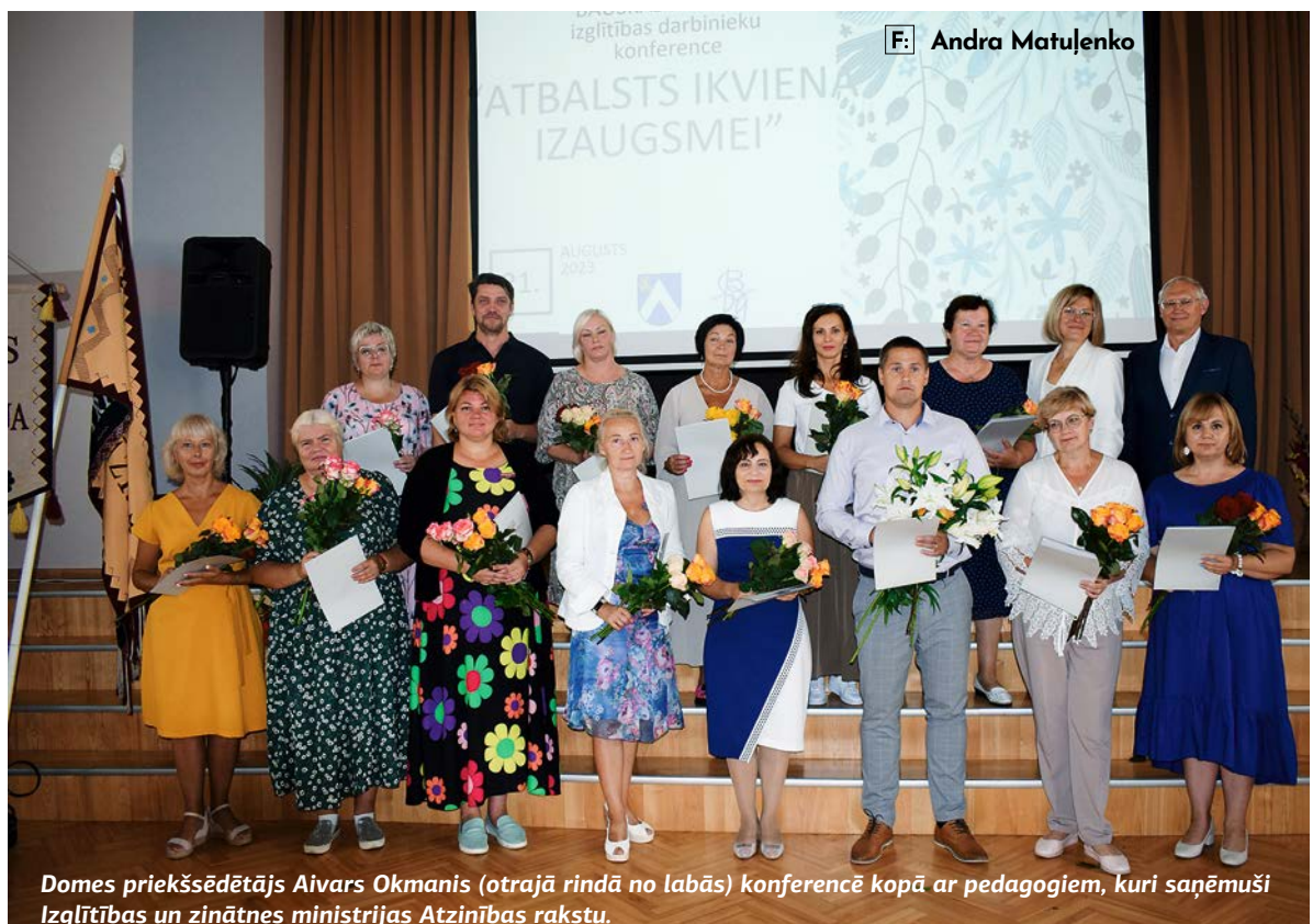
Domes priekšsēdētājs Aivars Okmanis (otrajā rindā no labās) konferencē kopā ar pedagogiem, kuri saņēmuši Izglītības un zinātnes ministrijas Atzinības rakstu.