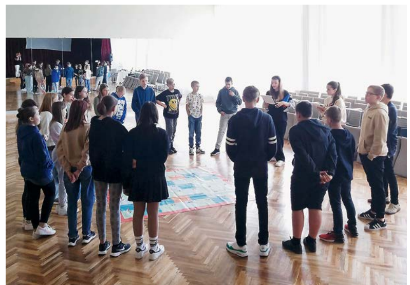
Līdzdalības nodarbība Pilsrundāles vidusskolā.

Projektu „Tālāk” finansē Eiropas Savienība. Tomēr paustie uzskati un viedokļi ir tikai autora uzskati un viedokļi un ne vienmēr atspoguļo Eiropas Savienības vai Jaunatnes starptautisko programmu aģentūras uzskatus un viedokļus. Ne Eiropas Savienību, ne piešķirēju iestādi nevar saukt pie atbildības par tiem. BNV