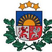
Sabiedrības integrācijas fonds