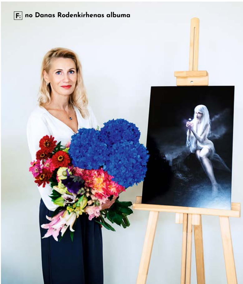
F: no Danas Rodenkirhenas albuma