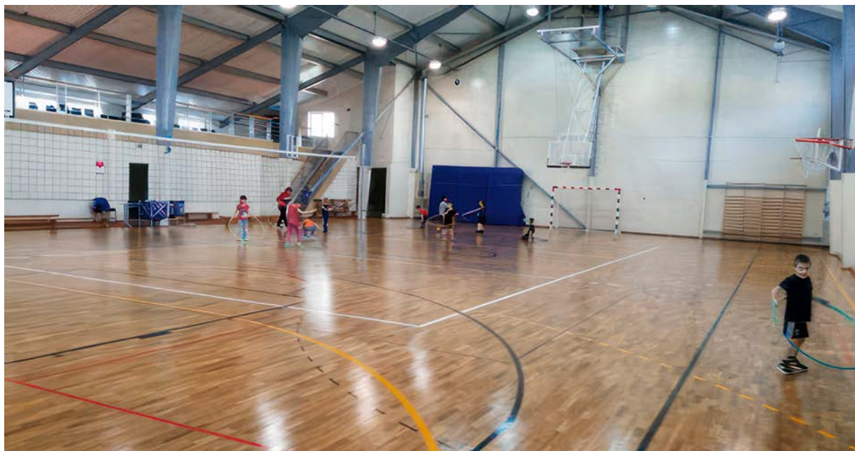
Valles pamatskola lepojas ar sporta infrastruktūru, kas daudziem bērniem ļauj veidot sasniegumus sportā.