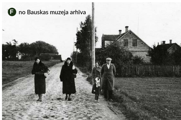
F no Bauskas muzeja arhīva Vai varat pateikt, kur mūsdienās Bauskā atrodas šī vieta: kas tā ir par ielu? 27. aprīļa vēstures lasījumi rātsnamā dos atbildi uz šo un citiem tamīdžīgiem jautājumiem.

Vairāk nekā 400 gadu ilajā pastāvēšanas vēsturē dzīve Bauskā ne vienmēr ir bijusi „miera osta”. Tai pāri brāzušās dabas stihijas un kari. Tas viss ir stipri postījis pilsētu. Tāpēc vēl viena sadaļa 27. aprīļa vēstures lasījumos būs veltīta dabas un cilvēku radītajiem postījumiem Bauskā - kā un cik stipri tie ir mainījuši pilsētas izskatu. BNV