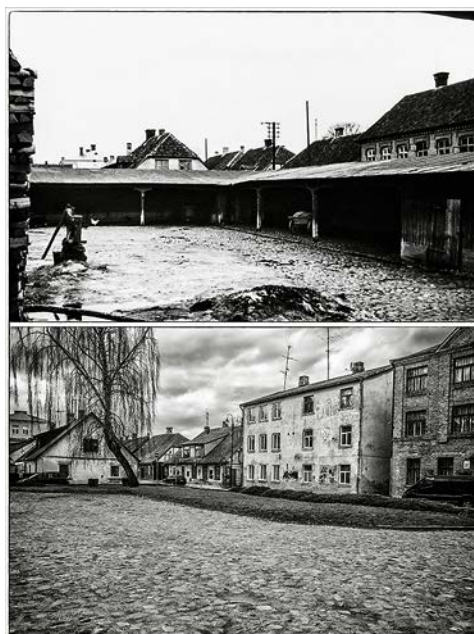
Viena un tā pati vieta: 20. gs. 30. gadi un mūsdienas - tagad Bauskas muzeja (kādreizējās Kurzemes viesnīcas) pagalmā (iebraucamā sēta) ar skatu uz Rīgas un Strautnieku ielas krustojumu.