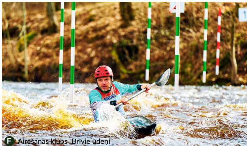
F Airēšanas klubs „Brīvie ūdeņi”

Airēšanas slaloma sacensību sezona Latvijā jau tradicionāli tiks uzsākta ar sacensībām Iecavā, kas šogad norisināsies 13. un 14. aprīlī. Sacensības organizē Iecavā reģistrētais airēšanas klubs „Brīvie ūdeņi” sadarbībā ar Latvijas Kanoe asociāciju.