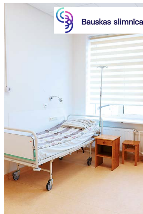
Dienas stacionāra palāta Bauskas slimnīcā.

Lai atbalstītu asins donoru kustību, Bauskas slimnīca