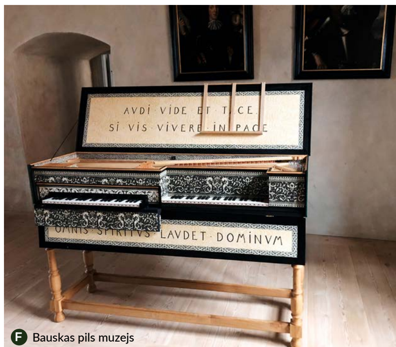
F Bauskas pils muzejs

Koncerts notiks ikgadējās JVLMA studentu radošās rezidences ietvaros Bauskas pilī, kas šogad norisināsies 27. un 28. aprīlī. Koncerta sākums 28. aprīlī plkst. 12.00. Ieeja - bez maksas. Aicinām pievienoties klausītāju pulkam, lai gūtu padziļinātu priekšstatu par Bauskas pils pastāvēšanas laika kultūru! BNV