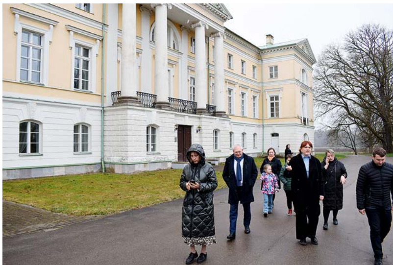
Kultūras ministres vizītes programmā bija iekļauta arī Mežotnes pils apskate.

„Prieks, ka beidzot arī Bauskas novadā mēs uzņemam kultūras ministri. Klātienēs tikšanās ir efektīvāks veids, kā nodot