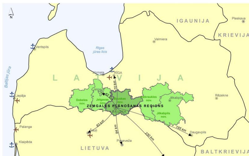
2.attēls. Bauskas novada novietojums Latvijā.

Bauskas novads atrodas Latvijas centrālajā daļā (2. attēls), tā centrs Bauskas pilsēta atrodas 67 km attālumā no Rīgas un 19 km attālumā no Latvijas–Lietuvas robežas, Mūsas un Mēmeles upju satekā, vietā, kur sākas Lielupe. Kultūrvēsturiski Bauskas novads atrodas Zemgalē un robežojas ar Sēliju.