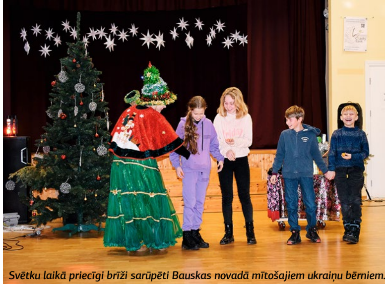
Svētku laikā priecīgi brīži sarūpēti Bauskas novadā mītošajiem ukraiņu bērniem.

Pasākumā bērni tika izklaidēti ar dziesmām un dejām, rotaļām, burvju trikiem un citām aktivitātēm, bet noslēgumā katrs saņēma projekta „Vislielākā dāvana” sarūpēto dāvanu kasti, pārti-