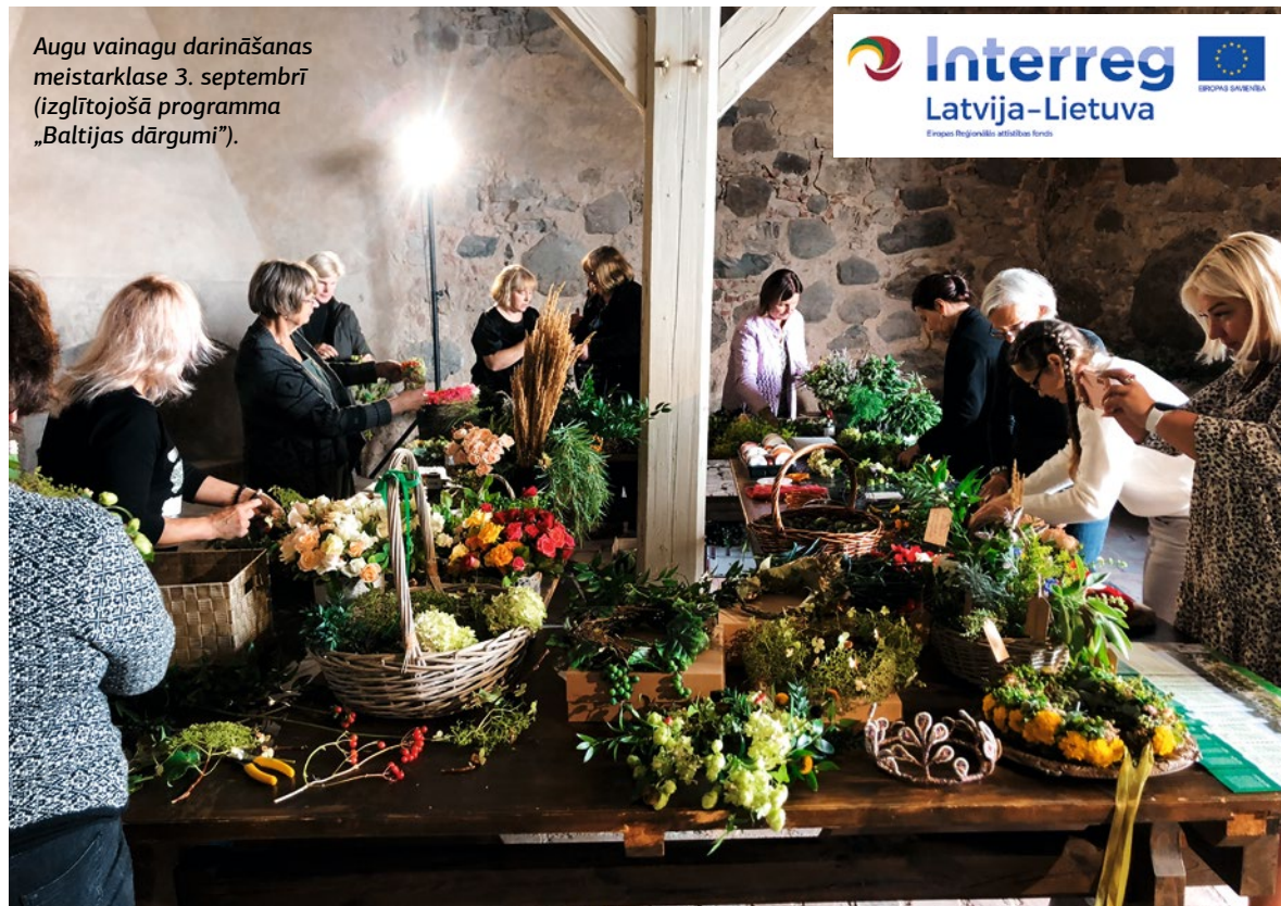
Augu vainagu darināšanas meistarklase 3. septembrī (izglītojošā programma „Baltijas dārgumi”).

Bauskas pilī realizēts aktivitāšu kopums „Brīvdabas militārā ekspozīcija”, kura ietvaros izgatavotas četras lauka lafetes pēc 17. gadsimta zīmējumiem un izvietotas kopā ar lielgabaliem uz aizsargvalņiem Bauskas pils priekšā. Kā arī izgatavota kuģa lafete salūta lielgabalam un lielgabalu piederumi – lielgabala izšaušanai un apkopei. Pils fasādes 2. stāva logiem Austrumu un Dienvidu korpusos un pagalma 1. stāva logiem ir uzstādītas restes, kas, zināms, ir bijušas vēsturiski un rada nocietinātas celtnes iespaidu. Bauskas pilī ir lielākā čuguna lielgabalu kolekcija Latvijā, un tie lielgabali, kuri nav pilnībā saglabājušies, izvietoti uz speciāliem statīviem un apskatāmi Livonijas ordeņa pils iekšpagalmā. Pils priekšā un iekšpagalmos izvietoti informatīvie statīvi, kuros iespējams iepazīties ar Bauskas pili kā nocietinātu cietoksni; uzzināt par valņiem, lielgabaliem, torņiem, šaujamlūkām u.tml. Jau esošo militāro ekspozīciju papildinās divas tērpu rekonstrukcijas: 17. gadsimta pirmās pusē musketiera un 17. gadsimta beigu artilērista.