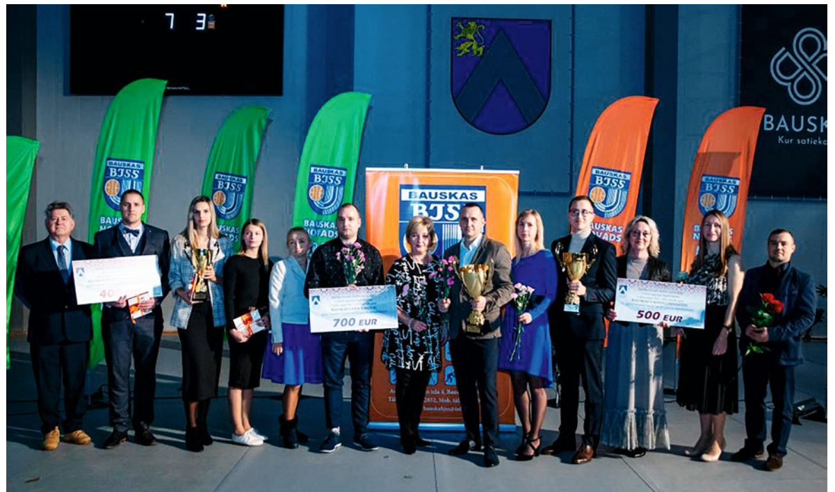
Jaunatnes sporta laureāti saņēma piemiņas balvu un naudas prēmiju atbilstoši sasniegumiem Latvijas, Eiropas un Pasaules čempionātos. Attēlā: pagājušā mācību gada 1. izglītības iestāžu grupas Bauskas novada skolēnu sporta spēļu uzvarētāji kopvērtējumā: 1. vieta - Bauskas 2. vidusskola, 2. vieta - Bauskas Valsts ģimnāzijai, 3. vieta - Bauskas pilsētas pamatskola. Izglītības iestādes saņēma piemiņas kausu un naudas balvu sporta inventāra iegādei mācību procesa nodrošināšanai.

Sportistus sveica arī Bauskas novada domes priekšsēdētāja vietnieks Aivars Mačeks, Izglītības, kultūras, sporta un sabiedrības labklājības departamenta vadītāja Antra Ozoliņa, pašvaldības Izglītības, kultūras un sporta komitejas vadītājs Raitis Ābelnieks, Bauskas novada domes deputāts Voldemārs Čačs, Latvijas Vieg-