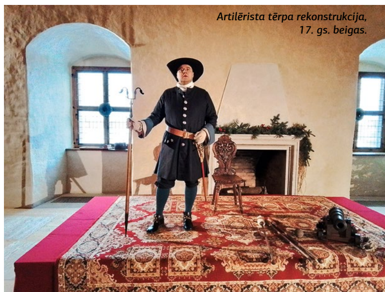
Artilērista tērpa rekonstrukcija, 17. gs. beigas.

Bauskas pils interjeru ekspozīcijas papildinātas ar manierisma gaismekļu kopijām Ziemeļu korpusa hercoga tualetes un Dienvidu korpusa saimnieciskā rakstura telpās: stallī, saimes telpā, ratnīcā, pagrabā, sardzes un citās telpās.