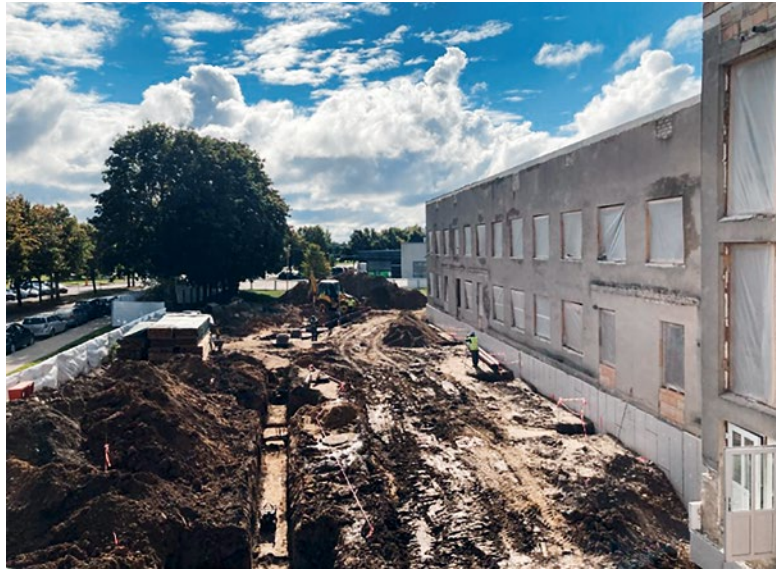
Būvniecības objekts Bauskā, Slimnīcas ielā 4.

Projekta aktivitāšu priekšfinansēšanai un pašvaldības līdzfinansējuma daļas nodrošināšanai tiks ņemts aizņēmums Valsts kasē par kopējo summu 1 561 657,97 EUR, ar sadalījumu pa gadiem – 2022. gadā 338 973 EUR un 2023. gadā 1 222 684,97 EUR, paredzot aizdevuma atmaksas termiņu 20 gadi un pamatsummas atmaksas uzsākšanu 2024. gada martā. Eiropas Reģionālās attīstības fonda finansē-