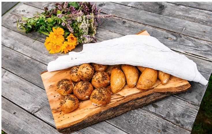
Zemnieku saimniecība „Vaidelotes”.

Kad našķu gana, jādomas uz saimniecību „Rīta putni” Kokneses pagasta Bilsitiņos. Te atrodas paipalu olu un gaļas delikatešu ražotne „Olalā!” un „Bučers”, mierpilns un garšām bagāts ziedu, augļu un dārzeņu dārzs, kas sevī ieskauj romantisku siltumnīcu „Love garden”, kā arī veikals „Bārs un bode”, kurā iegādāties svaigākos produktus un pavādīt mirkli kopā ar saimniekiem un laiku ar draugiem. Iespējams pieteikties arī dažādām