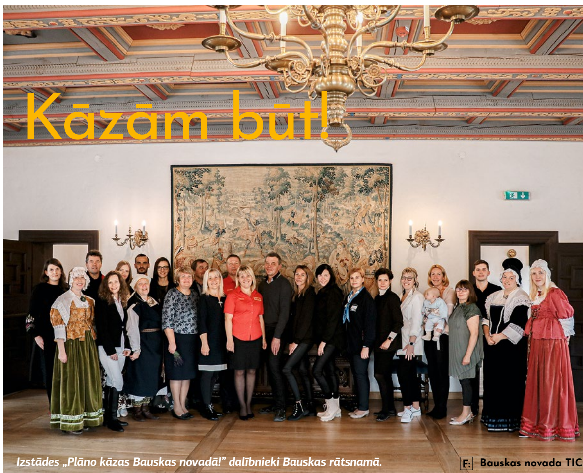
Izstādes „Plāno kāzas Bauskas novadā!” dalībnieki Bauskas rātsnamā.