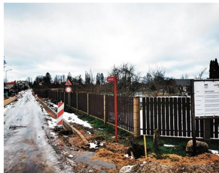
Ceriņu ielas pārbūve Vecumniekos. Ziemas periodā - tehnoloģiskais pārtraukums.