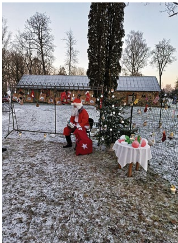
Ilgi gaidītais Ziemassvētku vecītis ir klāt!

Decembris ir laiks, kad mēs pārdomājam visus gada notikumus un izbaudām kluso adventes laiku.