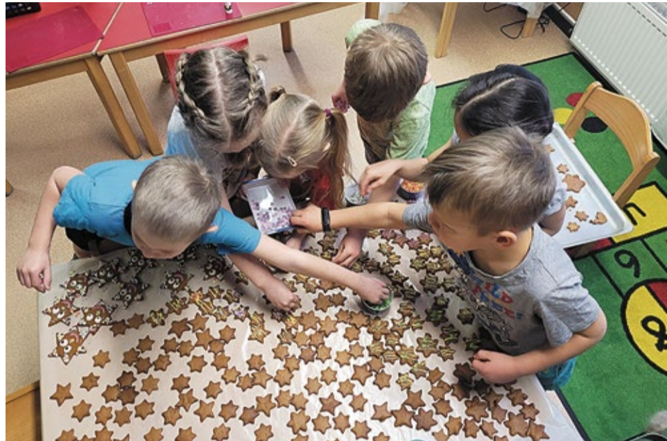
Viena no bērnu svētku aktivitātēm bija kopīga piparkūku cepšana un dekorēšana – bērni to darīja ar lielu aizrautību!

tās ķekatknieku lomās, paši jaunākie – „Zintīšu” grupas bērni baudīja svētkus pie lielās izrotātās eglītes, „Bitīšu” grupas bērni izspēlēja uzvedumu „Vecīša cimdiņš”. „Taurenīšu” grupiņa svētkus svinēja baltajā sniedzīņā.