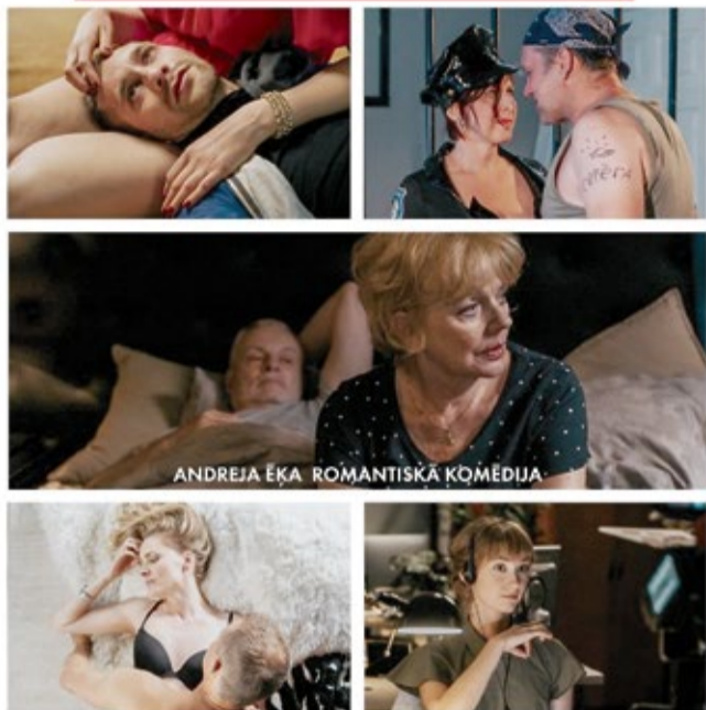
ANDREJA ĒKA. ROMANTISKĀ KOMĒDIJA