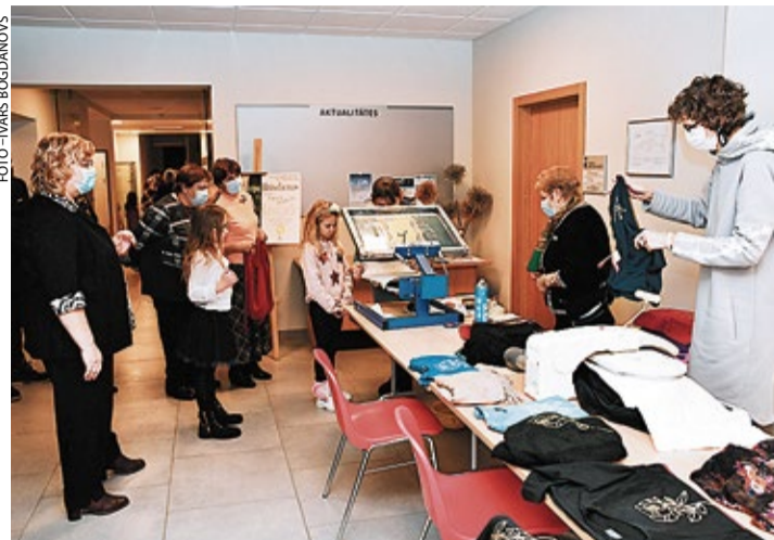
Mirklis no piesātinātā pasākuma rosības.

zīmes ierastās vietās un lietās. Brīnišķīgu svētku sajūtu visiem radīja starptautiski atzītās mākslinieces Tatjanas Paļčukas-Rikānes gleznu brīnumainā pasaule.