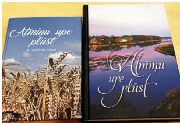
Abu grāmatu vāku attēls.

kamo stāstu autoru sarakstu. Mums katrā bija savs cilvēku loks, kurus bijām uzrunājušas, bet kuri tikai otrajai grāmatai uzticēja savu stāstu. Patiesībā daži stāsti jau bija stāstīti stāstu vakaros, kurus negribējās palaist nebūtībā, citi melnrakstos, atlika uzrunāt sviteniešus, viesturiešus, kas pirmajā grāmatā bija mazumā. Stāsti pienāca gan e-pastā, gan pa pastu, gan pašu autoru atvesti uz bibliotēku. Liela daļa bija rokrakstos, kurus nācās uzmanīgi pārlasīt, citi uz rakstamma-