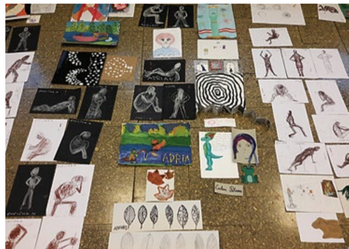
Ieskats bērnu darbu izstādē.

Īpaši pateicamies Īrai Rozentālei par ilggadēju un radošu pedagoga darbu Pilsrundāles Mū-