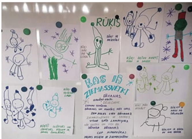
Bērni kopā ar bērnudārza skolotājām kopīgi mēģināja izprast, kas ir Ziemassvētki, kādas ir tradīcijas un kā izskatās Ziemassvētku rūķis.