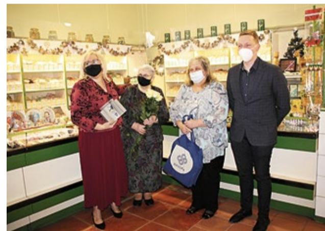
SIA „Gafū” kolektīvs - Gada tirgotāja balvas ieguvējs.

Visu nomināciju uzvarētāji saņēma dāvanu karti reklāmas video filmēšanai uzņēmuma vai produkta publicitātes nodrošināšanai.