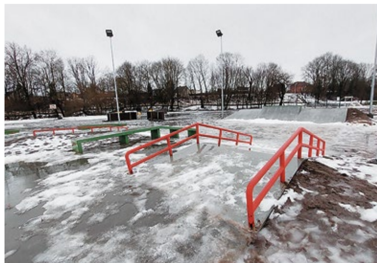
Mainīgo laikapstākļu dēļ skeitparka teritorijas apzaļumošana tiks pabeigta līdz šī gada maijam.

Savukārt velotrasī SIA „City Playgrounds” uzbūvēja par pašvaldības budžeta līdzekļiem 79 057,23 EUR apmērā (ieskaitot PVN). Abu izbūvēto objektu autoruzraudzība un būvuzraudzība kopā izmaksāja attiecīgi 961,95 EUR un 8990,00 EUR (ieskaitot PVN). Arī šīs summas segtas no pašvaldības budžeta.