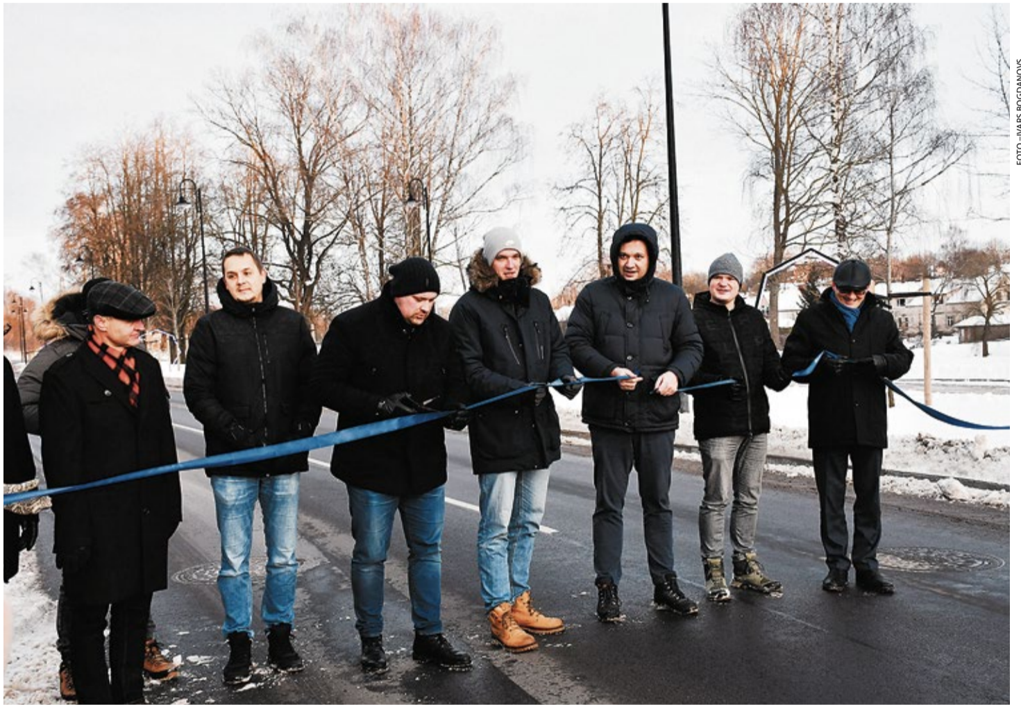
Nelielā pulkā, kopā sanākot projekta galveno darbu veicējiem, Bauskas novada administrācijas speciālistiem un domes vadībai, 29. decembrī oficiāli tika atklāta pārbūvētā Mēmeles iela Bauskā.