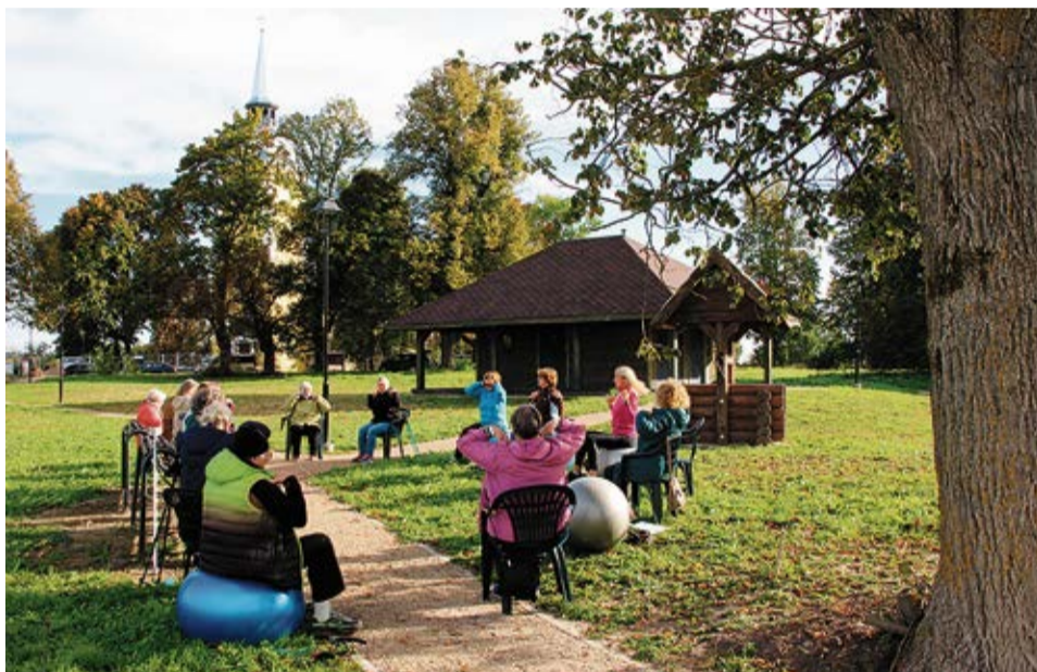
Prieks par atkaltikšanos, un lieliska iespēja vingrot svaigā gaisā, baudot rudens sauli.

Oktoobrī plānotas izglītojošas lekcijas Pilsrundāles vidusskolas 8. klases audzēkņiem par dzimumattīstību, attiecību veidošanas un atbildības jautājumiem, kā arī par reproduktīvās