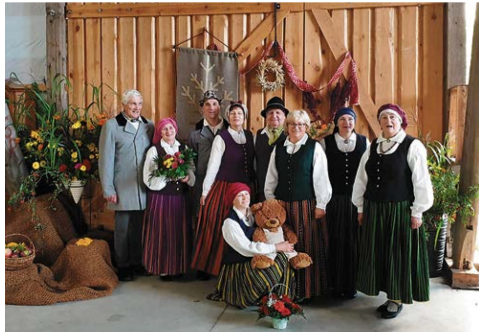
Koši un priecīgi. „Dreņģeri” savā 40.dzimšanas dienā Codes pagasta „Vaidelotēs”.

• Esmu pateicīgs tiem Ziemassvētkiem, kuros kolektīvs mani uzrunāja un tagad es skandinu savu balsi kopā ar atraktīvo vadītāju un jaukajiem dziesmu biedriem. Patīk kolektīva jautrība un kopā būšana, gan priekos, gan bēdās. • Patīkami izdziedāties tik jaukā kolektīvā – viens par visiem, visi par vienu. Mans kolek-