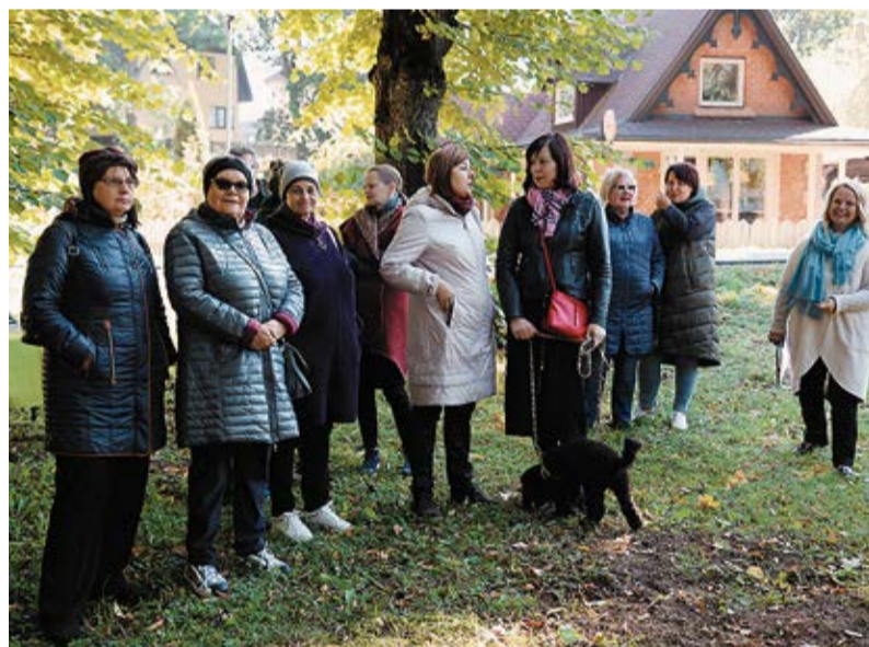
Pasākuma dalībnieki izmantoja iespēju uzzināt ko jaunu, baudīja mākslu, mūziku un saulaino rudens dienu Iecavas parkā.

tas ir saglabājušies līdz mūsdienām, un viens no tiem ir šis Ģedules tiltiņš, kas saglabājies teju sākotnējā izskatā. Diemžēl tas tika krietni bojāts 2011. gadā, kad notika Rīgas ielas rekonstrukcija. Upes iela tika izmantota kā