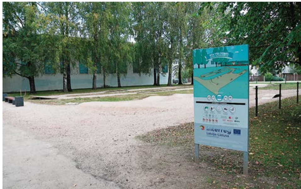
Tapusi inovatīva piedzīvojumu trase, kas bērnus un jauniešus jautrā veidā sagatavo reālai pilsētas satiksmei.

Trases tiešā tuvumā ir informatīvs stends, ar kuru ir jāiepazīstas katram tās lietotājam, pirms tās izmantošanas. Kivere ir obligāta! Ņemot vērā, ka trase ir publiski pieejama jebkuram 24/7, atbildība ir jāuzņemas pašiem braucējiem (bērniem/jauniešiem un viņu pavadoņiem – vecākiem). Notiekošo trasē uzmanīgi vēros uz skolas fasādes izvietotā augstas izšķirtspējas kamera, kura kopā ar vēl 31 citu ir ierīkota iepriekšminētā projekta ietvaros.