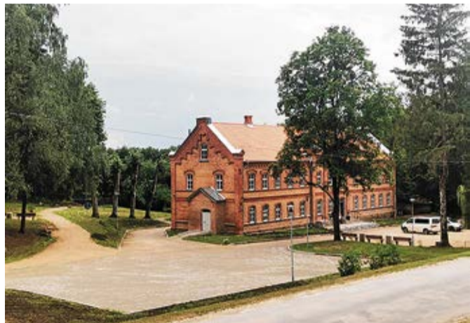
Projekta rezultāts - labiekārtota un pieejama pakalpojumu vide Vecumniekos.

Projekta mērķis - teritorijas labiekārtošana pie Sarkanās skolas Vecumniekos, tādējādi nodrošinot pakalpojumu pieejamību un sasniedzamību vietējas nozīmes arhitektūras piemineklim, kā arī veidojot pievilcīgu vidi kopējā ainavā. Teritorijas labiekārtošanas darbus objektā nodrošināja SIA „Ribetons ceļi”. Kopējās būvdarbu izmaksas ir 89 613,05 EUR (t.sk. PVN 21%), no tām ELFLA finansējums ir 38 071,05 EUR un pašvaldības līdzfinansējums 51 542,00 EUR. Būvdarbi objektā tika uzsākti 2020.gada 17.augustā un pabeigti šā gada 12.augustā.