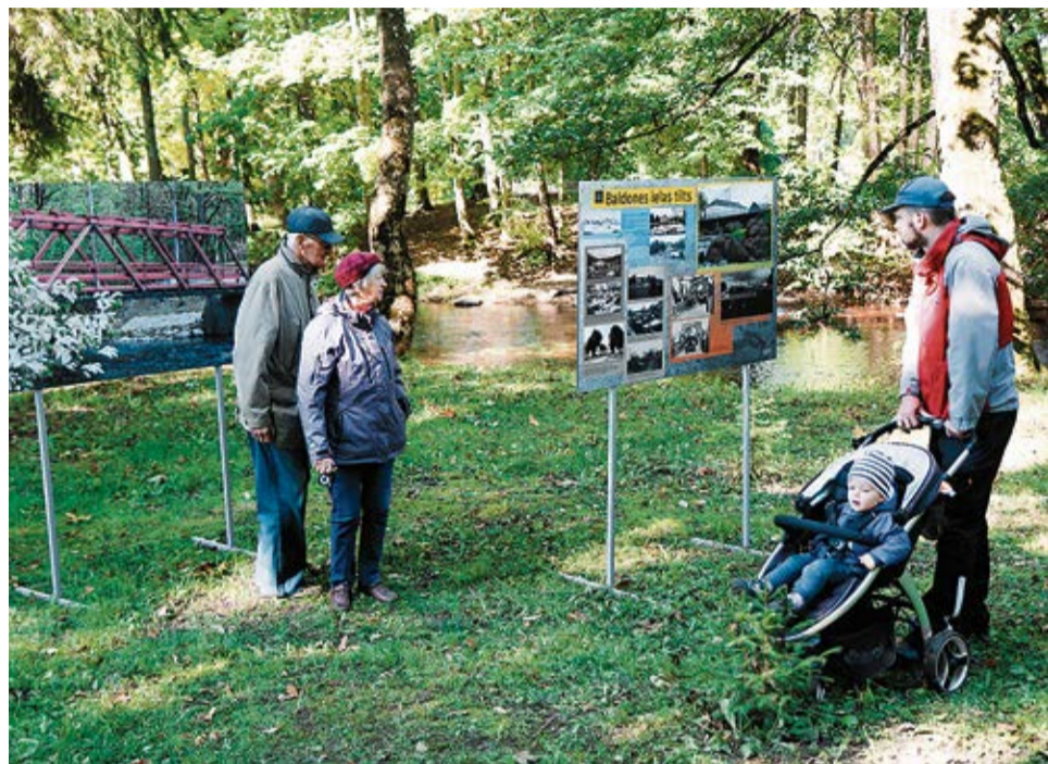
Informatīvie stendi Iecavas parka apmeklētājus izglītos un priecēs arī pēc pasākuma.