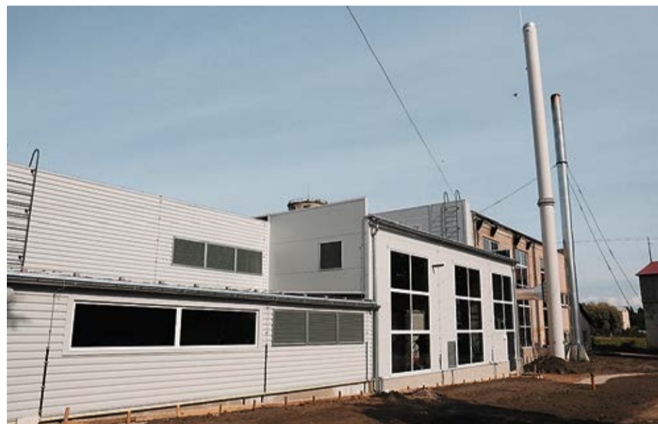
Katlumājā Grāfa laukumā 5 ir saglabātas dabasgāzes iekārtas, bet piebūvētajās telpās izvietots jaunais šķeldas kurināmais ūdenssildāmais katls. Notiek iekšdarbi.

Par projektu aktualitātēm pastāstīja SIA „Iecavas siltums” valdes loceklis Juris Drizļonoks ,