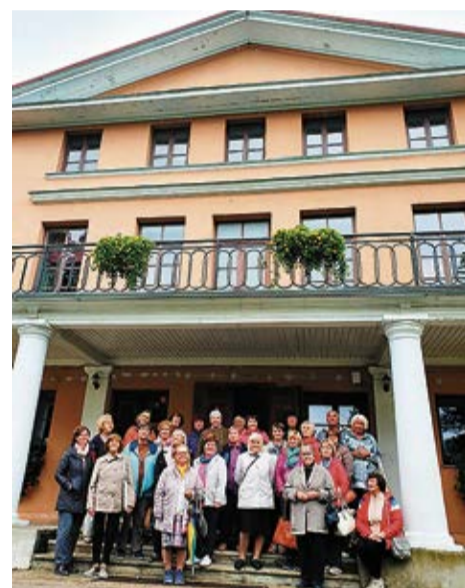
Aktivitāšu dalībnieki labā omā kopējā foto.

Aizpildot izvērtējuma anketas, dalībnieki atzi-