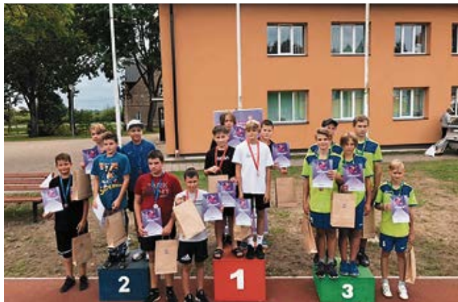
U13 komandas spēlētāji pēc spraigas cīņas laukumā. Izcīnīta 3.vieta.

Rolands Plēsnieks, Vecumnieku novada domes Sporta skolas treneris