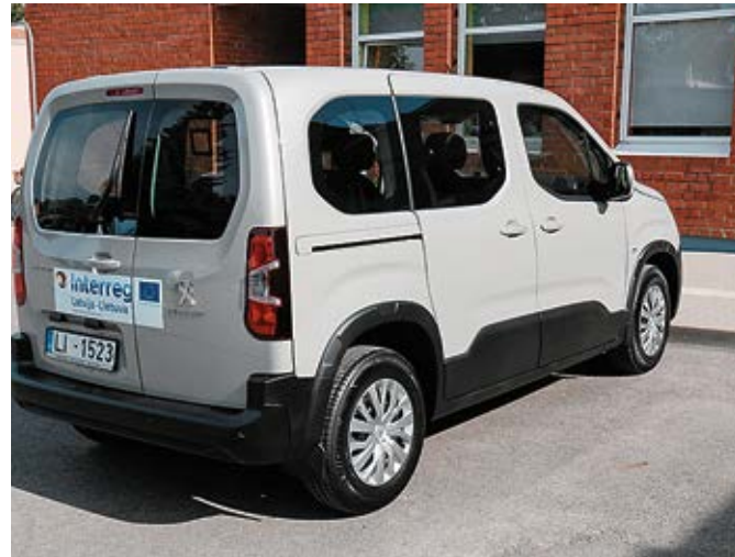
Automašīna iegādāta, pateicoties Iecavas novada pašvaldības dalībai Eiropas Savienības projektā.

Automašīna iegādāta, pateicoties Iecavas novada pašvaldības dalībai Eiropas Savienības projektā „Paaudžu iespēju stiprināšana sociālās iekļaušanās veicināšanai” (LLI-513, „Power of Generations”), kas tiek īstenots Interreg V-A Latvijas-Lietuvas pārrobežu sadarbības programmas 2014-2020 ietvaros. Projekta mērķis ir uzlabot mājas aprūpes un sociālo pakalpojumu pieejamību un efektivitāti Pakrojas (Lietuva) un Iecavas (Latvija) pašvaldībā vientuļiem senioriem, cilvēkiem ar īpašām vajadzībām, sociālā riska ģimenēm ar bērniem