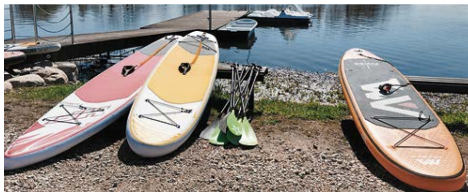
Ar pašvaldības atbalstu iegādātie SUP dēļi Rundāles ūdensdzirnavās.

2019. gadā tika apstiprināti četri projekti uzņēmējdarbības uzsākšanai vai uzņēmuma attīstībai. Līdzfinansējumu projektu mērķi ir bijuši ļoti dažādi, tādi kā, piemēram – tehnikas iegādei grāvju rakšanas darbiem un jaunu darbavietu radīšanai, tiešsaistes skolai „Mans sapņu dārzs”, kas paredzēja nodarbības un konsultācijas sava dārza ierīkošanā. Slīpētu fasādes apdares dēļu un bērnu ragaviņu ražošanai, kā rezultātā tika iegādāti dažādi instrumenti. Kā arī ūdens inventāra iegādei – katamarāniem, laivām un SUP dēļiem, lai īstenotu iespēju ģimenēm baudīt atpūtu uz ūdens Rundāles ūdensdzirnavu ezerā.