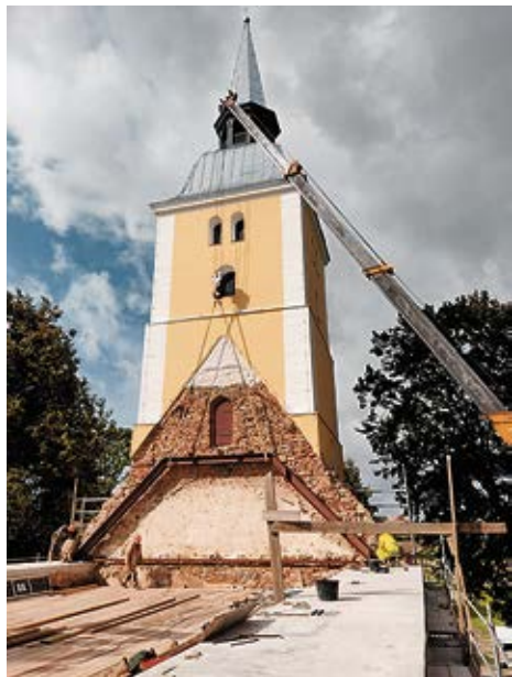
Mežotnes baznīcas atjaunošana.

Ralfs Simanovičs, Bauskas novada pašvaldības iestādes „Rundāles novada dome” būvzinieris