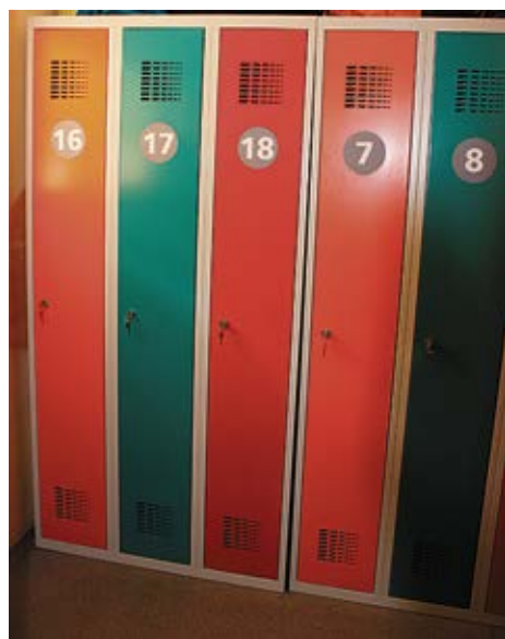
Košie ģērbtuves skapīši.

Misas pamatskolā šovasar īstenotas divas ilgi lolotas ieceres. Izremontēts un sakārtots jauno un veco pirmsskolas ēku savienojošais