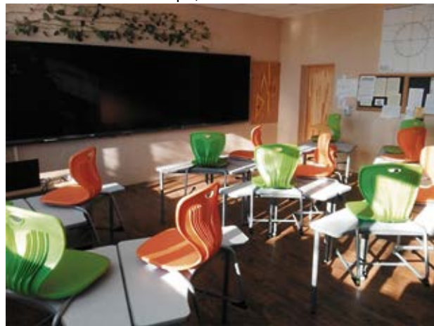
Mācību kabinets Skaistkalnes vidusskolā guvis otro elpu.

skolēniem iekārtos glītu garderobi ar individuāliem slēdzamiem skapīšiem. Tie ir koši