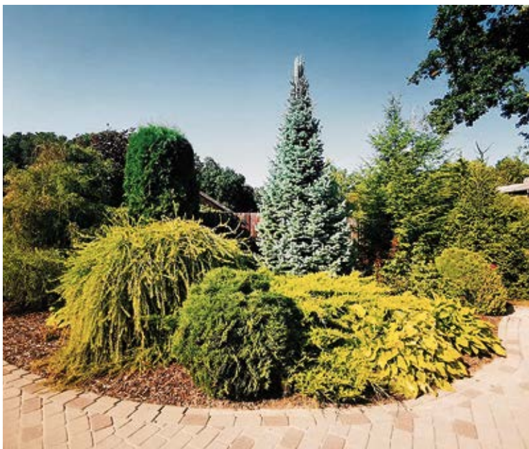
Gaumīga, saskaņota un darbā aizņemtam cilvēkam draudzīga dobe, kas priecē saimnieku un viesus.

Kā jau katru gadu, arī šovasar norisinājās konkurss, kurā tika vērtētas Rundāles, Svitenes un Viesturu pagasta sētas. Dalībniekus vērtēja divās grupās: „Lauku sētas ārpus apdzīvotām vietām” un „Ģimenes mājas apdzīvotās vietās”.