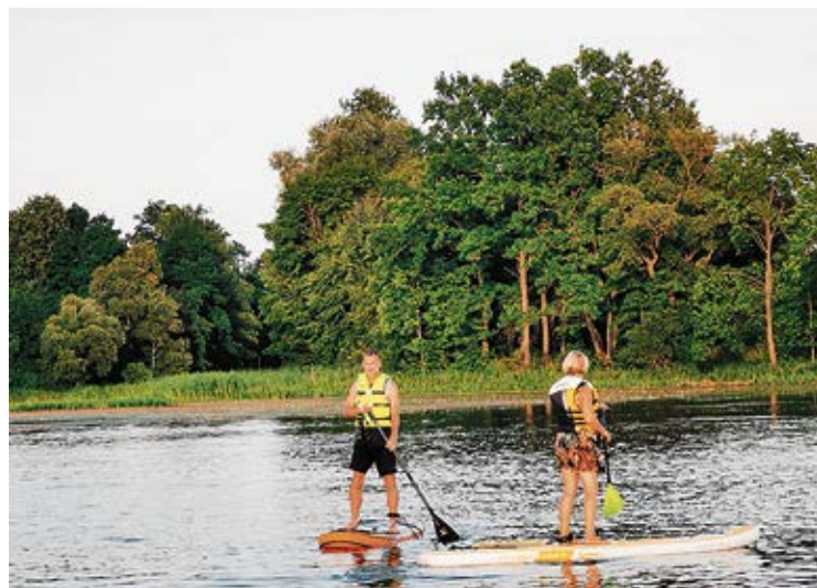
Interesenti varēja izmēģināt SUPot prasmi.

Aktivitātes tiek nodrošinātas projekta „Pasā-