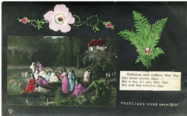
20.gs. sākuma un 1920-to gadu sākuma Līgo svētku pastkartes.

Līgo svētku apsveikumu kartītes pasta piedāvājumā no jauna parādījās Atmodas laikā 1980-to gadu beigās, kad tika atjaunota oficiāla šo svētku svinēšana. Visbiežāk tās bija attiecīgas tematikas fotogrāfijas - dabas ainavas ar uguns kuriem vai kompozīcijas ar alus kausiem, sieru, ozollapu vainagiem u.tml. Šādas apsveikumu kartītes turpināja būt piedāvājumā arī 1990-tajos gados. Vienu laiku 1990-to gadu beigās un 2000-šo gadu sākumā bija pieejamas arī Līgo svētku tematikai veltītas mobilo telefonu fonu bildes, ko par attiecīgu samaksu ar īsziņas palīdzību varēja