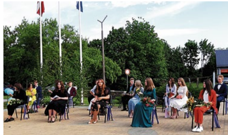
Mūzikas skolas audzēkņu izlaiduma svinīgais pasākums.

Vairāki absolventi saņēma Pateicības rakstu par labu un teicamu mācību darbu. Klātesošie uzzināja arī dažas visus skolas gadus slēptas lietas un nedarbus, absolventu skolas gadu lielākos izaicinājumus