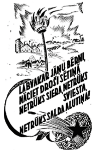
1940-to gadu beigu un 1950. gadu Līgo svētku apsveikumu kartītes.

Trešā grupa ir Līgo svētku apsveikumu kartītes, kas izdotas pēc Otrā pasaules kara 1940-to gadu beigās un 1950-tajos gados, kad vēl Līgo svinēšana padomju okupētajā Latvijā nebija aizliegta. Šīs kartītes bija mākslinieku, grafiķu, zīmētas, tautiskas, ar Līgo svētkiem raksturīgiem ozollapu vainagiem, papardēm, ziediem, alus kausiem, siera rituļiem un uguns kuriem, ko visu nereti papildināja arī