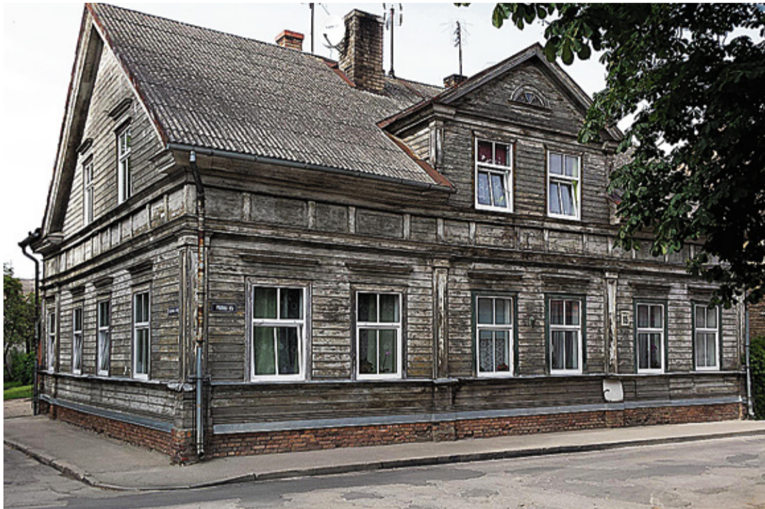
Ēka Plūdoņa ielā 15. 2017. gads, I. Līnes foto.

taurēt šo kādreiz tik skaisto koka celtni. Ēka ļoti iegūta, ja tiktu atjaunots arī tās sākotnējais holandiešu tipa māla dakstiņu jumta segums, pēc vēsturiskiem paraugiem