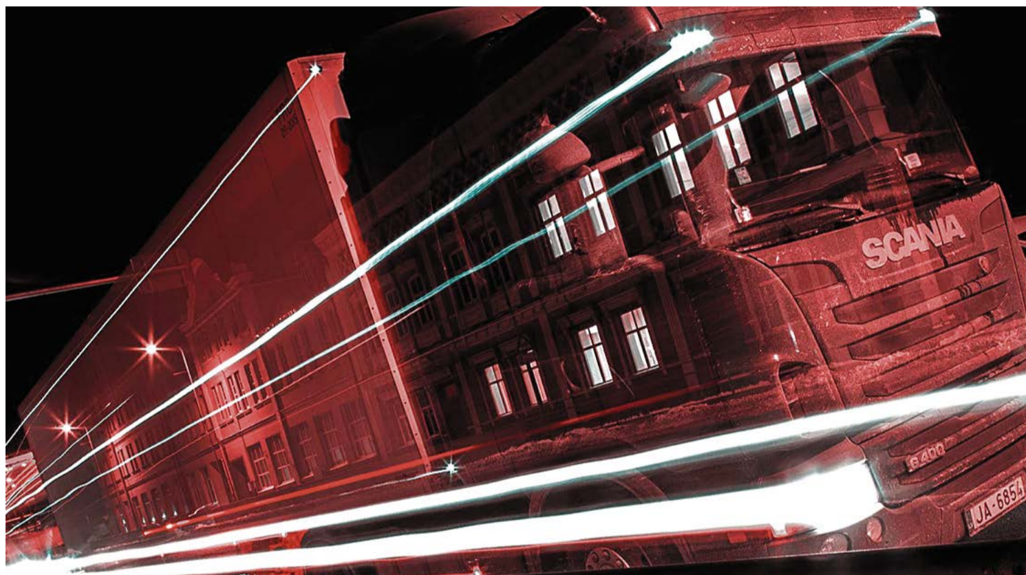
Dramatiski augošā tranzīta satiksmes plūsma pilsētā jau sen kļuvusi nesamērīga ar mazpilsētas apmēriem.

Jautājums par Bauskas pilsētas apvedceļu ir bijis aktuāls jau kopš deviņdesmitajiem gadiem un ar katru gadu, pieaugot satiksmes intensitātei, jautājuma aktualitāte aizvien pieaug. Šobrīd, ciņā par Bauskas apvedceļa izbūvi iesaistījusies arī biedrība „Bauskas vecpilsēta”, kas, ne vien sagatavojusi argumentētu vēstuli par nepieciešamību pārskatīt valsts autoceļu attīstības prioritātes, bet, izveidojot iniciatīvu platformā ManaBalss „Apvedceļu Bauskai”, ikvienam dod iespēju ar savu parakstu apliecināt apvedceļa izbūves aktualitāti.