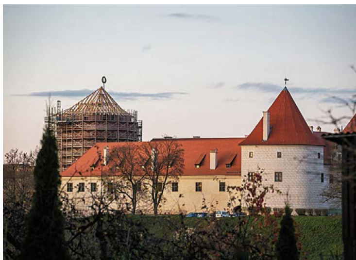
Bauskas cietokšņa glābšana - restaurācijas darbi rit vairāk nekā divdesmit gadus.