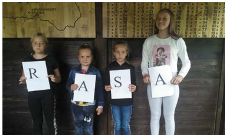
Bērniem bija sagatavoti dažādi uzdevumi - krustvārdu miklas, galda spēles, konkursi u.c.

Līvija Šarķe, Dāviņu pagasta pārvaldes vadītāja