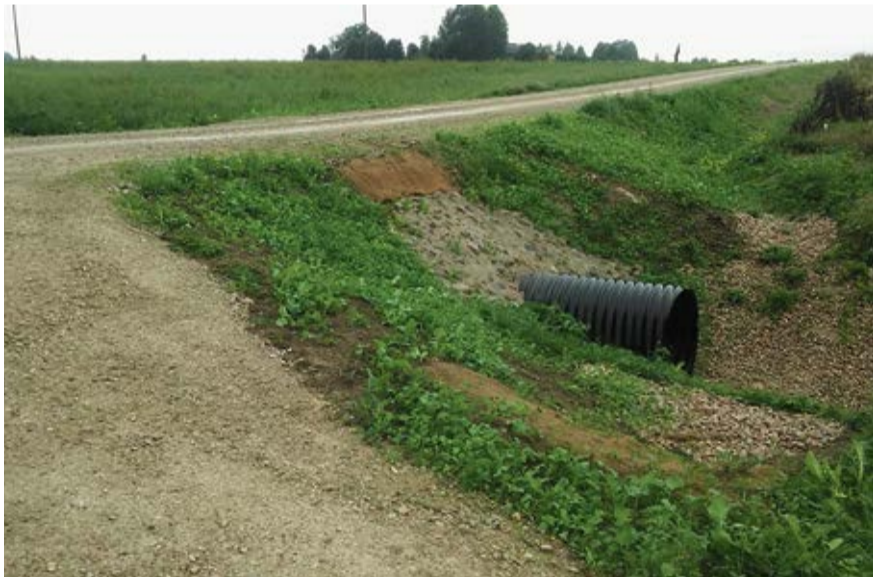
Pārbūvētais grants ceļš „Mežotne - Bajāri - A1”.

Veiksmīgi noslēgusies projekta „Bauskas novada pašvaldības grants ceļu pārbūve Mežotnes pagastā” īstenošana. Tā rezultātā ir pārbūvēti trīs ceļu posmi 6,103 km garumā, proti, veikta pagasta grants ceļa „Mežotne - Bajāri - A1” posma pārbūve 2,497 km garumā, grants ceļa „Bērzu muiža - Ciņi - Internātvīdusskola” posma pārbūve 2,375 km garumā un grants ceļa „Lidumnieki - Mežstrautnieki” posma pārbūve 1,231 km garumā. Pārbūvējamie ceļu posmi bija ļoti sliktā stāvoklī, daudzviet izveidoju