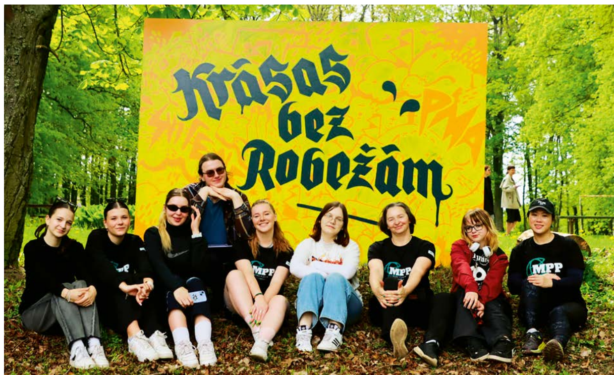
Grafiti dienu organizatoru komanda.

Ir apstiprināts biedrības „Mums pieder pasaule” iesniegtais „Eiropas Solidaritātes korpusa” projekts „Skaistums katrā sīkumā”. Tā laikā būs atvērto durvju diena jauniešu vecākiem, jaunieši veidos fotoizstādi, kopā ar iedzīvotājiem stādīs pavasara