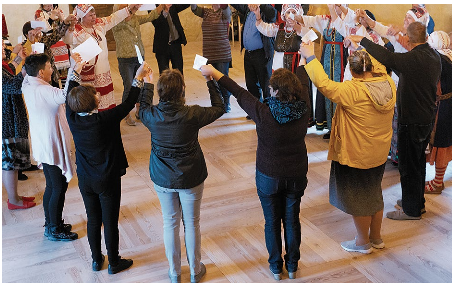
Biedrība „BM studio”. Krieviņu Saiets „Ražas svētki Bauskas pilī 2019”.