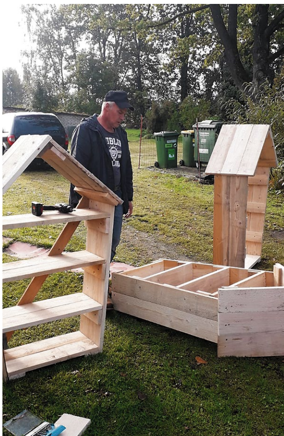
NVO Biedrība „Domāsim, darīsim” Zaļā dzīvesveida ABC.