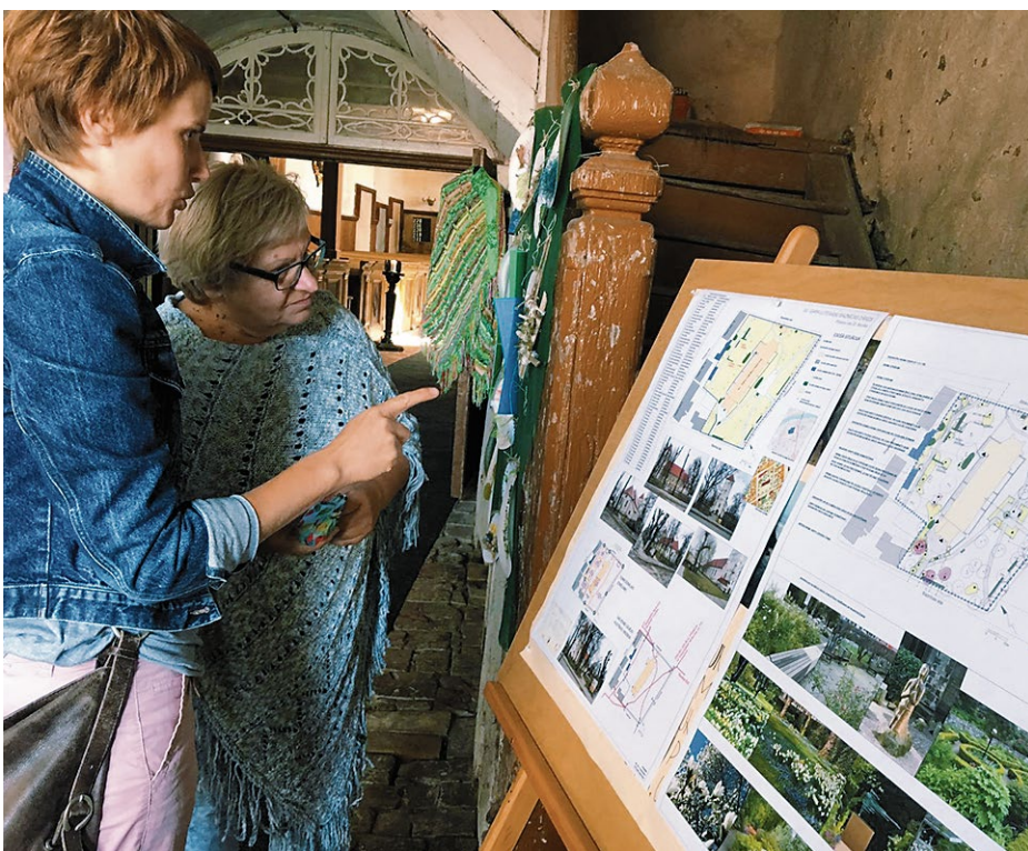
Biedrība „Bauskas vecpilsēta”. Baznīcas dārzs.