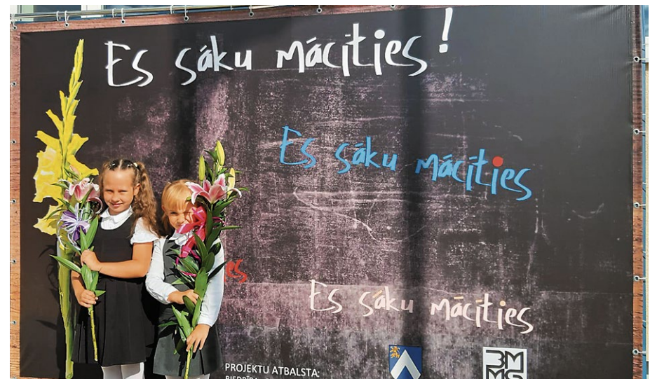
Biedrība „Bauskai un mūzikai”. Pirmā pirmiena.