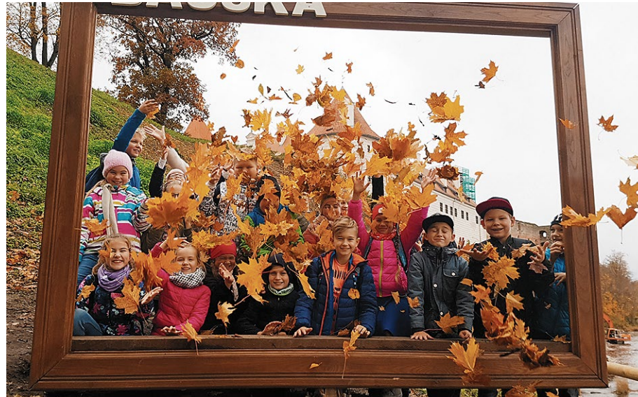
Biedrība „Bauskas sākumskolas padome. “ Foto rāmis „Pastkarte no Bauskas”.