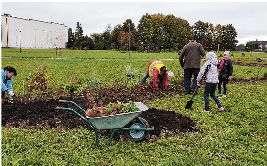
Biedrība „Īslīces sieviešu klubs „Rītausma””. Aktīva atpūta sakoņtā vidē.