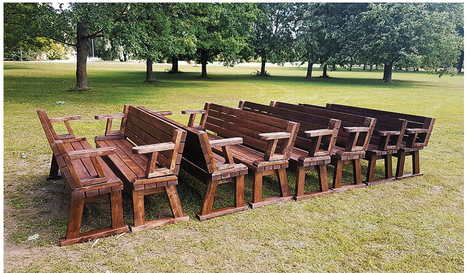
Biedrība „Veselīga dzīvesveida skola”. Piknika galdīņu izveidošana „Akmens parkā” Uzvaras ciemā.