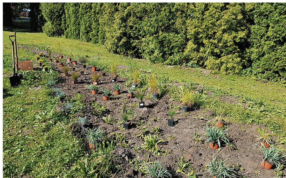
Biedrība „Stīgas ED”. Darīsim kopā.

Īpaši jāuzteic biedrības „Meistars Gothards” projekts „Uzplaukšana”, kurš Latvijas Pašvaldību savienības 2019. gada projektu konkursā „Sabiedrība ar dvēseli - Latvija” ieguva veicināšanas balvu. Projektu konkursa noslēguma pasākums notiks 2020. gada 7.martā Bauskas novada Īslīces kultūras namā!