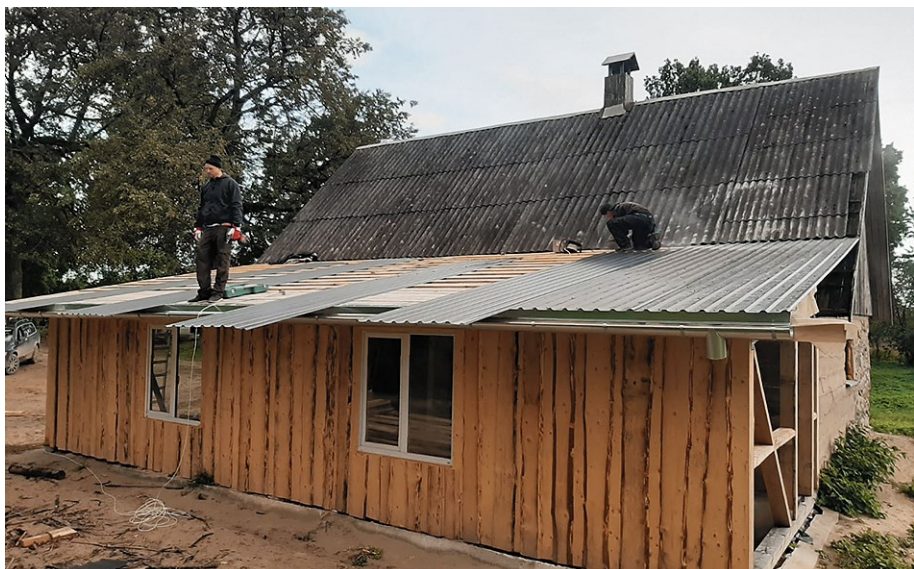
Biedrība „Vecsaules pagasta mednieku klubs”. Novērtē, izbaudī un izjūti dabas skaistumu Mednieku mājā „Gulbji”.