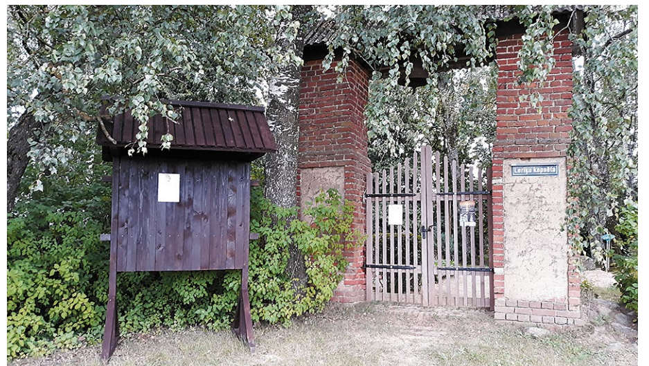
Vecsausles Evaņģēliski Luteriskā draudze. Teritorijas labiekārtošana – tualetes un informācijas stendi Vecsausles Ev.Lut. draudzes kapos.

„Bauskas Novada Vēstis” lasāmas arī Bauskas novada mājas lapā www.bauska.lv