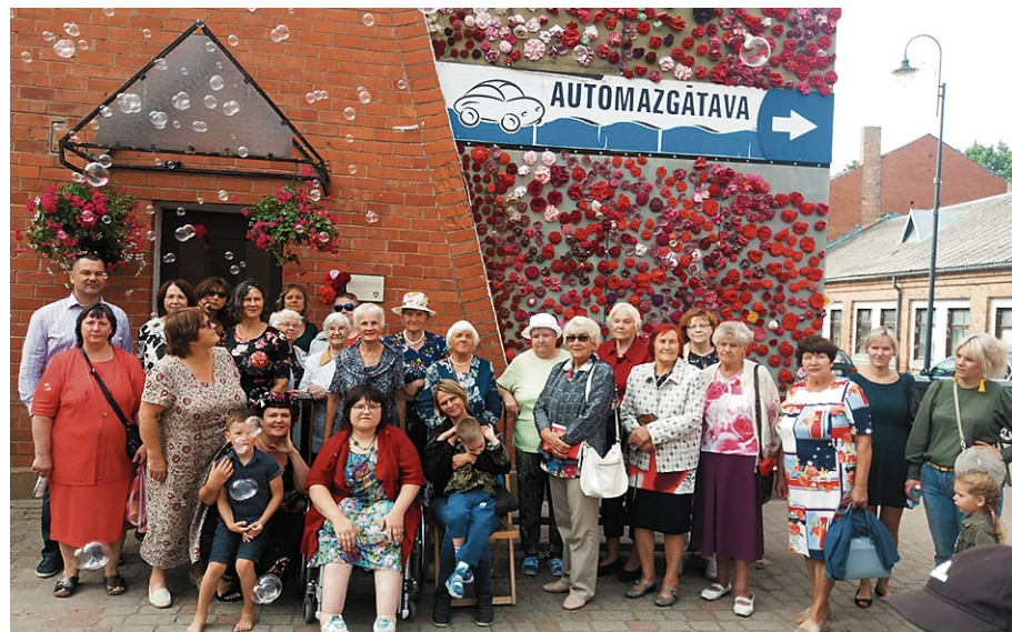
Biedrība „Meistars Gothards”. Uzplaukšana!