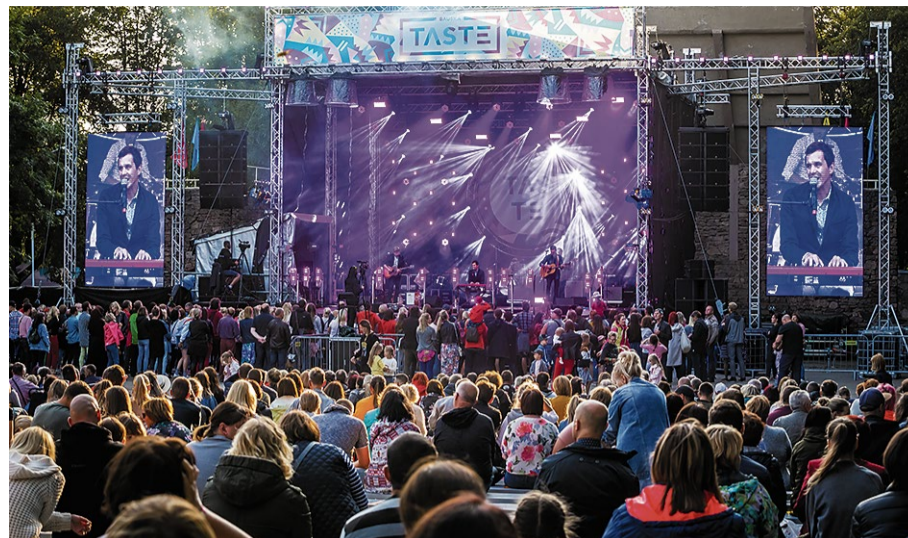
Grupās „Autobuss debesīs” uzstāšanās laikā uz skatuves mūzikas ritmiem līdzī šūpojās vairākas paaudzes