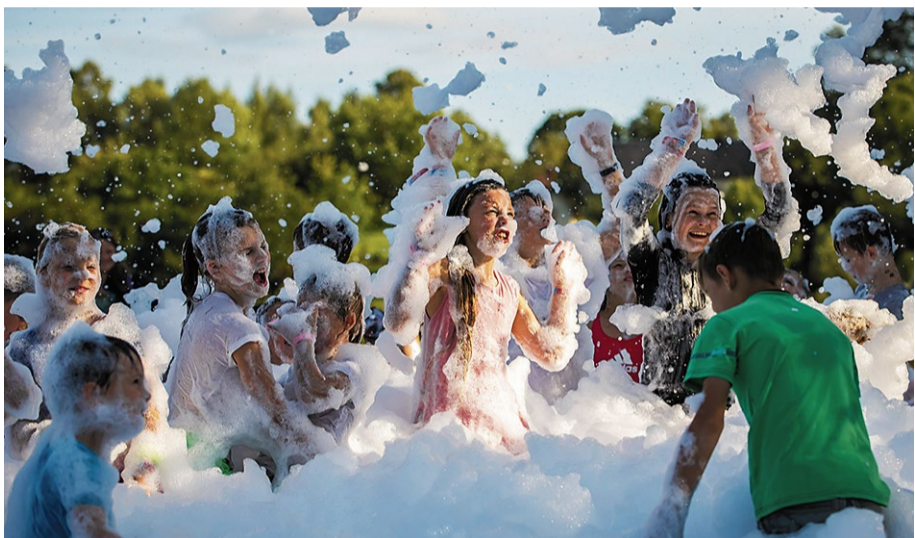
Bērni līkmoja un priecājās „Kids Wonderland” aktīvās atpūtas zonā