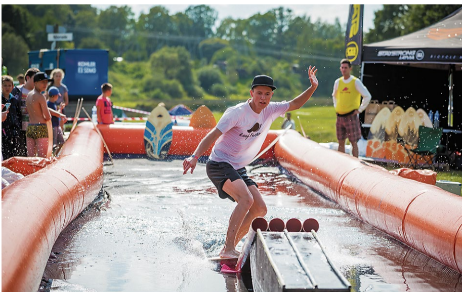
Aktīvās atpūtas cienītājiem bija iespēja iepazīties ar ūdens sporta veidu – skimbordu