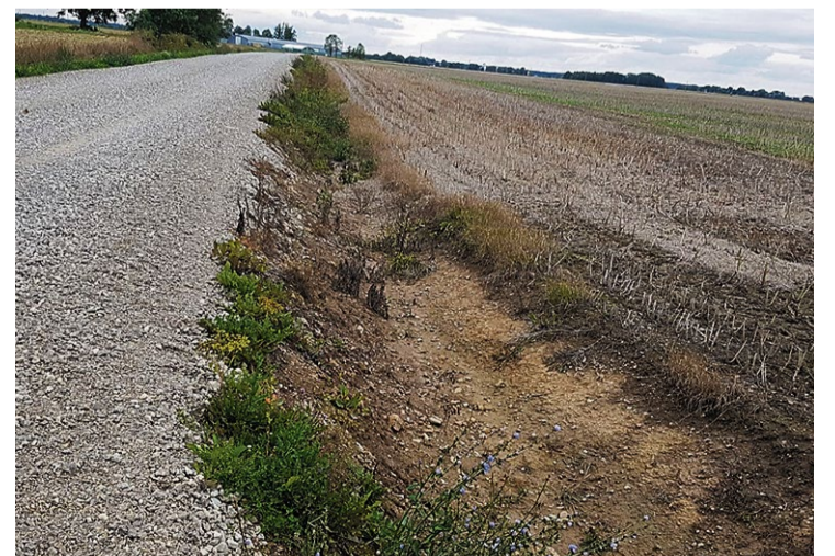
Šādi veidots arums neveido valni, kas aiztur ūdens noteici no ceļa virsmas

„Bauskas Novada Vēstis” lasāmas arī Bauskas novada mājas lapā www.bauska.lv