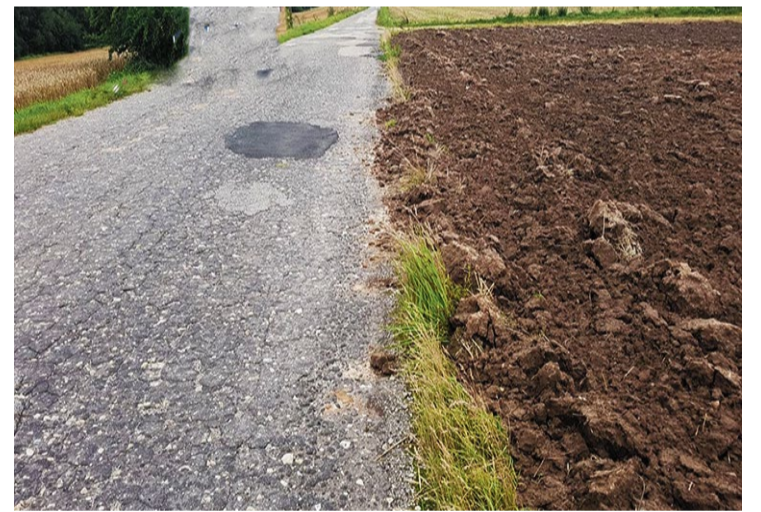
Dažviet lauks tiek aparts pat tik tuvu ceļa malai, ka jau tiek skarts tā segums