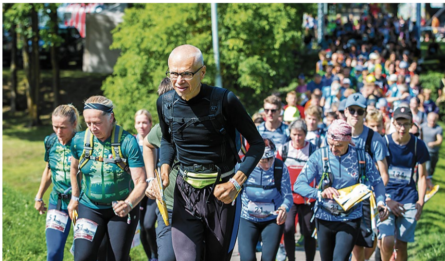
Festivāla tradīcija, kas tika īstenota arī šogad, ir Bauskas rogainings, kuru rīko sporta un aktīvās atpūtas apvienība „Magnēts”