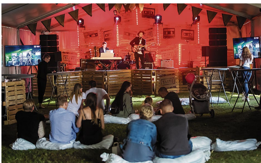
Uz festivāla mazās skatuves divu dienu garumā uzstājās jaunie un vietējie mūziķi