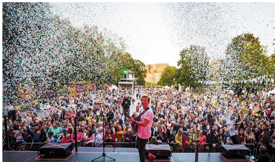
„The Sound Poets” koncertu skaistā svētdienas pievakarē baudīja tūkstošiem klausītāju un skatītāju