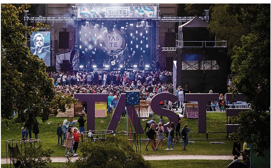
Trešo „Bauska TASTE” festivālu apmeklēja 10 000 cilvēku