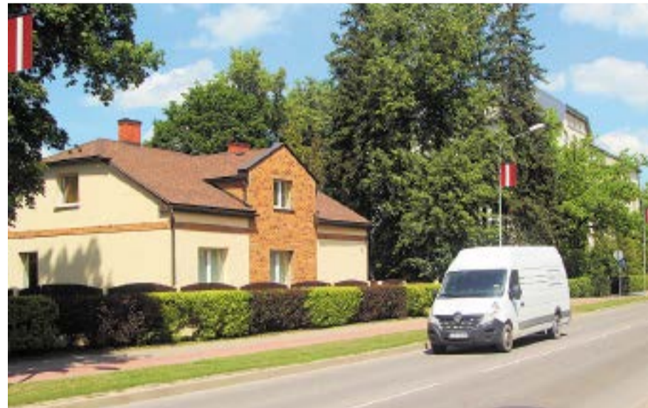
Uzvaras iela mūsdienās.