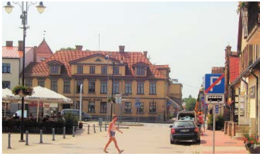
Bauskas muzejs un Rīgas ielas posms mūsdienās.