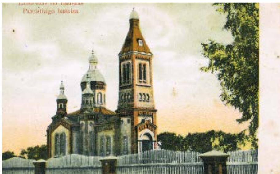
Skats uz Sv. Georgija pareizticīgo baznīcu 20.gadsimta sākumā.