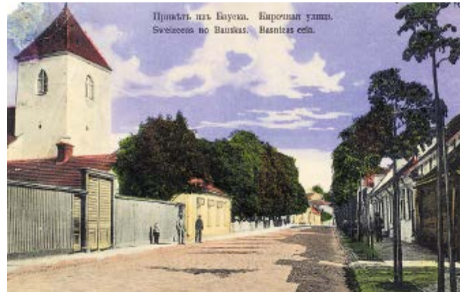
Skats uz Baznīcas ielu no toreizējās Sudmalu ielas. 20.gadsimta sākums.