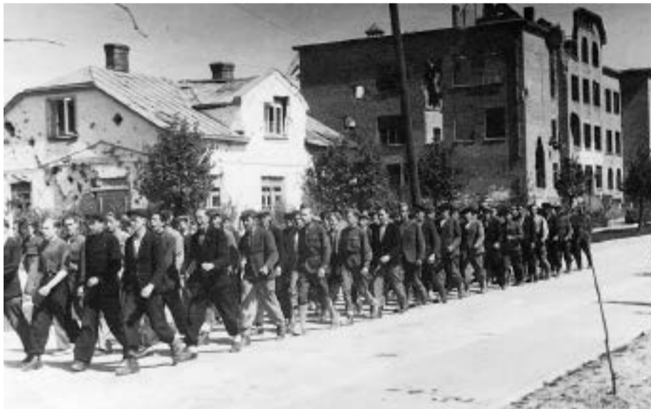
Uzvaras iela un jauniesaukto kolona. 1940.gadu otrā puse.