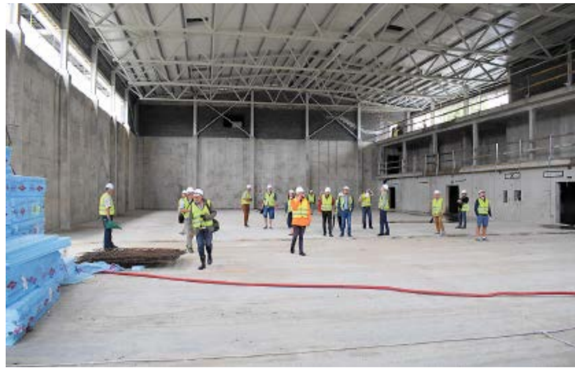
Būvspanulce 17.jūnijā, uz kuru tika aicināti arī visi Bauskas novada domes deputāti.

Bauskas novada domes deputāti 20.jūnijā Finanšu komitejas sēdē diskutēja par grozījumiem 2017.gada 3.maija līgumā Nr. BNA 2016/045 „Sporta halles izbūve profesionālās ievirzes izglītības iestādei” Bauskas novada Bērnu un jaunatnes sporta skola”. Grozījumi paredz papildu finansējuma piešķiršanu 1 187 447,95 eiro apmērā un pagarināt būvdarbu izpildes termiņu līdz 148 nedēļām.