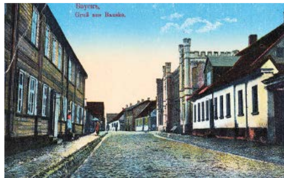
Nabagmājas iela 20.gadsimta sākumā.