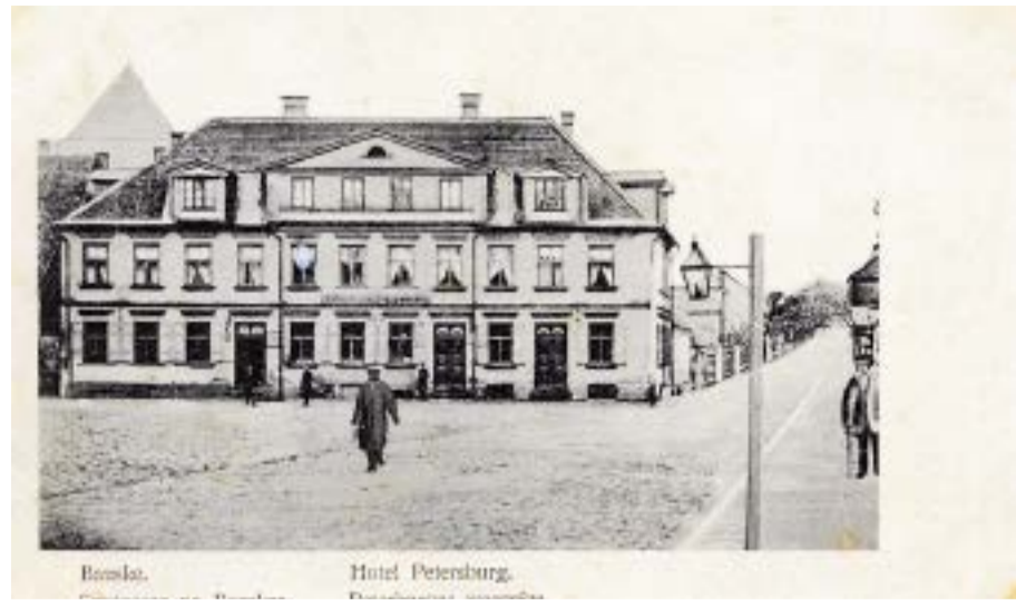
Pēterburgas viesnīca un Sudmalu ielas posms 20.gadsimta sākumā