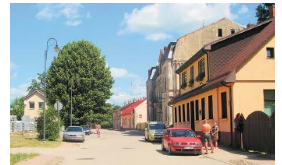
Rūpniecības iela mūsdienās.