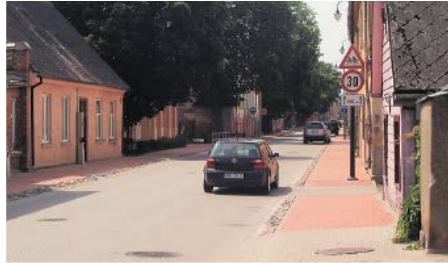
Rīgas iela pie Bauskas pilsētas pamatskolas mūsdienās.