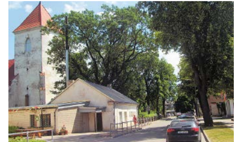
Skats uz Baznīcas ielu no Rīgas ielas. Mūsdienās.