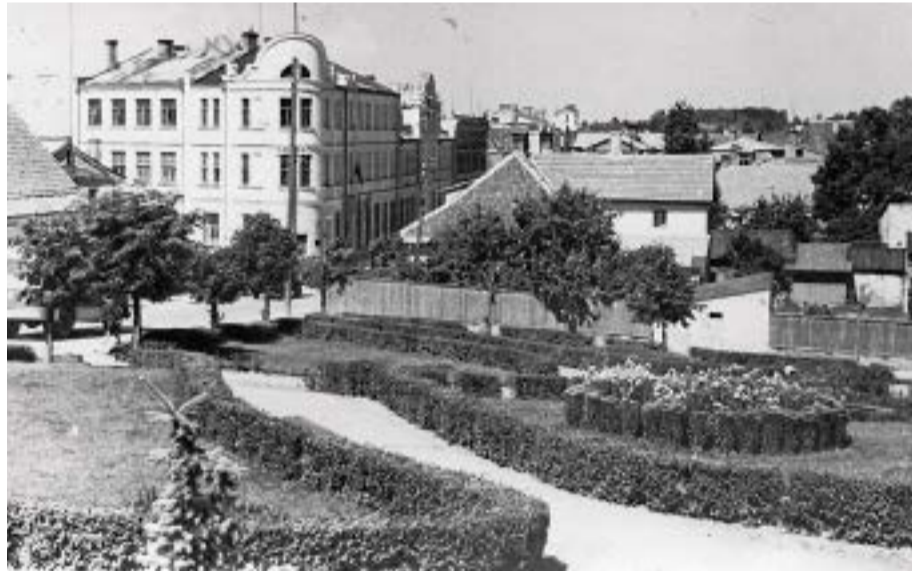
Skats uz Bauskas Kultūras namu 1960.gados.