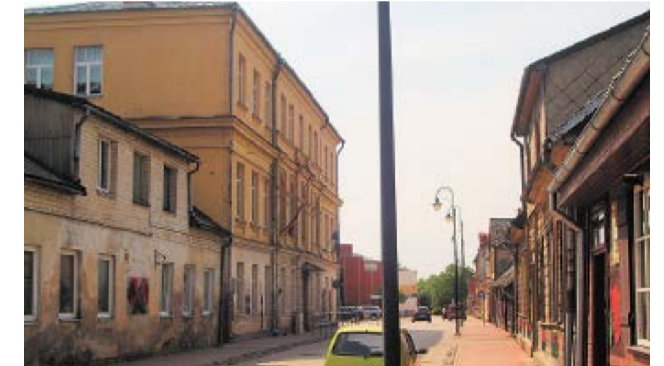
Tagadējā Rīgas iela ar Bērnu un jauniešu centra „Dzelteno māju”. Mūsdienās.