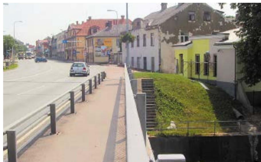
Mēmeles tilta gais un Kalna ielas sākums mūsdienās.