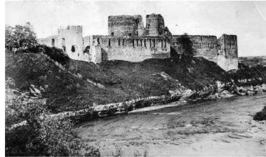
Bauskas pilsdrupas un Mēmele 20.gadsimta sākumā.