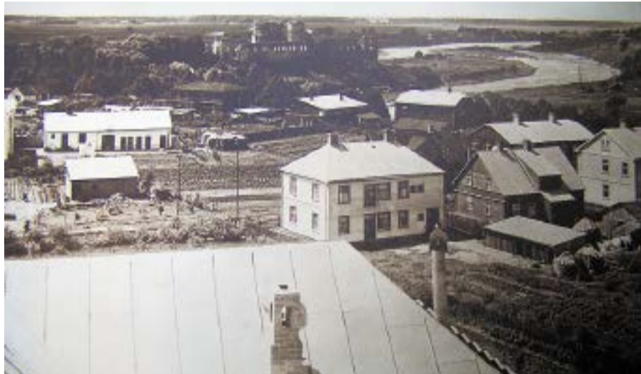
Skats no Bauskas ģimnāzijas tornīša Pilskalna virzienā. 1930.gadi.