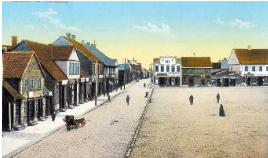
Toreizējā Sudmalu iela un Tirgus laukums 20. gadsimta sākumā.