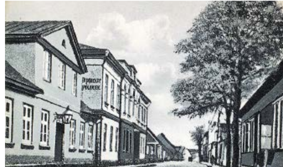
Kādreizējā Sudmalu iela ar Bauskas pilsētas skolu. 20.gadsimta sākums.