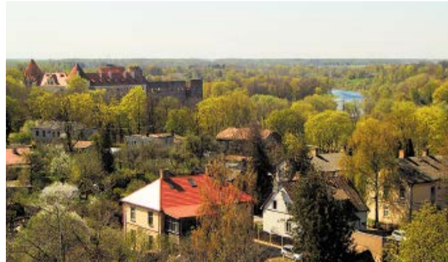
Skats no Bauskas Valsts ģimnāzijas tornīša Pilskalna virzienā. Mūsdienās.