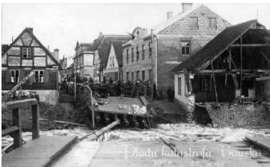
1928.gada plūdos sagrautais Mēmeles tilta posms un Kalna ielas sākums.