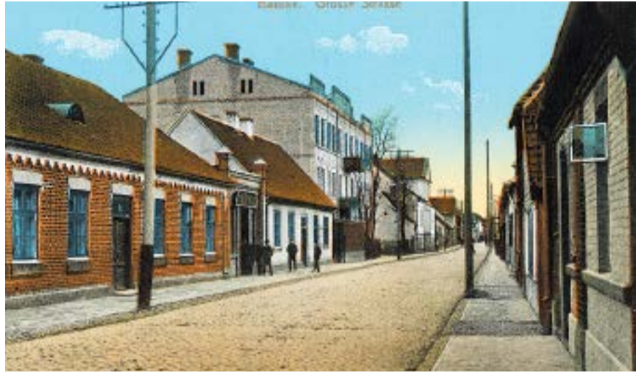
Kādreizējā Sudmalu iela pie Inas Kļaviņas zēnu progimnāzijas. Ap 1910.gadu.