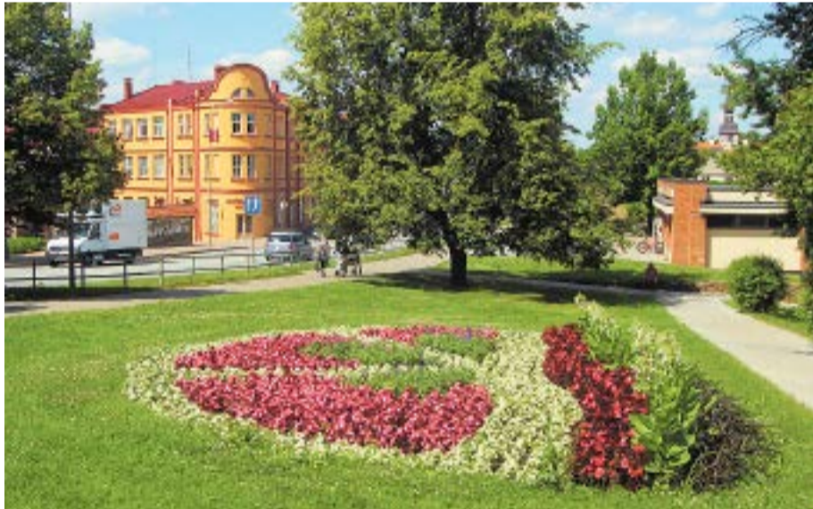
Skats uz Bauskas Kultūras centru mūsdienās.