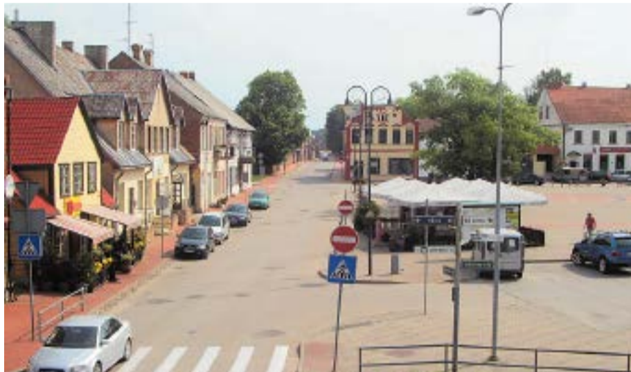
Rīgas iela un Rātslaukums mūsdienās.