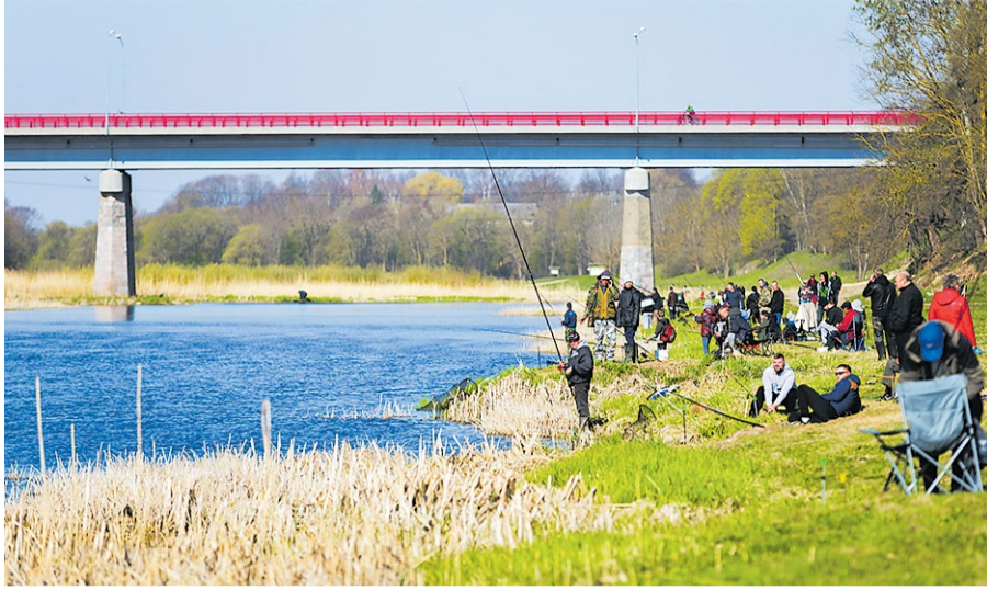
Pirmie makšķernieki Mūsas upes krastā pulcējās jau rīta agrumā