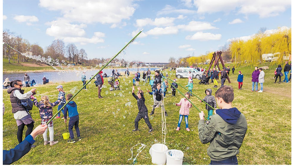
Ziepju burbuļi priecē gan lielus, gan mazus svētku apmeklētājus