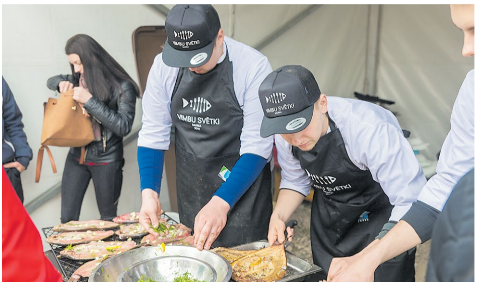
Saulaines teritoriālās struktūrvienības, Kandavas Lauksaimniecības tehnikuma jaunieši rūpējās, par gardām vimbām