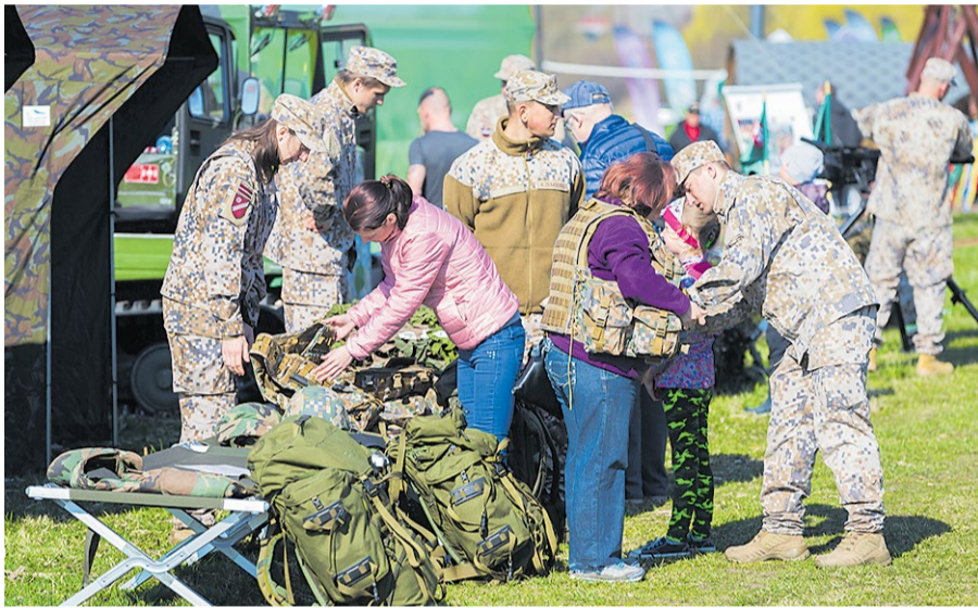
Zemessardzes 53. kājnieku bataljona zemessargi ļāva iejusties zemessarga ādā, uzmērot ekipējumu