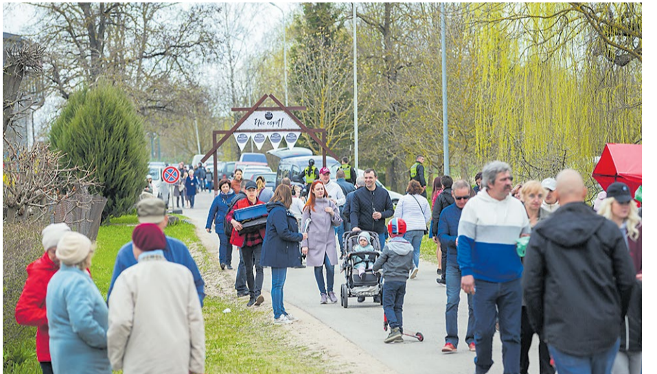
Uz un no „Vimbu svētkiem” varēja doties cauri īpašiem svētku vārtiem