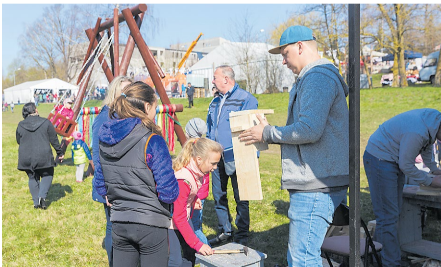
Pakur.lv darbnīcā varēja izgatavot savu putnu būrīti