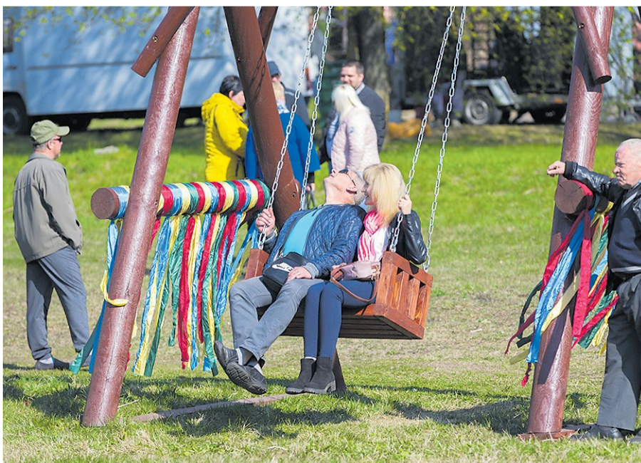
„Vimbu svētkos” netika aizmirsts arī par Lieldienu tradīcijām – apmeklētāji varēja šūpoties, krāsot olas