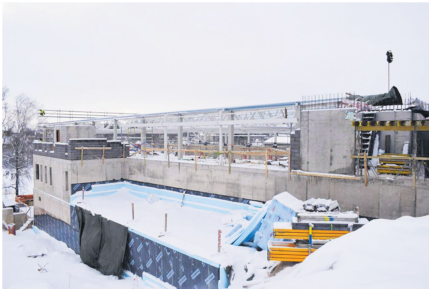
5.februārī tika atzīmēti jaunās Bauskas sporta halles spāru svētki.