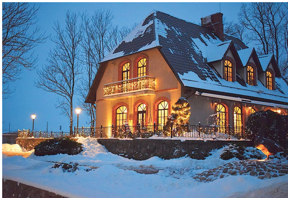
Atpūtas komplekss „Miķelis”