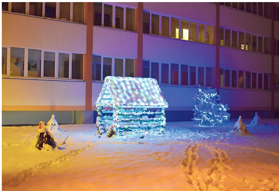
Ceraukstes pagasta pārvalde