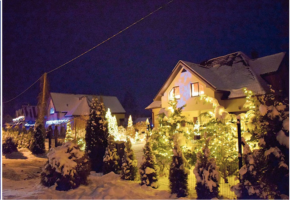
Individuālā māja Lakāju 13