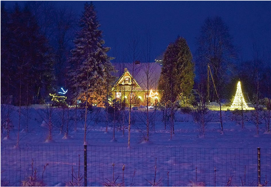
Individuālā māja „Ilgas”