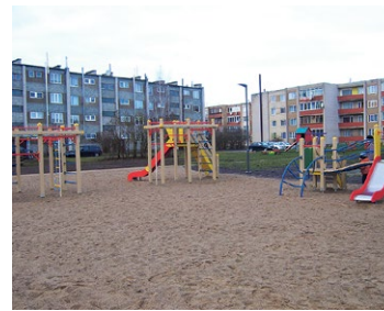
Lasiet par novadā īstenotajiem projektiem