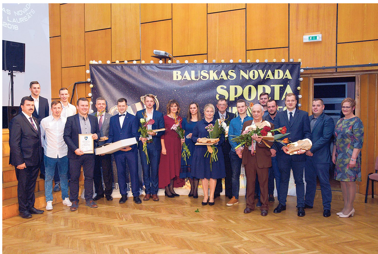
Ikgadējā svinīgajā pasākumā tika sumināti novada aktīvākie, sportiskākie ļaudis, sveikti vecmeistari un jaunie čempioni.

Īsu brīdi pirms pirms svētkiem Bauskas novada sportisti pulcējās savā, tradicionālajā sporta laureāta pasākumā, kad tika izvērtēti aizgājušā gada sasniegumi, sumināti novada aktīvākie, sportiskākie ļaudis, sveikti vecmeistari un jaunie čempioni.