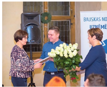
Uzņēmēju Gada balva 2018 Bauskas pils