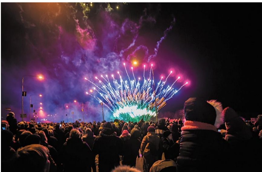
Skaistais simtgades salūts kā svētku kulminācijas brīdis, ko varēja baudīt noraugoties no Mēmeles tilta. Uz divdesmit minūtēm tika slēgta satiksme un cilvēki brīvi varēja vērot skaisto ugunošanu