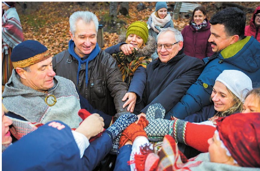
Vienoti roku rokā