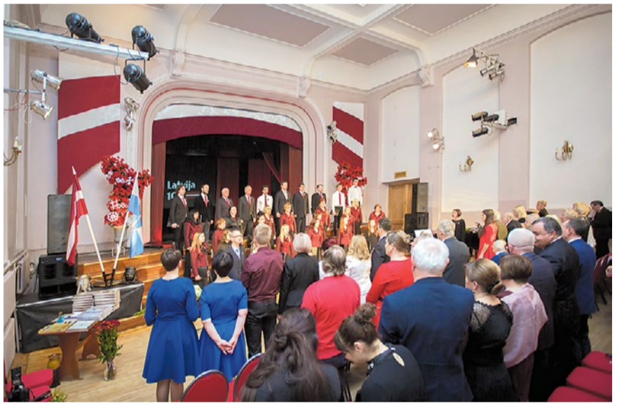
Svinīgais pasākums Bauskas Kultūras centrā