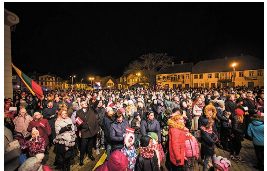
Simtiem baušķenieku svin Latvijas simtgadi