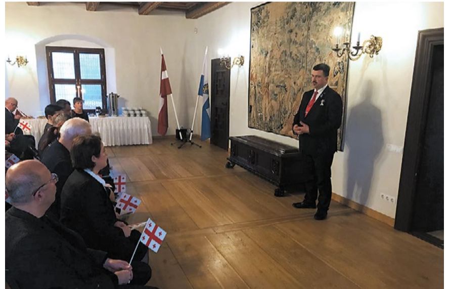
Svinīgā pieņemšana pie domes priekšsēdētāja Bauskas Rātsnamā