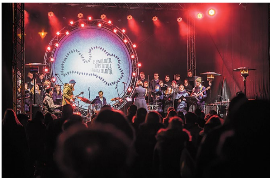
Simtgades sadziedāšanās Rātslaukumā kopā ar Mežotnes kori