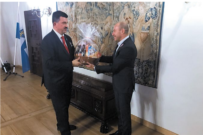
Paldies fotogrāfam Edgaram Namiķim par devumu 2019.gada Bauskas kalendāra izveidē