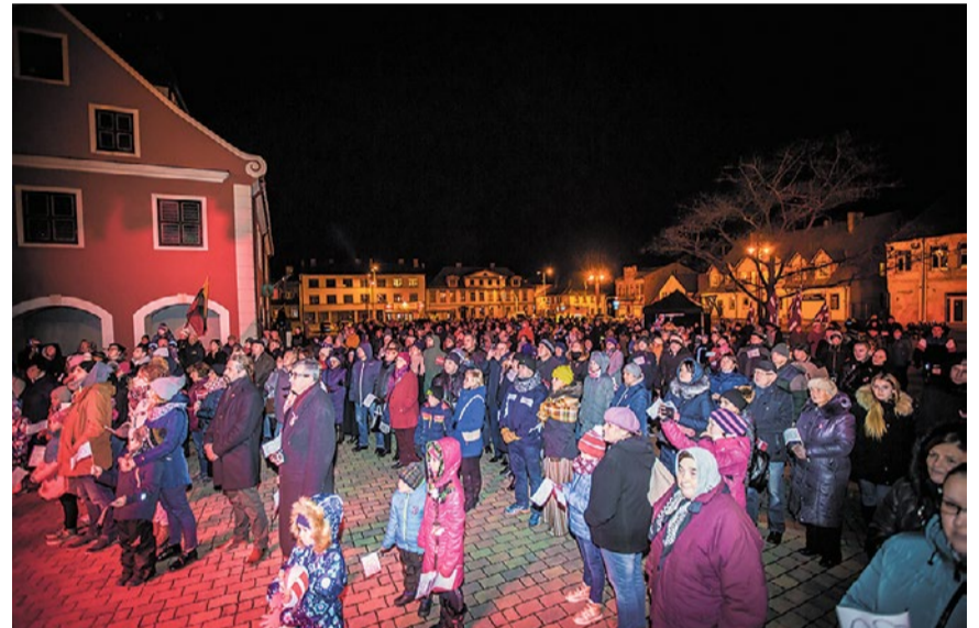
Simtgades sadziedāšanās Rātslaukumā