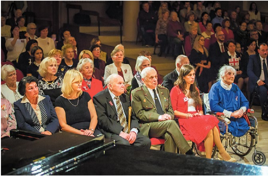
Uz svinīgo pasākumu tika aicināti un godināti iepriekšējo gadu pašvaldības augstāko apbalvojumu saņēmēji