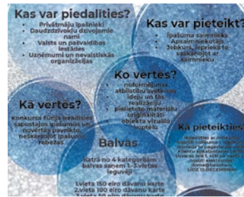
Lūkos Bauskas novada Ziemassvētku rotu