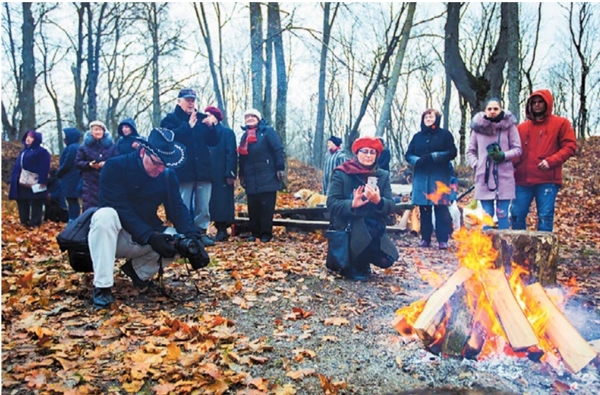
Saullēkta sagaidīšana simtgades rītā Mežotnes pilskalnā