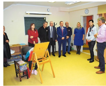
Bauskā viesojas delegācija no Hašuri un Sorokas