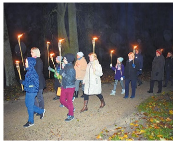
Atklāj labiekārtoto Garozas muižas parku