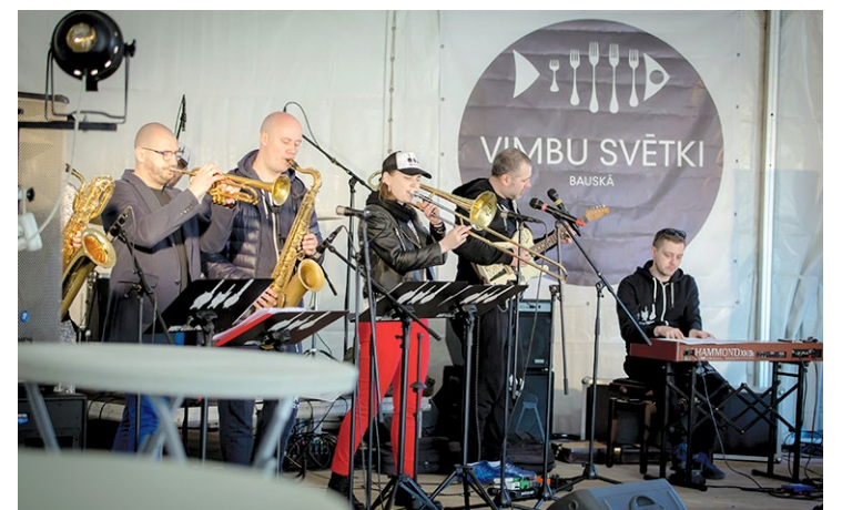
Svētkus kuplina grupa N[ex]t move