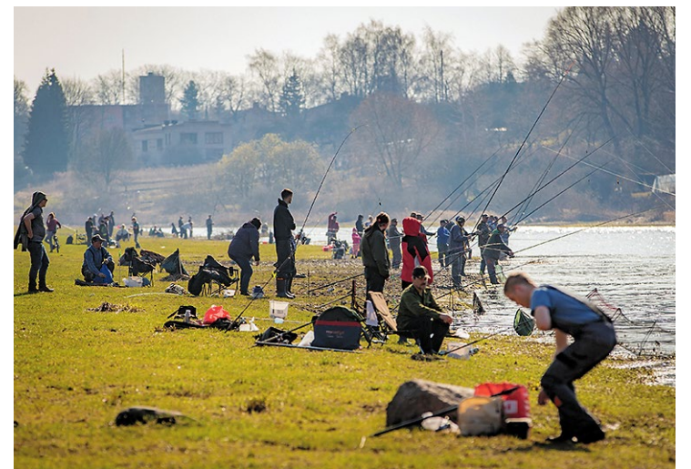
Vimbotāju svētku rosība Mūsas krastā