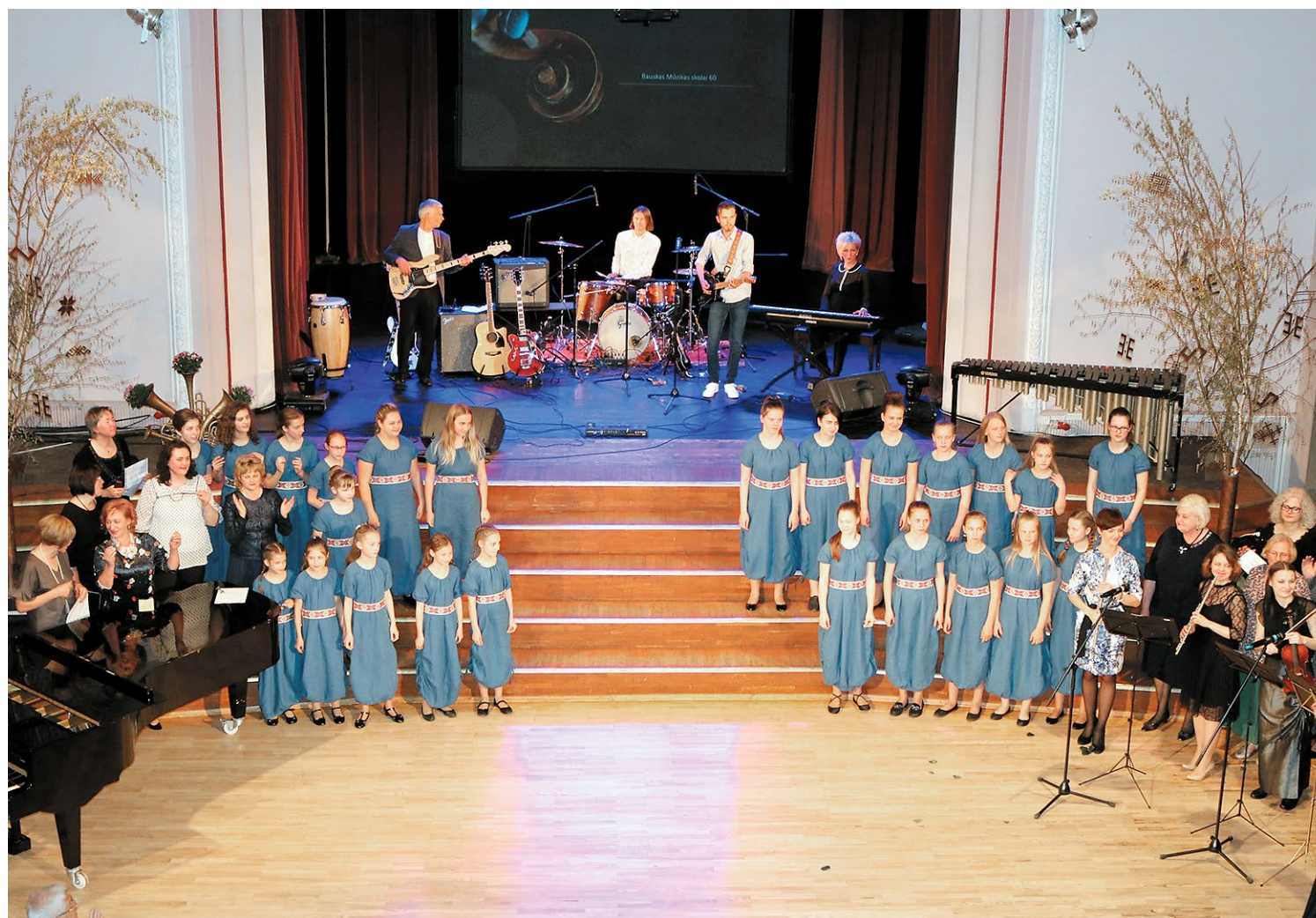
Skolas kolektīvs klausītājiem bija radījis skaistu svētku koncertu, savijot izjustus muzikālus priekšnesumus ar pārdomātiem un sirsniem vārdiem.