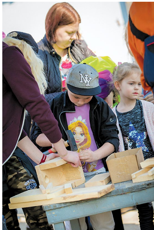
Zinātkārie un darbīgie varēja izveidot savu putnu būrīti