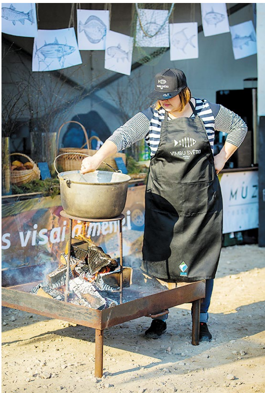
Restorāna „Mūza” pavāre rūpējas par gardo zivju zupu