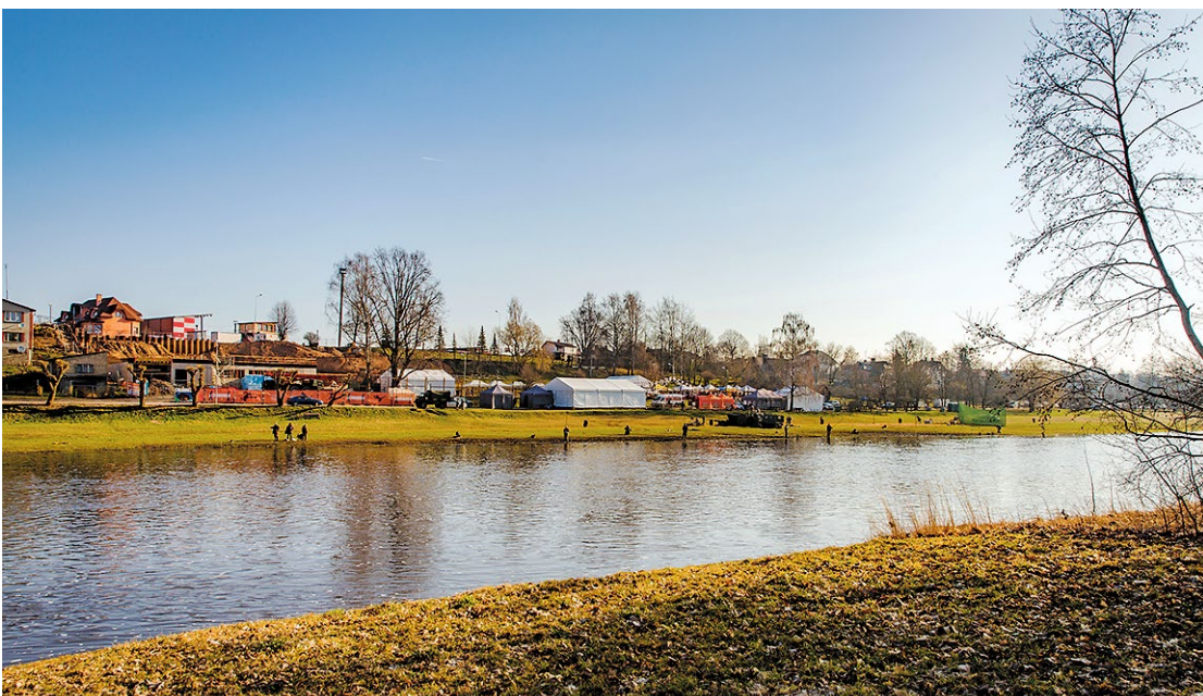
Vimbu svētku agrs rīts, pamazām slejas teltis un pulcējas makšķernieki