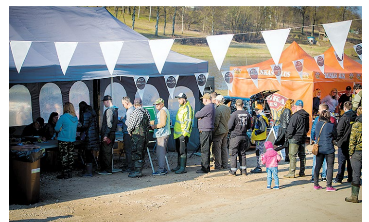
Īsteni copes entuziasti bija ieradušies vēl krietnu laiku pirms reģistrēšanās sākuma