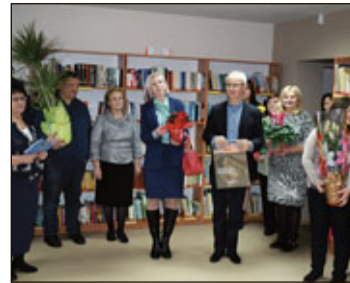
Ozolaines un Jaunsaules bibliotēka jaunās telpās