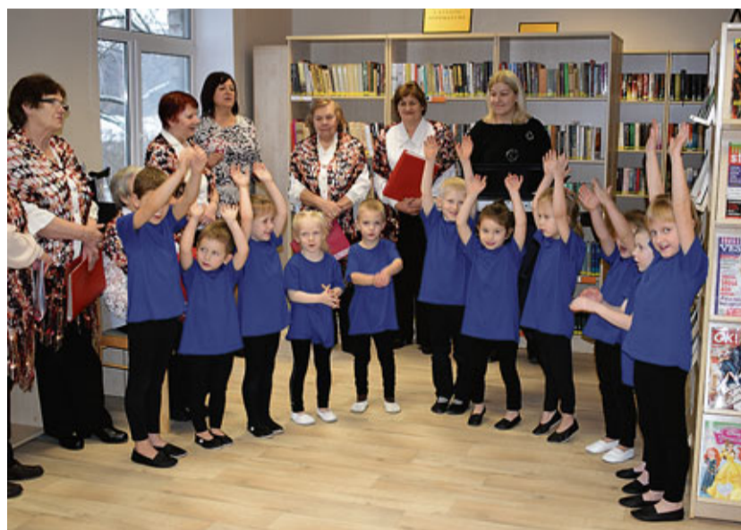
Jaunsaules bibliotēkas jaunās telpas

20.decembrī Vecsaulis pamatskolas telpās, kas atrodas Jaunsaulē Mēmeles krastā, atklāta Jaunsaules bibliotēka.