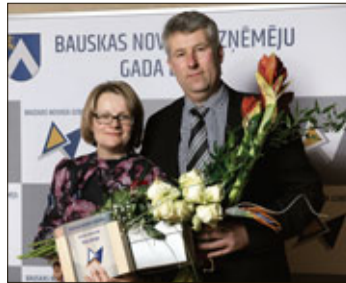
Bauskas novada Uzņēmēju Gada balva 2017