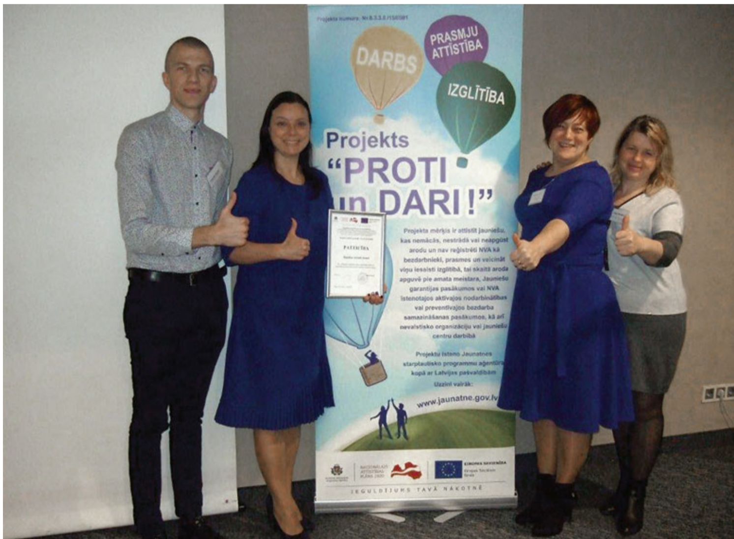
Bauskas novada pašvaldība saņēma Jaunatnes starptautisko programmu aģentūras pateicību par veiksmīgu sadarbību, lielu ieguldījumu darbā ar jauniešiem un precizitāti darbā ar projekta dokumentāciju.

Apritējis gads kopš Bauskas novadā tiek realizēts projekts „PROTI un DARI!”. Tajā iesaista jauniešus, kuri pašlaik nemācās, nestrādā un neapgūst arodu.