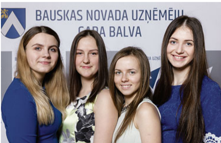
Balvu nominācijā „Skolēnu mācību uzņēmums 2017” saņēma SMU „Palutini sevi”