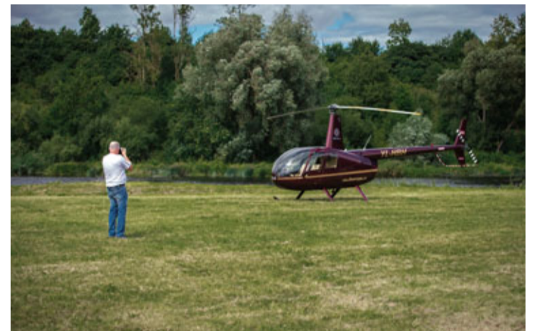
Apmeklētāji Bausku varēja skatīt no putna lidojuma