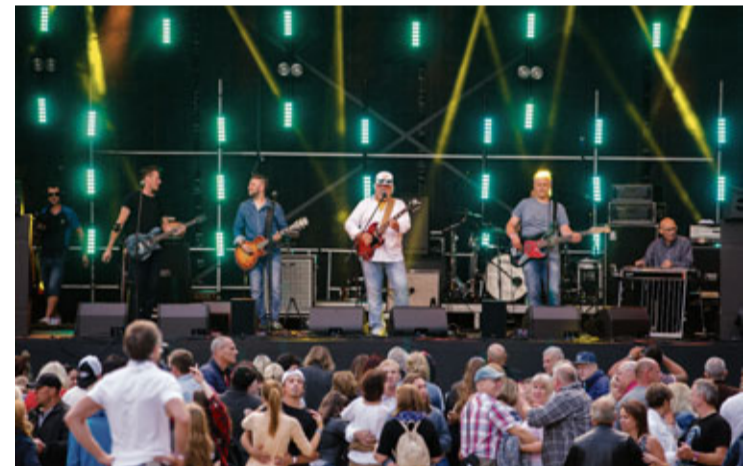
„Dakota” priecēja gan ar labi zināmiem skaņdarbiem, gan dziesmām no pēdējā albuma