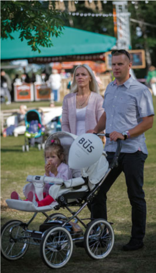
Pasākumu labprāt apmeklēja ģimenes ar bērniem