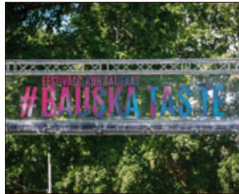
Fotoieskats festivālā „Bauska TasTe”