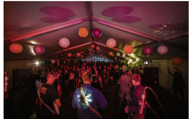
Radio SWH raidījuma „Priekšnams” skatuvē uzstājās jauni un daudzsološi mākslinieki