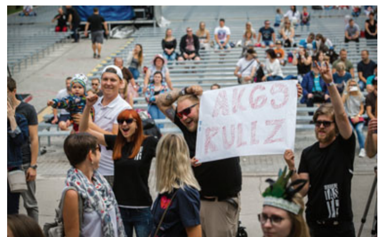
Uz skatuves pēc vairāku gadu pārtraukuma kāpa pašmāju grupa „AK69”