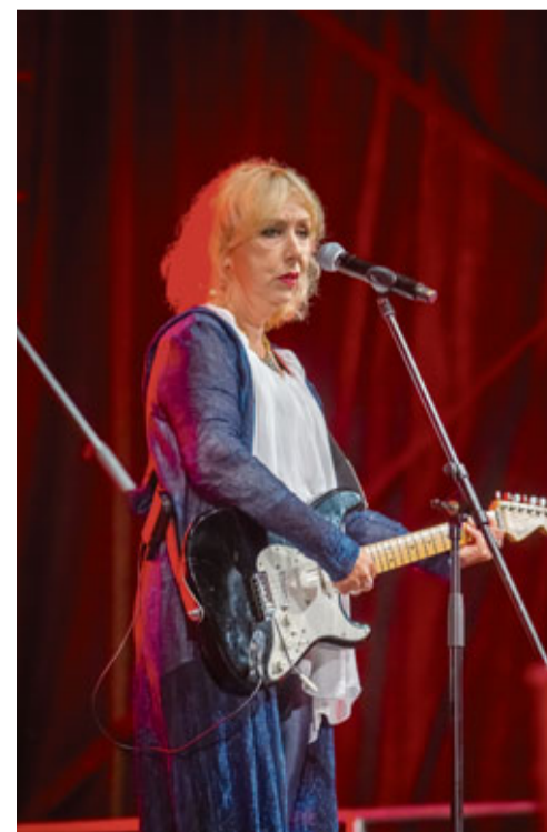
Bauska ar ovācijām sagaidīja „Pērkona” uzstāšanos