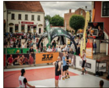
Bauskā – „Ghetto Basket” sestais posms