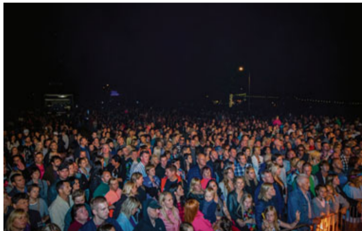
Pēc Kultūras centra aprēķiniem pasākumu baudīja vairāk kā 8 tūkstoši apmeklētāju