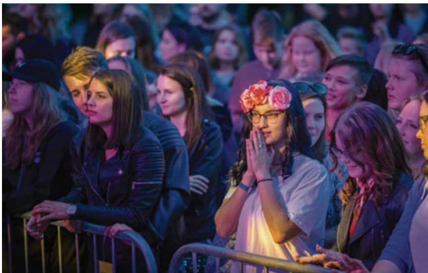
Emocijas koncertos sita augstu vilni