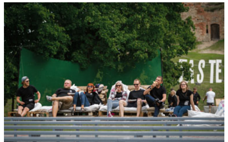
Kultūras centra radošās komandas atpūtas mirklis