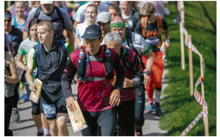
Festivālu atklāja orientēšanās sacensību organizētāja „Magnēts” rīkotā rogaininga starts

Muzikāli festivālu pirmie ieskandināja vokālās studijas „Pigoriņi” dalībnieki