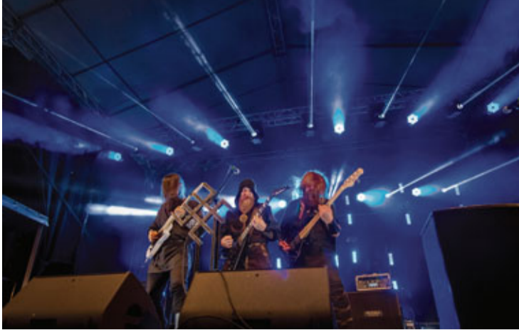
Viesus no tālākām vietām uz Bausku atvilināja grupa „Skyforger”