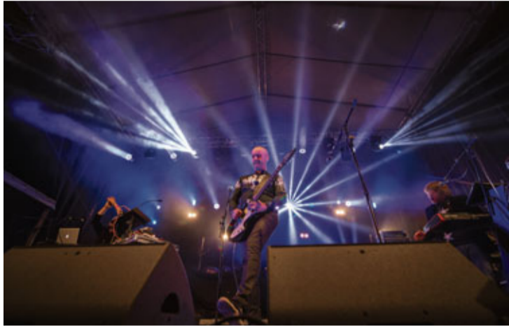
„Jumprava” pieskandināja ne tikai pilskalnu, bet arī visu Bausku