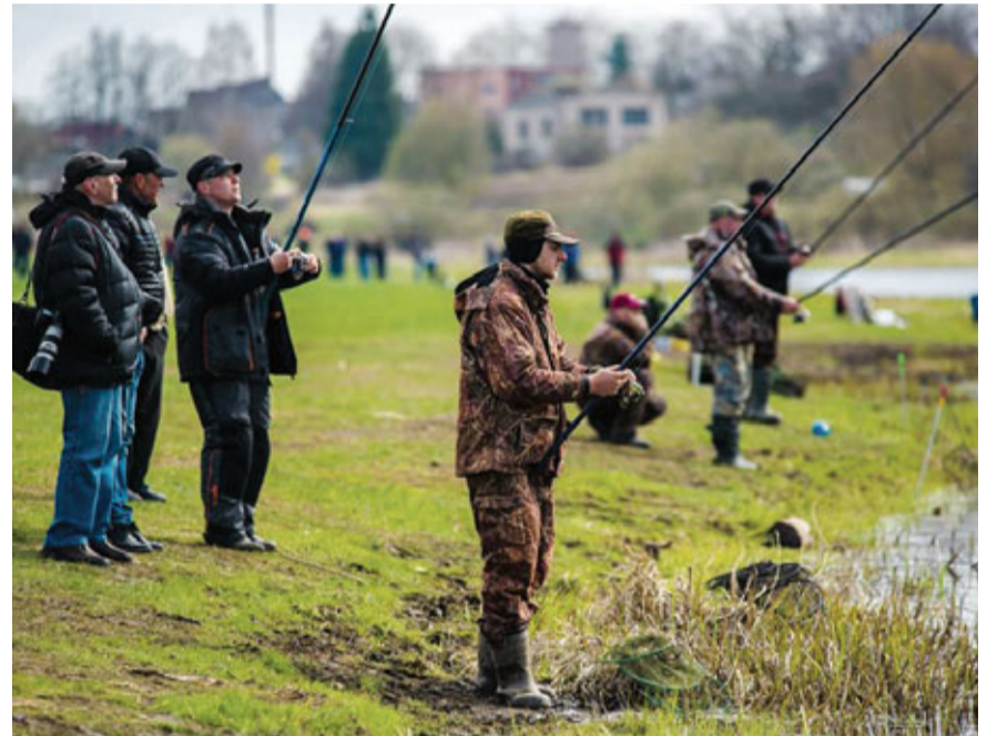
Ikviens labas gribas makšķerēšanas sacensību dalībnieks tika pie loma.