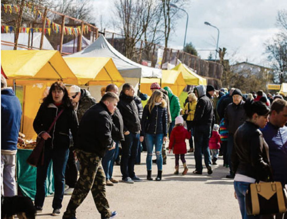
Mājražotāju tirgū varēja iegādāties gan gardumus, gan ikdienas darbiem lietderīgas preces.

Vairāki simti “Vimbu svētku” apmeklētāju tikās Mūsas upes krastā, kur gar Krasta ielu vijās mājražotāju teltis. Tur varēja iegādāties priekšautus, māla traukus, pītus grozus, karameles, vīnu, maizi un daudzus citus labumus.