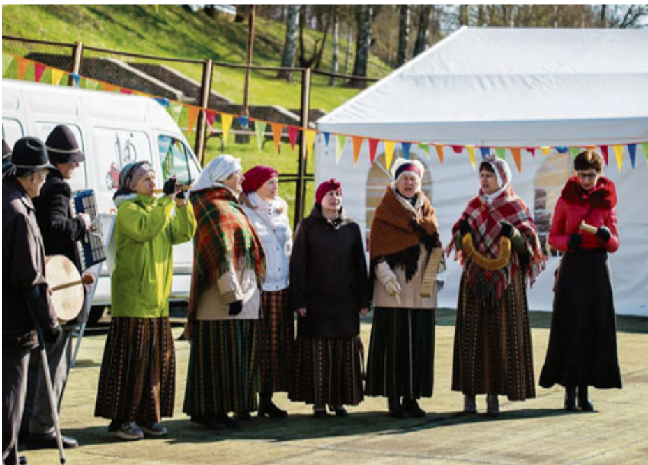
Folkloras kopa “Dreņģeri” muzikāli ieskandina “Vimbu svētkus”.