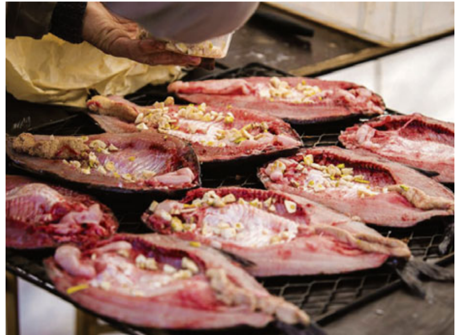
Ikviens pasākuma apmeklētājs varēja mīļoties ar gardām, svaigi kūpinātām vimbām.