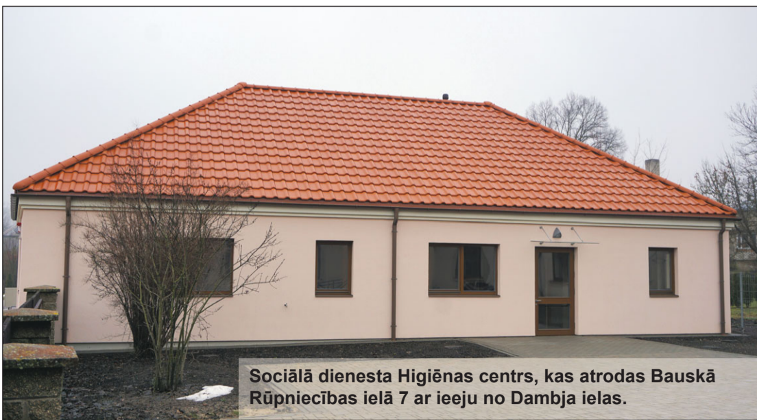
Sociālā dienesta Higiēnas centrs, kas atrodas Bauskā Rūpniecības ielā 7 ar ieeju no Dambja ielas.