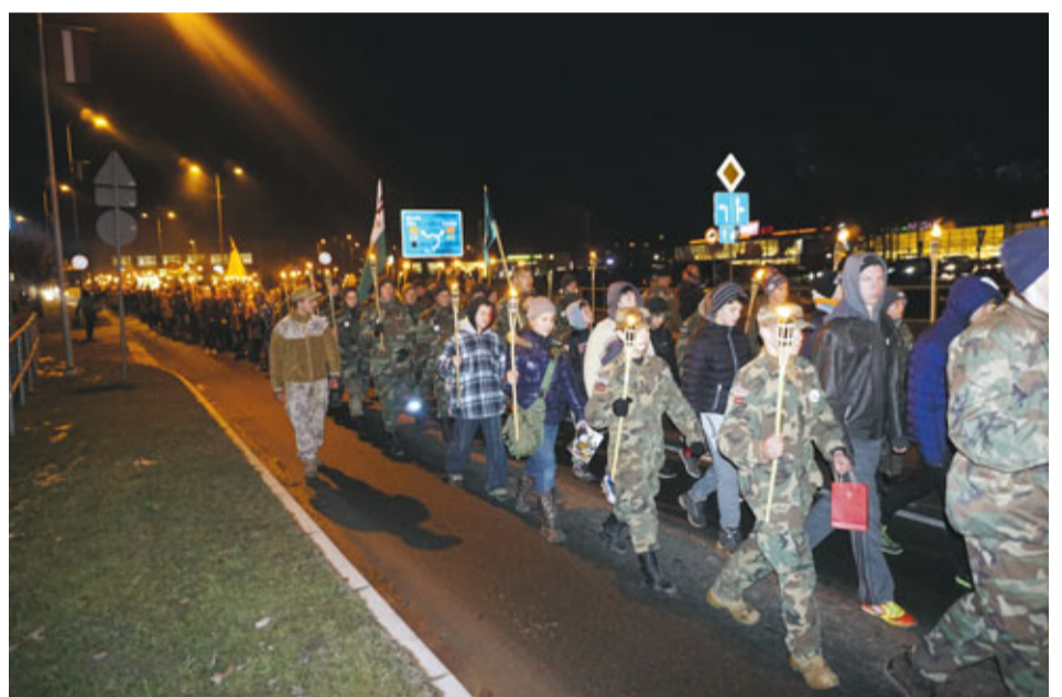
Pasākuma noslēgumā notika lāpu gājiens no Bauskas Kultūras centra līdz piemineklim „Par Latvijas brīvību kritušajiem”.