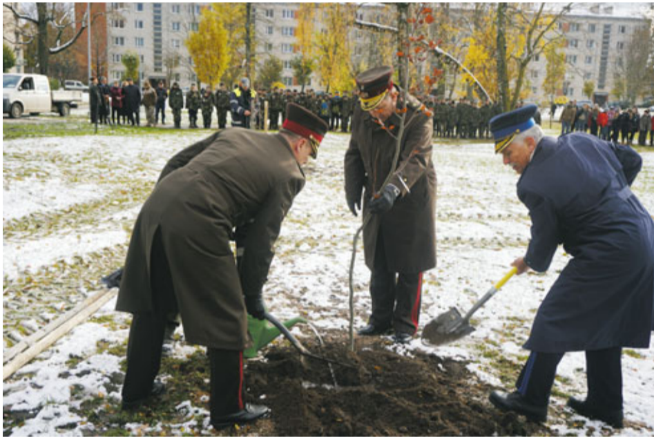
Korfa dārzā par godu šim pasākumam svinīgi tika iestādīti pieci kociņi – trīs dižskābarži un divas kļavas. Tos stādīja gan aizsardzības ministrs un pašvaldības vadītājs, gan Ģenerāļu kluba pārstāvji.