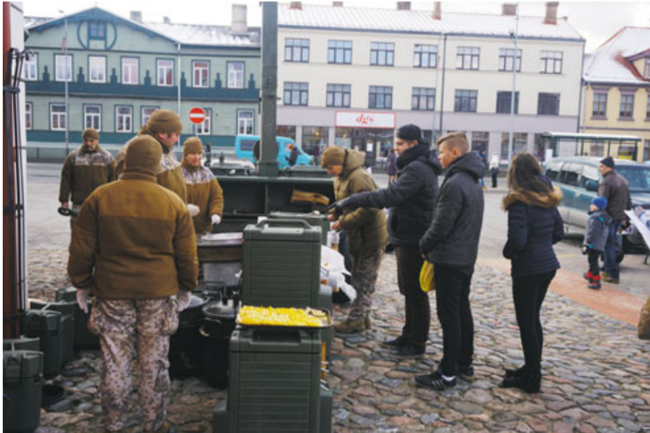
Bauskas Rātslaukumā jebkurš interesents varēja ne tikai aplūkot ieroču un tehnikas izstādi, bet arī baudīt lauka virtuves gardo ēdienu, kam bija īpaša piekrišana.