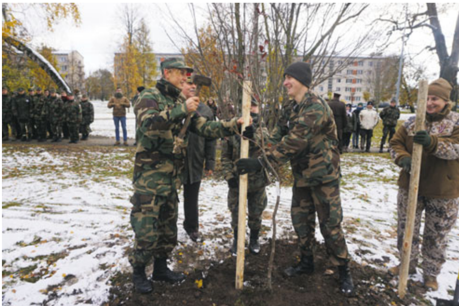
Arī mazpulku, skautu, gaidu un jaunsargu pārstāvji šajā dienā Korfa dārzā iestādīja savu piemiņas kociņu.