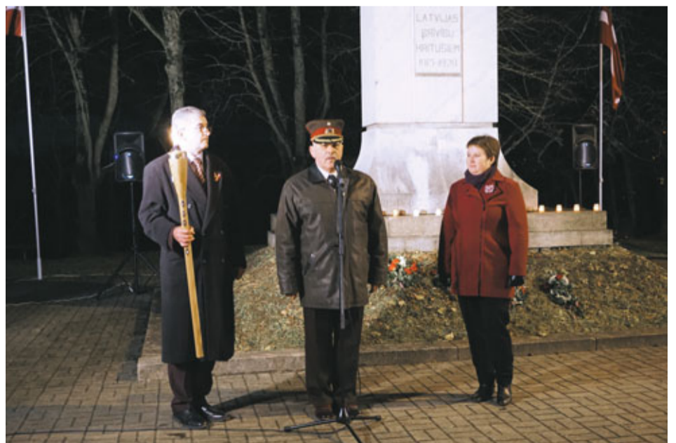
Pie pieminekļa svinīgā ceremonijā Bauskas novads lāpu ar simbolisko uguni nodeva tālāk Jaunjelgavas pašvaldībai, kam nākamgad uzticēta pasākuma organizēšana.