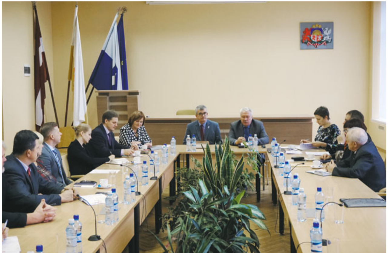
Tikšanās ar pašvaldības deputātiem un darbiniekiem

27. oktobrī, zemkopības ministrs Jānis Dūklavs ieradās darba vizītē Bauskas novadā, kur tikās ar lauksaimniekiem un pārrunāja aktuālos jautājumus nozarē.