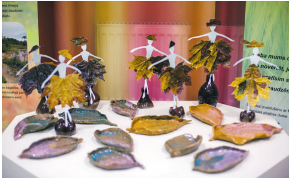
dienas talka Bauskā, Katoļu ielā 1 ievadīja labo darbu mēnesi.