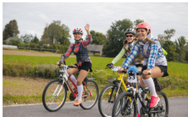
Galvenais vienmēr ir un paliek prieks. Prieks par dalību, par kopā būšanu, vienkārši – par lieliski pavadītu dienu!