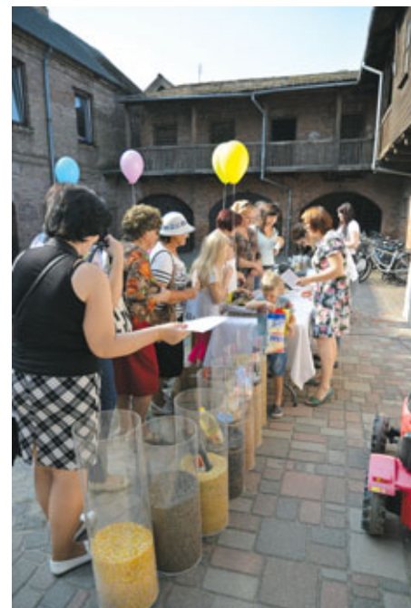
Bauskas novada ģerboņa lauva īpaši priecēja mazos svētku viesus