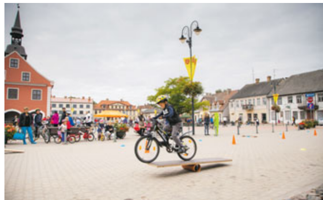
Prasmi savaldīt savu velosipēdu varēja demonstrēt mazākie velobrauciena dalībnieki