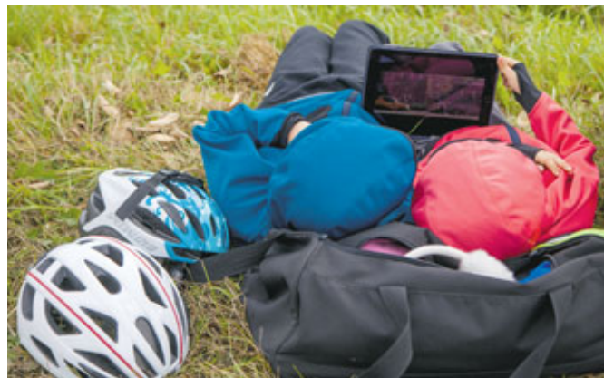
Kas var būt labāks par šo?! Pēc finišēšanas godam pelnīts atelpas brīdis zaļā zālītē ar multenīti!