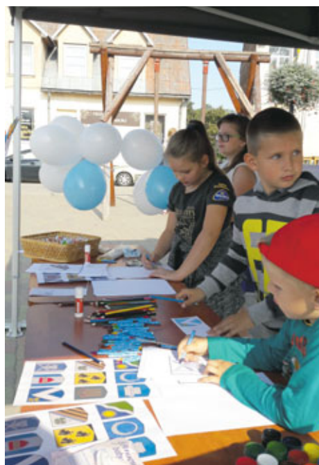
Šogad Pagalmu svētkos ar savām aktivitātēm iesaistījās arī Bauskas novada administrācija, piedāvājot radošas aktivitātes un putras baudīšanu