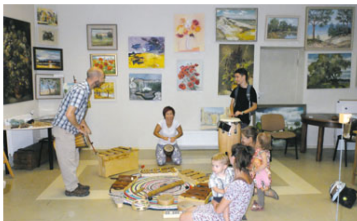
“Muzicē un priecīgs audz” meistarklase “Meistarā Gothardā”