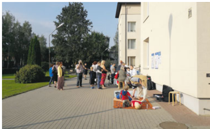
Bauskas slimnīcas pagalmā viesi bija mīļi aicināti vingrot, pārbaudīt savu veselību un atsvaidzināt pirmās palīdzības sniegšanas prasmes