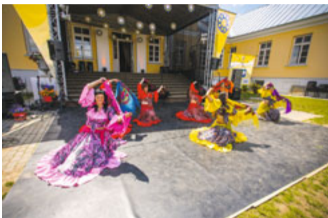
Krāšņs bija deju grupas „Jasmīna” sniegums