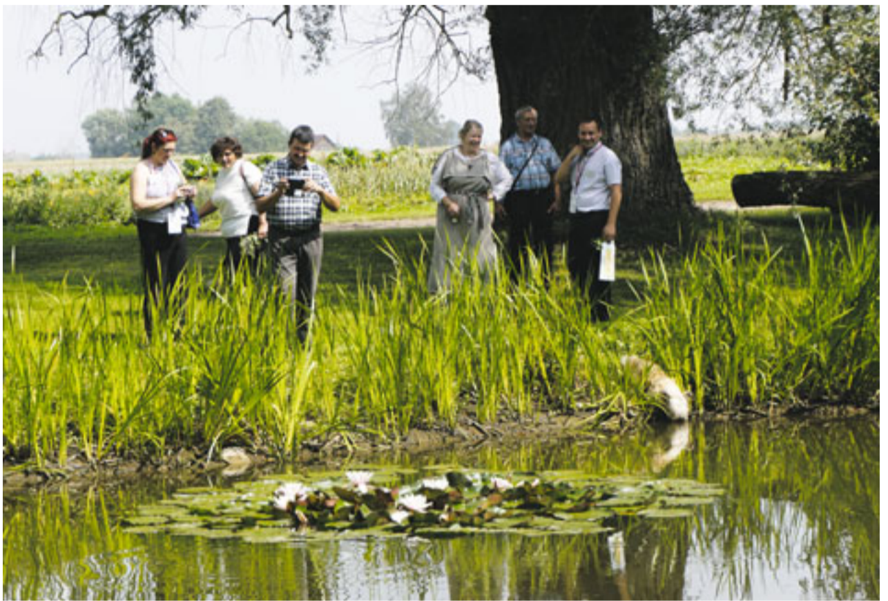
Viesus iedvesmoja zemnieku saimniecībā „Vaidelotes” redzētais latviešu darba tikums un mīlestība pret dabu un tradīcijām

No 24. līdz 30. jūlijam Vides aizsardzības un reģionālās attīstības ministrija sadarbībā ar Latvijas Lauku forumu organizē vasaras skolu-nometni Moldovas kolēģiem. Latvijā ieradās 30 cilvēku delegācija.