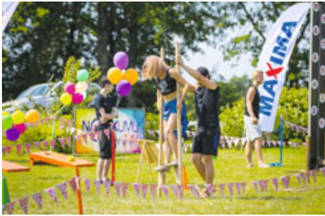
Novada svētkos varēja baudīt daudzveidīgas izklaides visām gaumēm un vecumiem