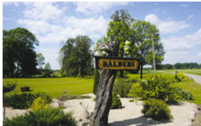
Ceraukstes pagasta SIA „D.M.I. Dālderī” saimnieki krietni pastrādājuši, novācot gadiem krātās atkritumu kaudzes, izveidojot acij tīkamu mauriņu un stādījumus