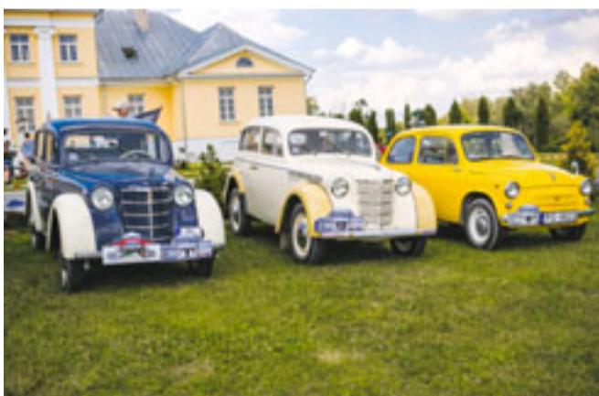
Lielu interesi apmeklētājos raisīja retro auto parāde