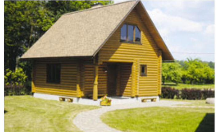
Ceraukstes pagasta „Gobās” varējām vērot saimnieces iekoptās paraugdobes