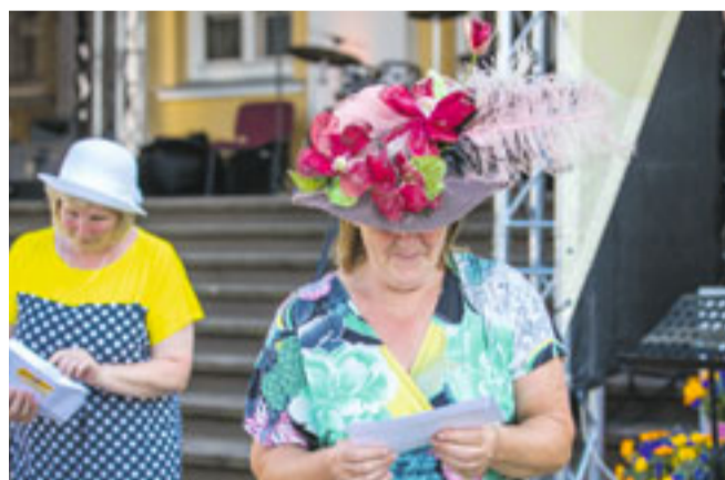
Svētkos tika suminātas dāmas - krāšņāko cepuru īpašnieces