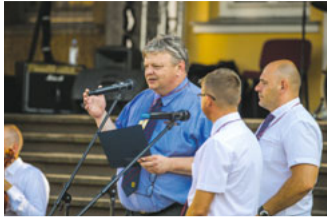
Svētku viesus uzrunāja mūsu sadraudzības pašvaldību pārstāvji