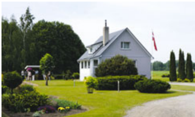
Vecsaules pagasta „Akmeņlauku” mājas gaumīgi iekoptās purvainā apvidū