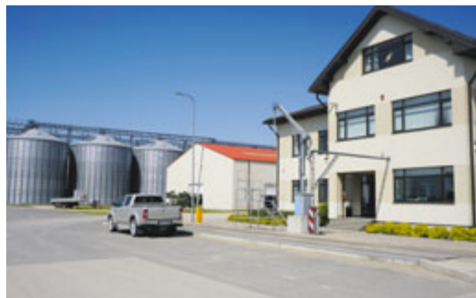
SIA „PS Līdums” Īslīces pagastā, kur modernas tehnoloģijas un darba nodrošinājums vietējiem iedzīvotājiem iet roku rokā ar sakoptu vidi