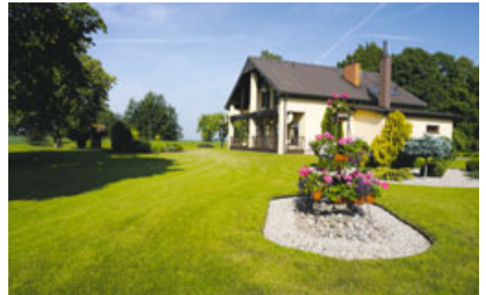
Vecsaules pagasta „Irbītes” – perfekti stādījumi, pārdomāts vides iekārtojums