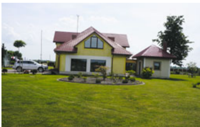
Codes pagasta „Kārklīņos” skatījām bagātīgu augu klāstu rūpīgi pārdomātos stādījumos