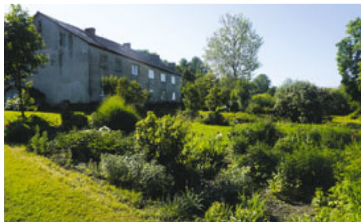
Lielisku sākumu un mērķtiecīgas ieceres redzējām daudzdzīvokļu mājā „Upītes” pašā leišmalē - Pograničā, Gailīšu pagastā