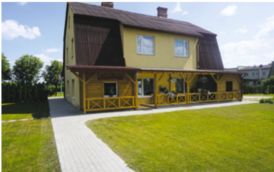
Īslīces pagasta „Rītausmas” šogad nominētas par Bauskas novada rotu