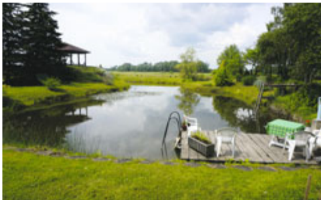
Dāviņu pagasta „Vīgrīzes” priecē ar glīto mauriņu un bagātīgo zivju dīķi ar saliņu viducī