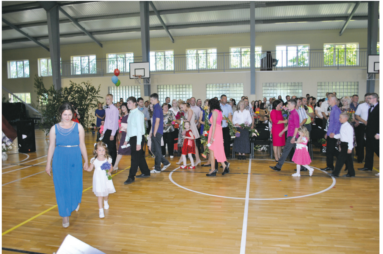
Izlaiduma svinīgais pasākums Griķu pamatskolā – zālē svinīgi ienāk devītklasnieki.

Ceriņu smarža vēl gaisā jaušama, smaržo jasmīnu reibinošās krelles, klāt izlaidumu laiks. 9. un 12. klašu audzēkņiem aiz muguras satraucošais valsts pārbaudījumu laiks. Klāt svētki, kad saņem apliecināšanu un atestātus par izglītības iegūšanu un sekmīgu izrakstus, kas citam liek lepoties un ir apliecinājums centībai, regulāram darbam, reizēm pat uzvarai pār sevi, citam dokuments, kuru nolikt malā, jo droši vien varētu daudz, daudz labāk, ja vien... Skolā ir aizvadīti vairāki mācību gadi. Satikti draugi, domubiedri, laiks ir bijis piedzīvojumiem un atklāsmēm bagāts.