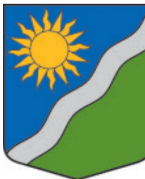
Vecsaulē pagasta ģerbonis