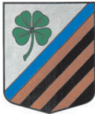
Īslīces pagasta ģerbonis