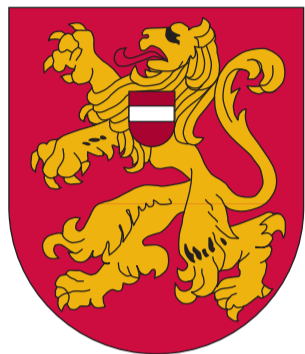
Bauskas pilsētas ģerbonis