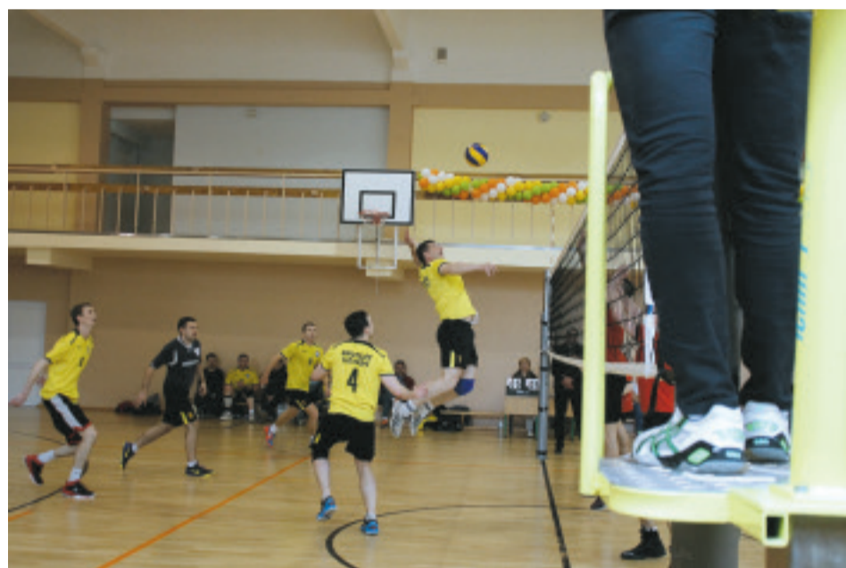
„Mežotne I” vienība finālā piedzīvoja zaudējumu piecos setos pret „Vecumnieki I” komandu.