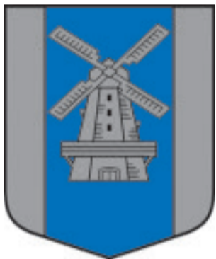
Ceraukstes pagasta ģerbonis