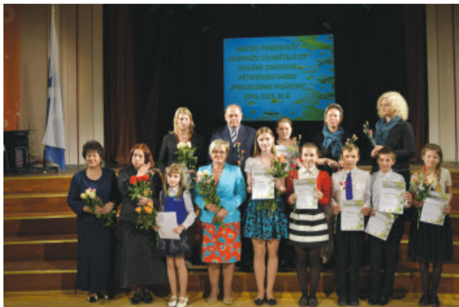
Valsts posma olimpiāžu un konkursu uzvarētāji