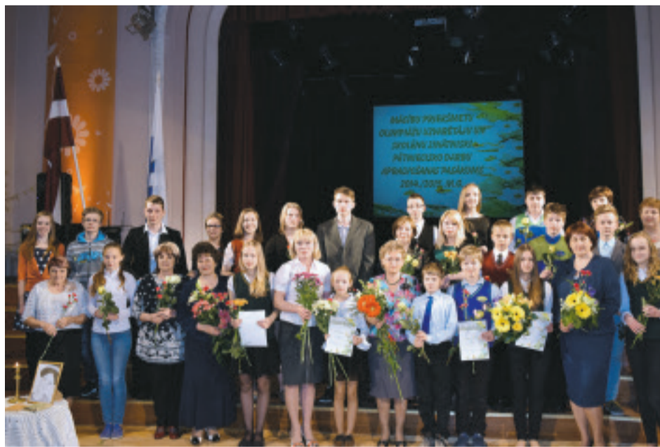
Matemātikas olimpiādes 2.posma uzvarētāji