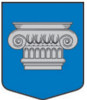
Dāviņu pagasta ģerbonis