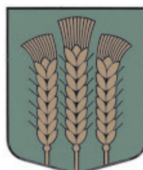
Codes pagasta ģerbonis