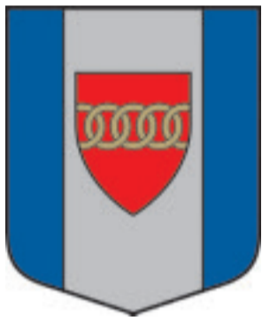
Brunavas pagasta ģerbonis