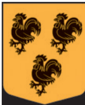
Gailīšu pagasta ģerbonis