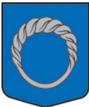
Mežotnes pagasta ģerbonis