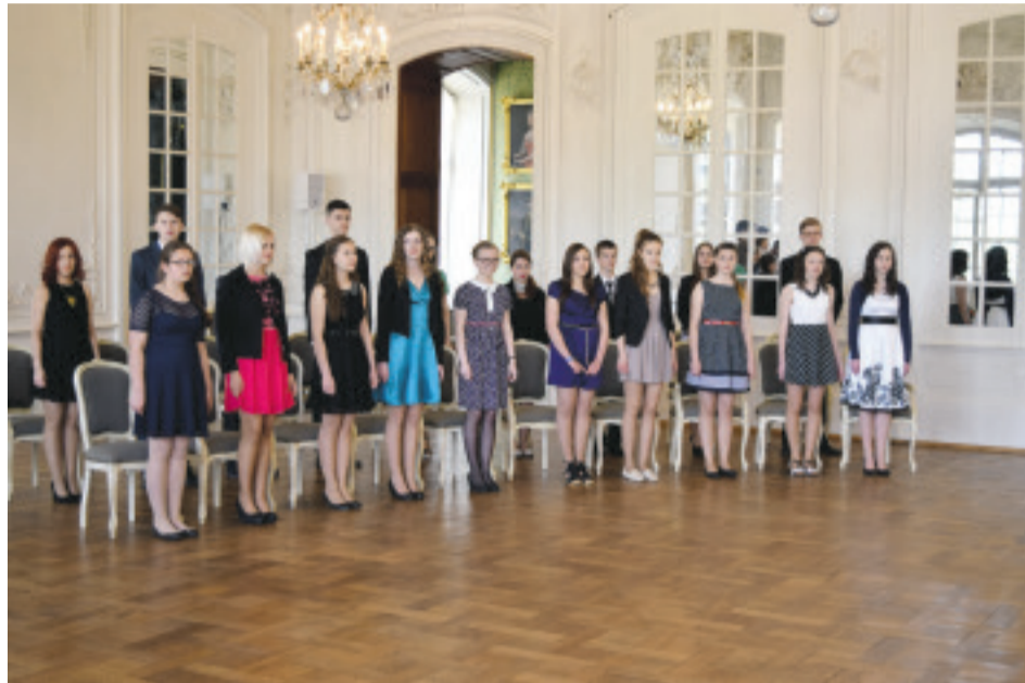
„Gada skolēna” svinīgais pasākums Rundāles pilī