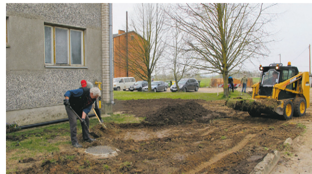
Kur ar cilvēkspēku par maz, tur piesaistīti zirgspēki