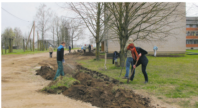
Īslīces pagasta Bēru ciemā Ernesta Kapkalna ielas daudzdzīvokļu dzīvojamu namu iedzīvotāji sakārto piemāju teritoriju