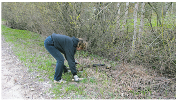
Pudeļu kalni Likvertenu grāvmalēs