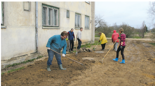
Pēc Lielās talkas darbiem Bēru ciems nu kļuvis daudz sakoptāks.