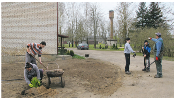
Lai zied un priecē savējos un viesus