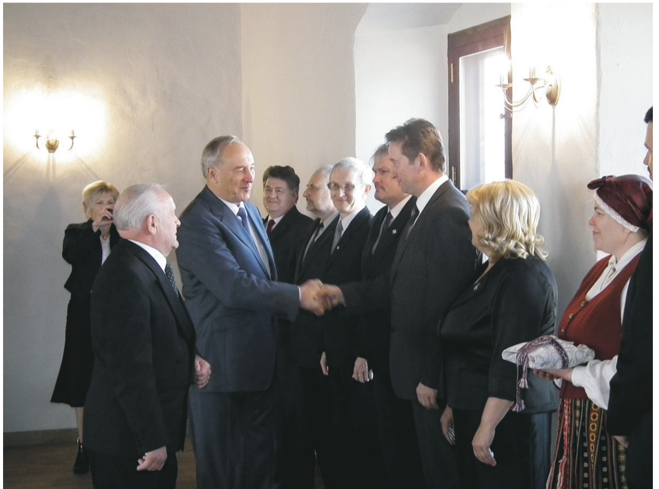
Valsts prezidents Andris Bērziņš ar pašvaldības deputātiem un iestāžu vadītājiem tiekas Bauskas Rātsnamā