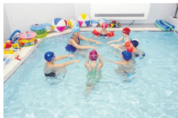
«Kamertes» grupas audzētāji treneres Valentīnas Tambergas vadībā bērnu grupā baseinā uzlabo peldētprasmes.

Ieva Jaunzeme, pirmsskolas pedagogu metodiskās apvienības vadītāja