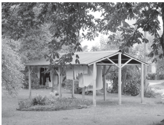
Nojumes vejas žāvēšanai Mūsas ciemā.