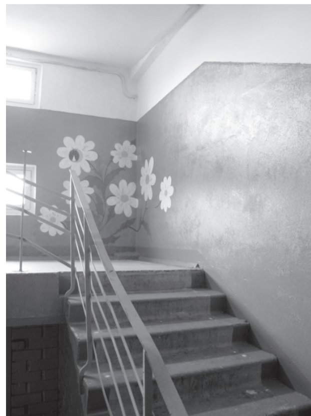
Izremontētā kāpņu telpa Dāviņu pagasta daudzdzīvokļu mājā.