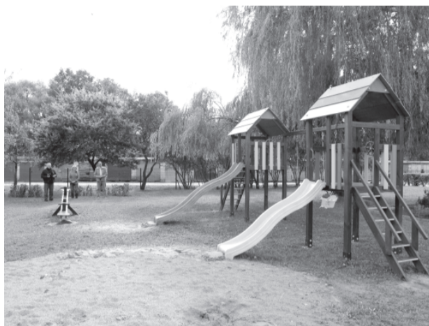
Par projekta līdzekļiem tapušais rotaļu laukums Īslīces pagasta Rītausmās.