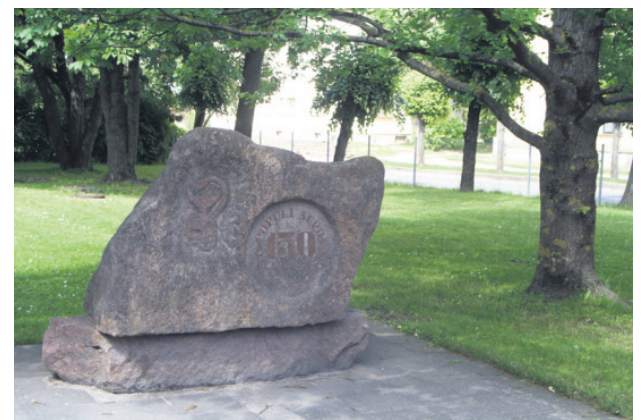
1987.gadā atklātais piemiņas akmens un iestādītais ozols.

Pašreizējais SIA “Bauskas slimnīca” valdes loceklis Uģis Zeltiņš vada uzņēmumu 10 gadus - no 2002.gada.