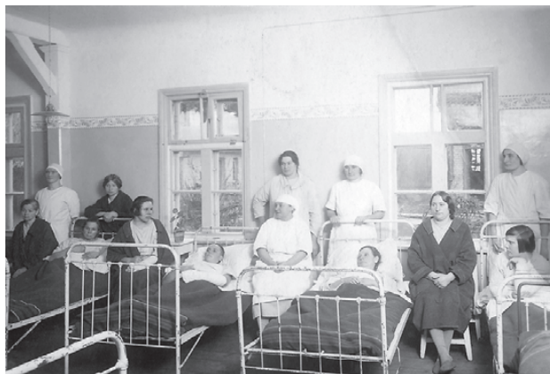
Bauskas slimnīcā. 1930.gadi