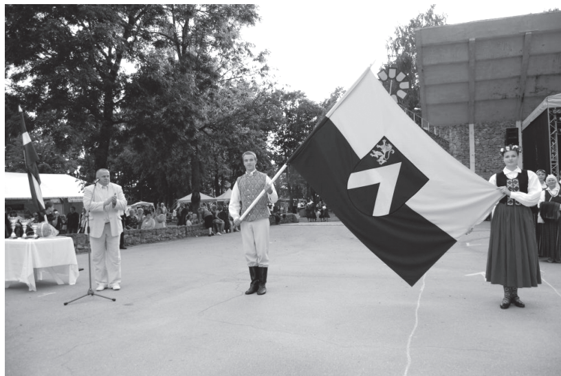
Bauskas novada karoga iesvētīšana. Aut. - Nikolajs Ševirjovs