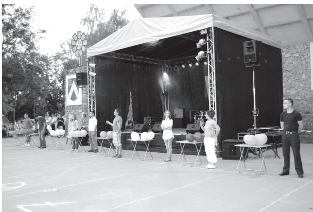
Dullā skrējienu atlases kārtu uzvarētāji gatavi startam lielajā finālā.