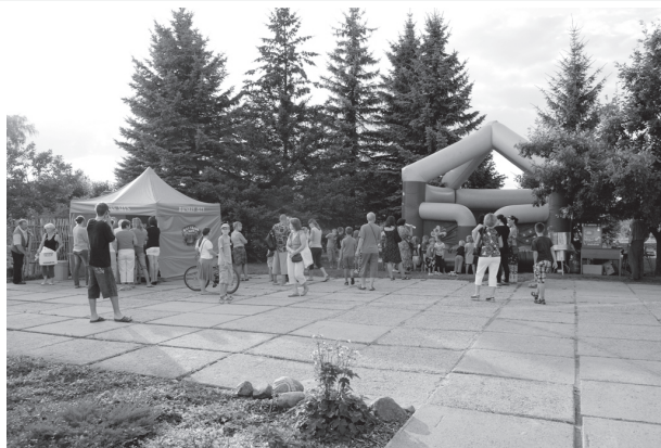
Katrā pagastā bērņus priecēja bezmaksas piepūšamā atrakcija.