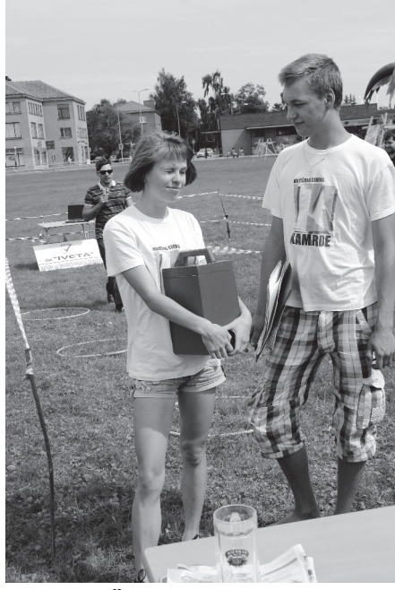
Tiesneši Žaklīna un Rūdolfs gatavi izlozēt 10 Dullā Skrējiņa dalībniekus Bauskas atlasē posmā.