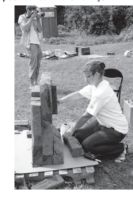
Mākslinieku dārzā top kūdras skulptūras. Aut. - Ivars