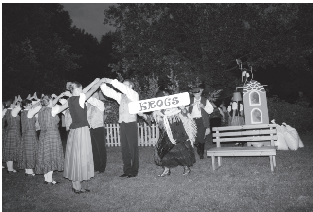
Gailīšu pagastā skaļas ovācijas izpelņijās Īslīces amatierkolektīvu iestudētājums "Īsa pamācība mīlēšanā". Aut. - Aiga Baltalksne