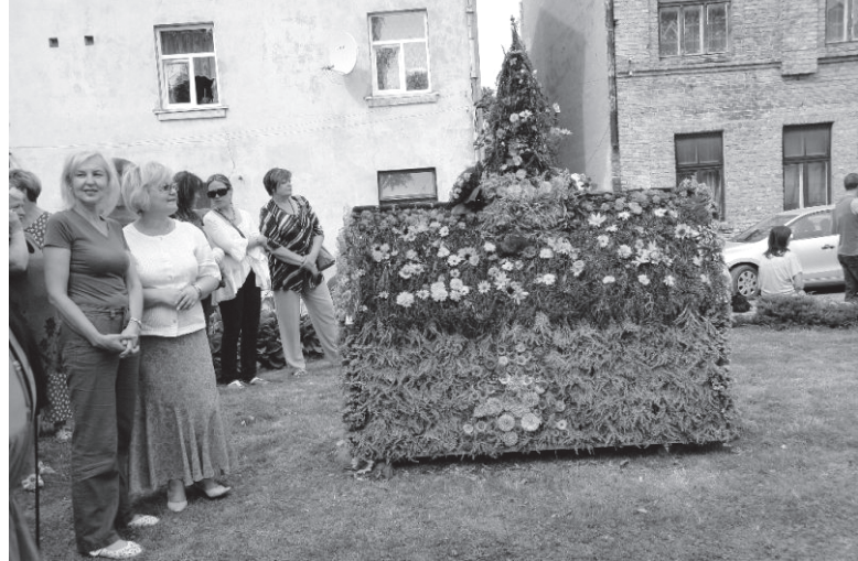
Ziedu Rātsnams pie Novadpētniecības un mākslas muzeja.