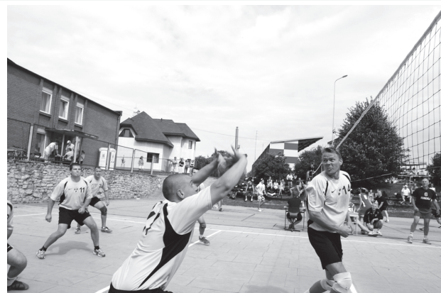
Bauskas stadionā 6. augustā azartiski cīnās volejbolisti.