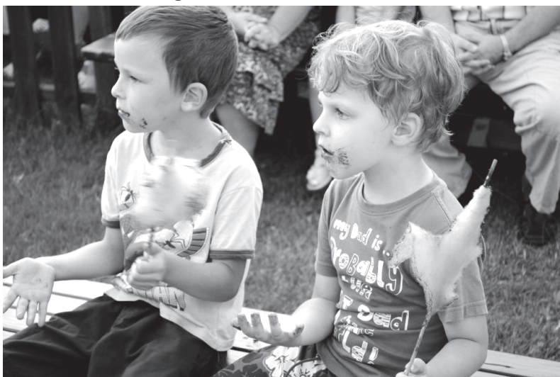
Novada svētkos interesanti bija visu vecumu dalībniekiem.