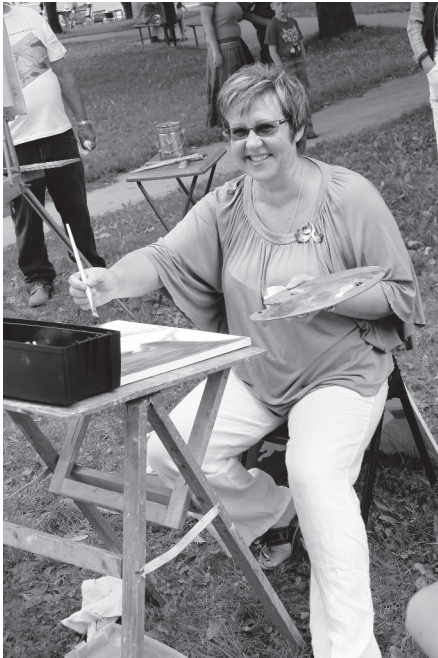
Mākslas plenērs "Bauskas vasara" pie Bauskas novada domes.

Šīs fotomozaīkas veidotāji ir gan novadā pazīstami fotogrāfi, gan amatieri, kas mums atsūtījuši savus fotouzņēmumus par svētkiem.