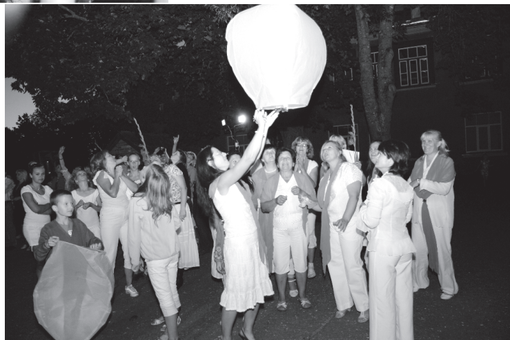
Vecsausles koncerta noslēgumā labu domu pavadītas gaisā paceļas debess laternas.