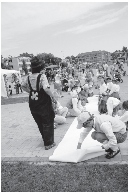
Novada svētku noslēguma dienā jaunus baušļeniekus izklaidē Karlsons un Brālītis.