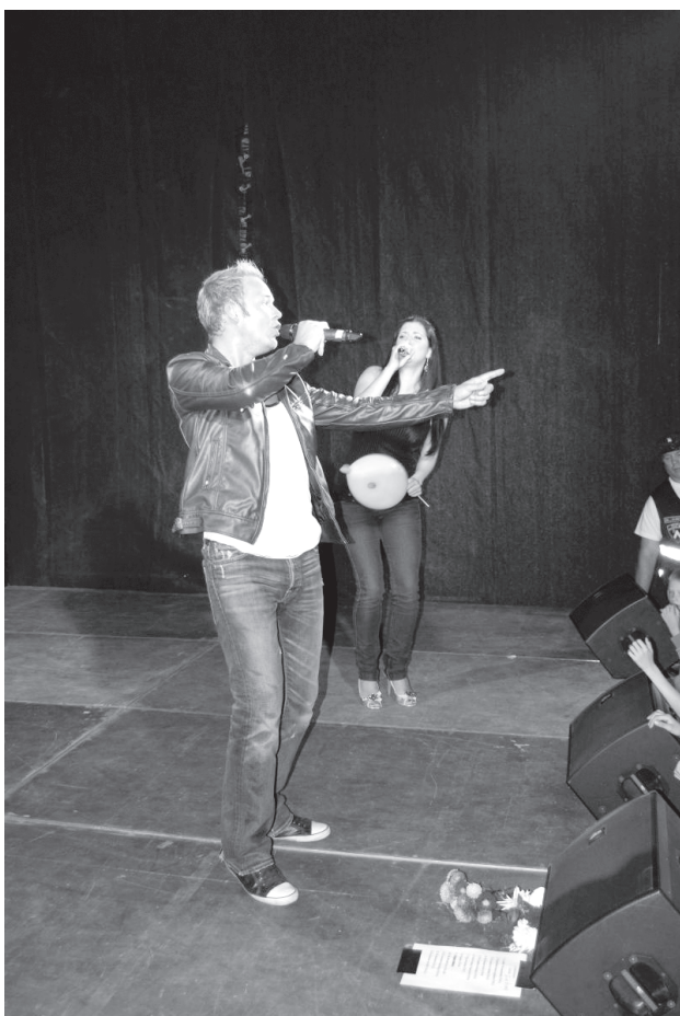
Lauris Reiniks uzstājas Bauskas novada svētku noslēgumā Bauskas pilskalna estrādē.