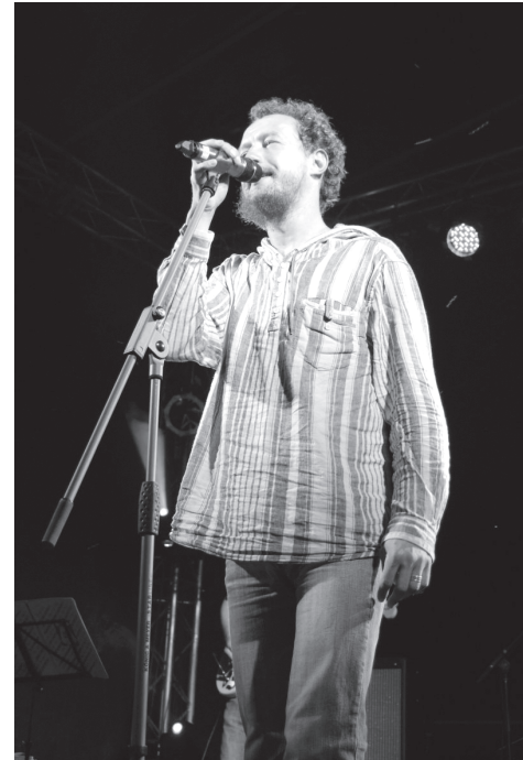
Noslēguma koncertā uzstājas grupa The Hobos ar Ūdrīti priekšplānā.