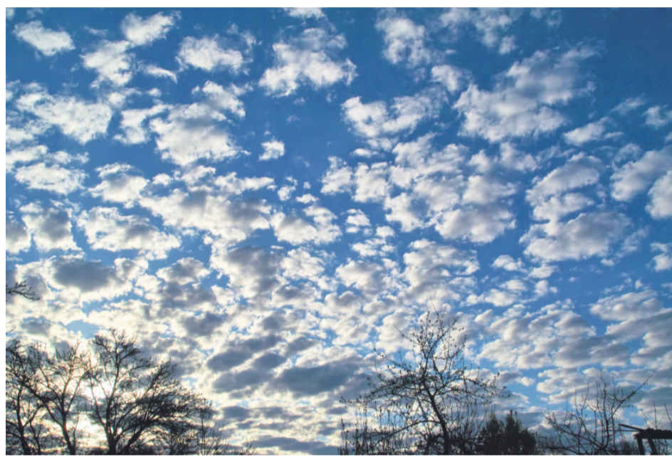
Ivars Demme "Skaists rīts Uzvaras ciematā"