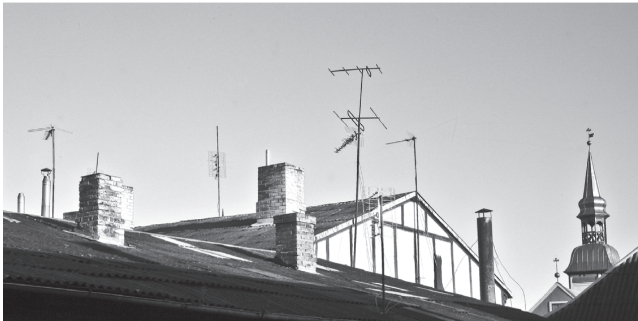
Ģirts Donerblics "Vecpilsētas jūmti - vecie un jaunie"

Visi konkursa dalībnieki savos e-pastos saņems ekspertu vērtējumu par viņu iesniegtajām fotogrāfijām!