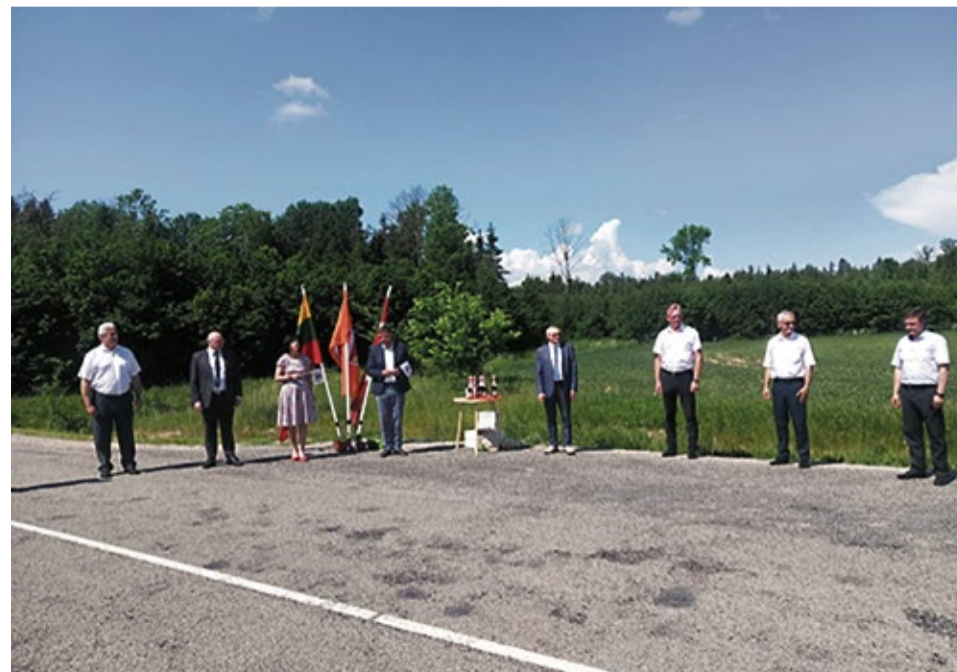
Akcijas oficiālā atklāšana šogad noritēja karstā un saulainā 11.jūnija dienvidū uz Latvijas - Lietuvas robežas Ādžūnos/ Žeimelis, kad, turpinot tradīciju, tikās iesaistīto pašvaldību vadītāji un deva startu akcijai - simboliski nofotografējoties uz virtuālo vārtu fona.