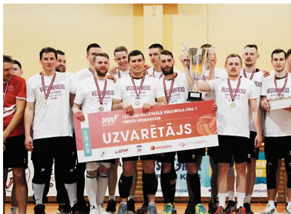
Volejbols vienmēr ir bijis populārākais un sasniegumiem bagātākais sporta veids novadā.