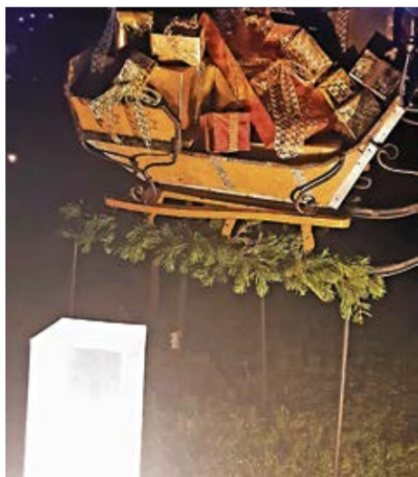
Izgaismots objekts Kurmenē.

Klusāk un mierīgāk šogad svinēsim svētkus, tāpēc vēl jo vairāk centīsimies ne tikai izgaismot savus logus un pagalmus, bet iemācīsimies saskatīt gaišo un priecīgo sevi un citos. Mācīsimies novērtēt citu radīto prieku, vairāk dosim paši, nevis gaidīsim, lai dod mums! Visiem novada ļaudīm vēlū sagaidīt Ziemassvētku brīnumu! Lai gaiši un mierīgi svētki! VN