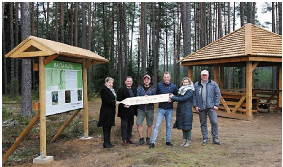
Tuvākajās dienās tiks arī izvietotas norādes zīmes, kas ļaus bez grūtībām atrast Zvirgzdes kāpu jebkuram apmeklētājam.