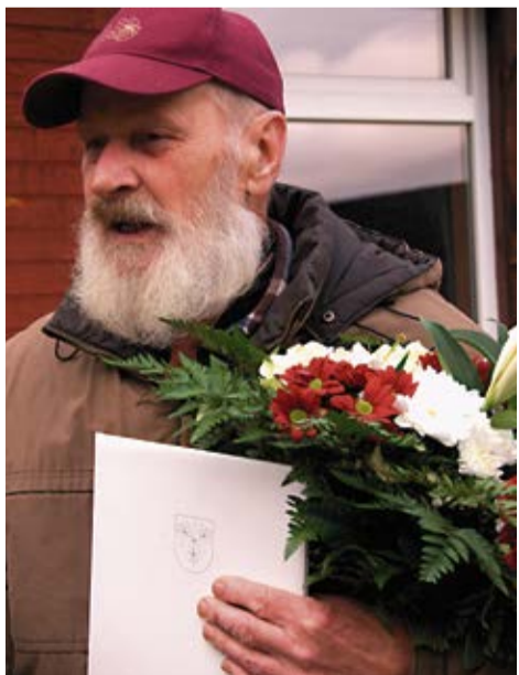
Bārbelietim, tēlniekam INDULIM FOLKMANIM par mūža ieguldījumu tēlniecībā, Latvijas kultūras vērtību saglabāšanā un novada vārda popularizēšanu Latvijā.