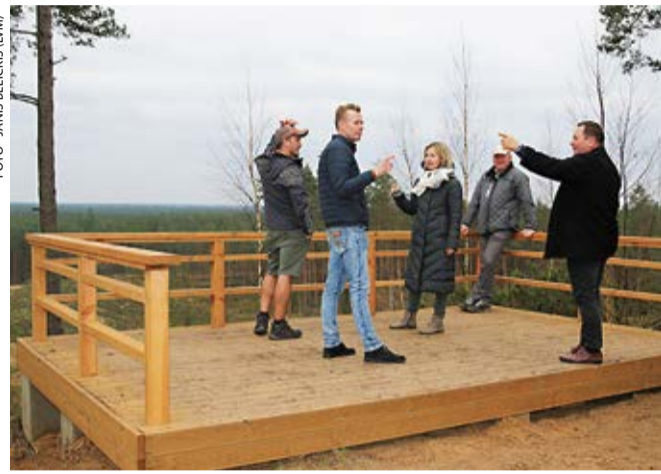
Lielisks skats uz apkārtējo ainavu paveras no izbūvētās apskates platformas.

Lai arī daudziem liekas, ka kāpas virsotni visvieglāk un ātrāk ir sasniegt, to pievarot pa straujo nogāzi, diemžēl aicināšu apmeklētājus izmantot iezīmēto gājēju taku, pa kuru ejot varam arī