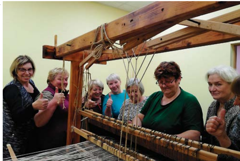
Aušanas nodarbību dalībnieces. Prieks, ka izdodas!

šamas, lai varētu uzzīmēt izstrādājuma tehnisko rakstu un audumu pareizi iekārtot stellas. Ja kļūdās kaut vai par vienu diegu, raksts nojūk, tad kļūda jāizlābo un darbs jāsauc no jauna. Lai pēc ilgās un grūtās auduma iekārtošanas interese neaizbiedētu un viņas tomēr labāk nepievērstos ķīniešu valodas apguvei, aušana sākās ar pašu vienkāršāko - vienkārtni austiem grīdceļiņiem. Pamatmateriāls tiem ir trikotāžas auduma strēmēles, bet mūsdienu visu lieko utilizē. Dažai labai topošai audējai grīdceļiņa