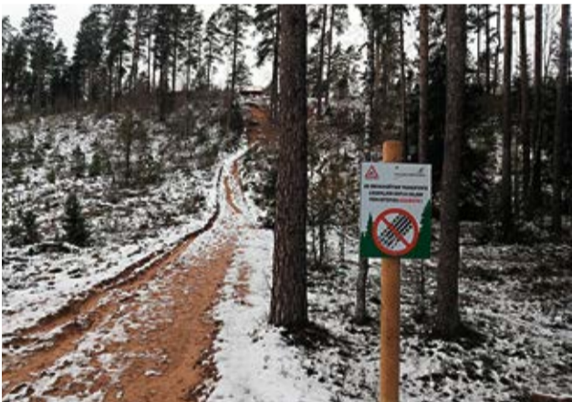
Aicinājums ievērot izvietoto zīmi, nebraukt pa kāpu.

Nākotnē ir domāts par kāpas nostiprināšanas projektu, līdz ar to ceram, ka veiksmīgā pašvaldības un Latvijas Valsts mežu sadarbība turpināsies. Ja redzat, ka tiek piemēslots mežs, atpūtas vieta