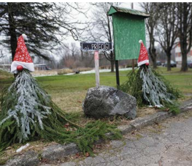
Rūķu pāris ceļmalā pelēcīgi drūmajās dienās reizē ar Ziemassvētku gaidīšanas laiku uzbūvē svētku sajūtu.