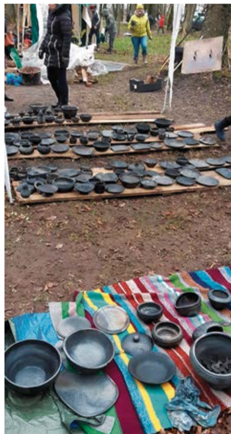
Darbu bija tik daudz, ka ceplis tika kurināts divreiz. Neapraktāms prieks, redzot, ka tavs roku darbs ir izdevies! Ir iegūtas pilnīgi jaunas zināšanas, rastas nebijušas sajūtas.