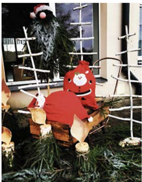
Adventes prieka rūķis Misas pamatskolā.