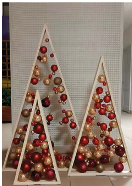
Gaumīgais rotājums Valles pamatskolā priecē lielus un mazus svētku gaidītājus.

Valles pamatskolas rūķīši, labprāt atsaucās