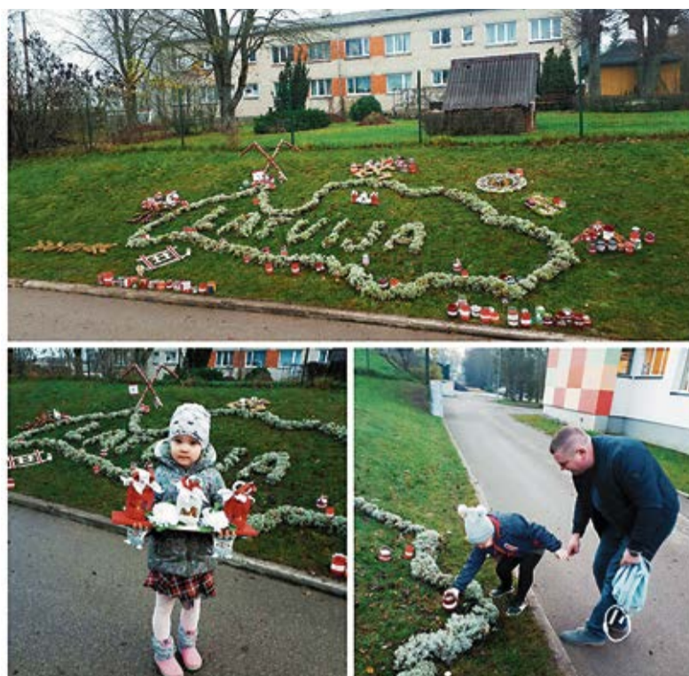
11. novembra rītā bērni ar vecākiem novietoja svečītes par godu Lāčplēša dienai, pieminot mūsu brīvības cīnītājus.

Dzīvojot šo grūto laiku Nedrīkstam mēs nolaist tvaiku. Gan jau atkal labi ies, Esam droši - turamies!