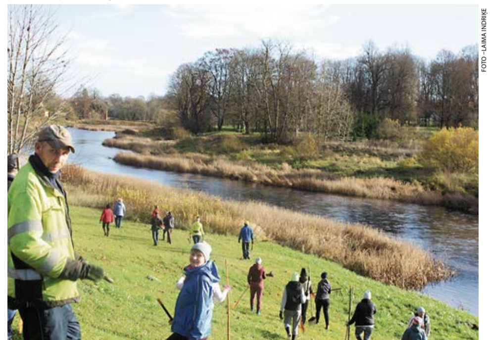
Kopdarbā piedalījās 37 talcinieki. Trīs stundās tika izzāģēti upes krasta krūmi, salasīta draža, sagrābta vecā zāle un atklājās skaista ainava!

Jau 17. gadsimtā G.F. Stenders rakstījis, ka «talka ir kopdarba veids, kur sauc salūgtus strādniekus, kurus pēc darba dūšīgi uzciēnā». Arī šoreiz liels paldies IK «Pie Mēmeles» saimniecēm, jo zupa pēc darba pie dūšas gāja visiem.