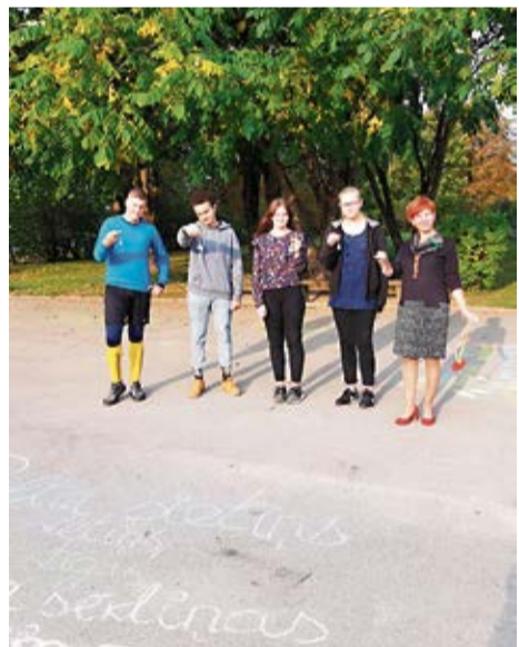
Valles pamatskolas audzēkņi pie sava dzejas citāta uz asfalta.