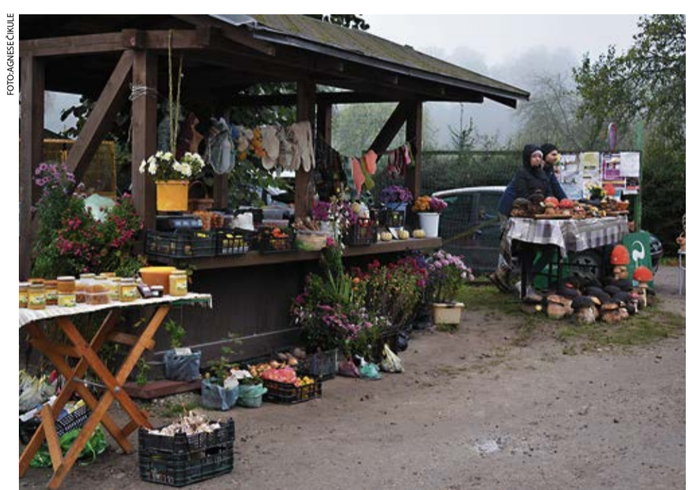
Cilvēki labprāt iegādājās gan ikdienas dārzeņus – kartupeļus, sīpolus, kāļus, kāpostus, gan dažādus stādus.