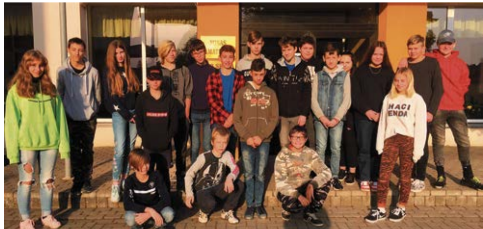
Misas pamatskolas skolēni gandarīti par lietderīgi kopā pavadītu laiku.