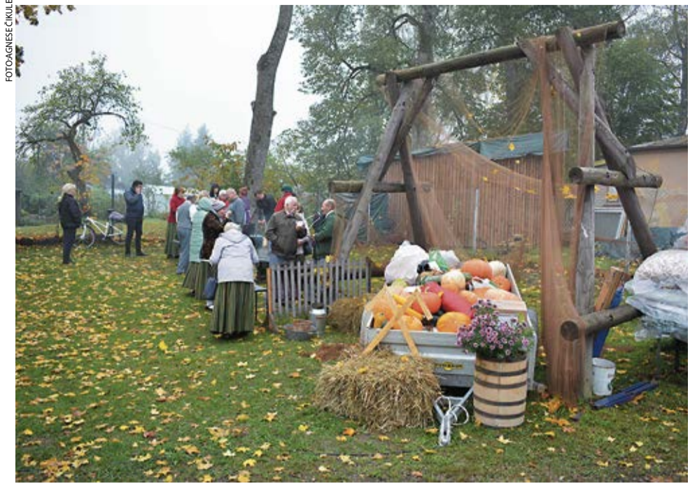
Tirgus laukumā novietotā ziedošanu piekabīte pamazām pildījās ar veltēm.