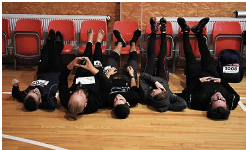
Paveikuši, piekusuši, gandarīti - laimīgi! Komanda atpūšas Vecumnieku vidusskolas sporta zālē.

Šogad par starta vietu bija izvēlēta Vecumnieku Sporta skolas zāle un kontrolpunkti izvietoti Vecumnieku centrā, kā arī virzienā no Vecumnieku centra uz Misu un Rīgu un ap Vecumnieku Jauno un Veco ezeru. Kopā 40 kontrolpunkti ar optimālo maršrutu pa gaisa līniju 17 km. Maksimālā punktu summa apmeklējot visus kontrolpunktus bija 211 punkti, kurus ieguva 2 no 34 komandām.