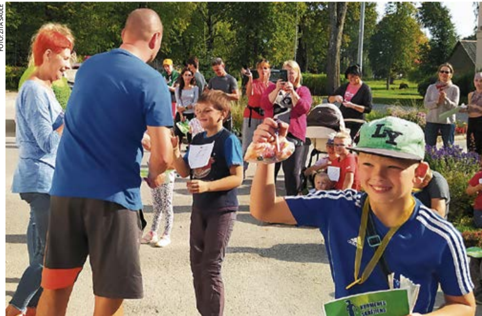
Visi sportisti saņēma balvas-atzinības rakstus, šokolādes medaļas, saldumus, kausus un diplomus.