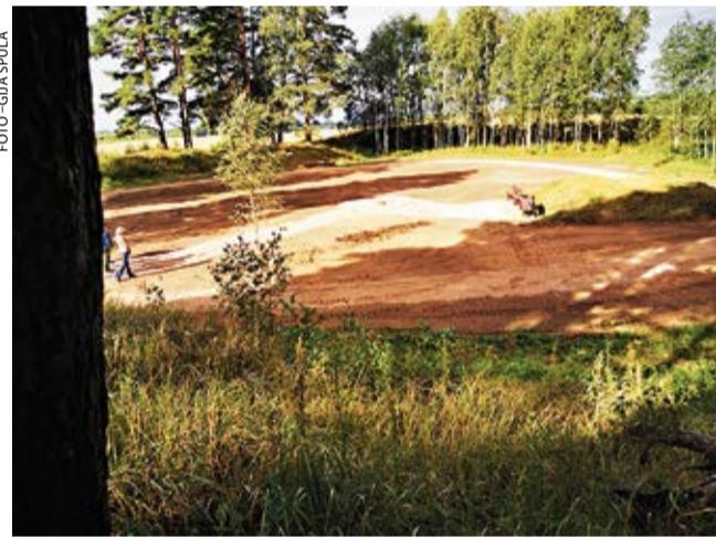
Misā projekta ietvaros tapa jauna atpūtas vieta.