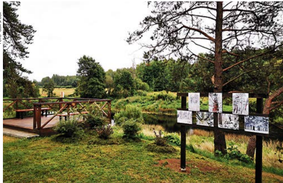
Ānes-Mēmeles muižas parkā tika uzlabota un papildināta atpūtas vietas infrastruktūra.

– tika uzstādīti papildu soli, uzstādīta ģērbtuve, uzstādīts statīvs ēdiena pagatavošanai uz ugunsкура, izveidota garšaugu dobe, izveidots vides objekts – pilskundze, izveidota gadalaiku bilžu galerija, uzstādītas divas virziena norādes uz parka atpūtas vietu kā arī papildināti stādījumi pie nojumes un skatu platformas.