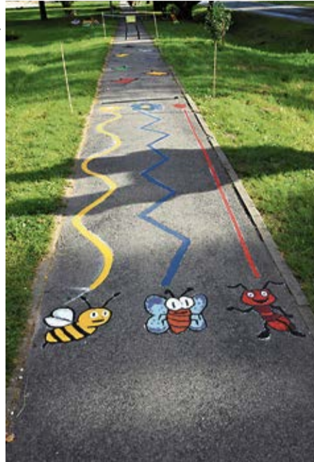
Vecumniekos īpašu ievēribu guva biedrības «7 maņas» īstenotais projekts «Taciņa priekam».

veica abu mājas kāpņu telpu remontu. Šī projekta realizācijai noteikts termiņa pagarinājums.