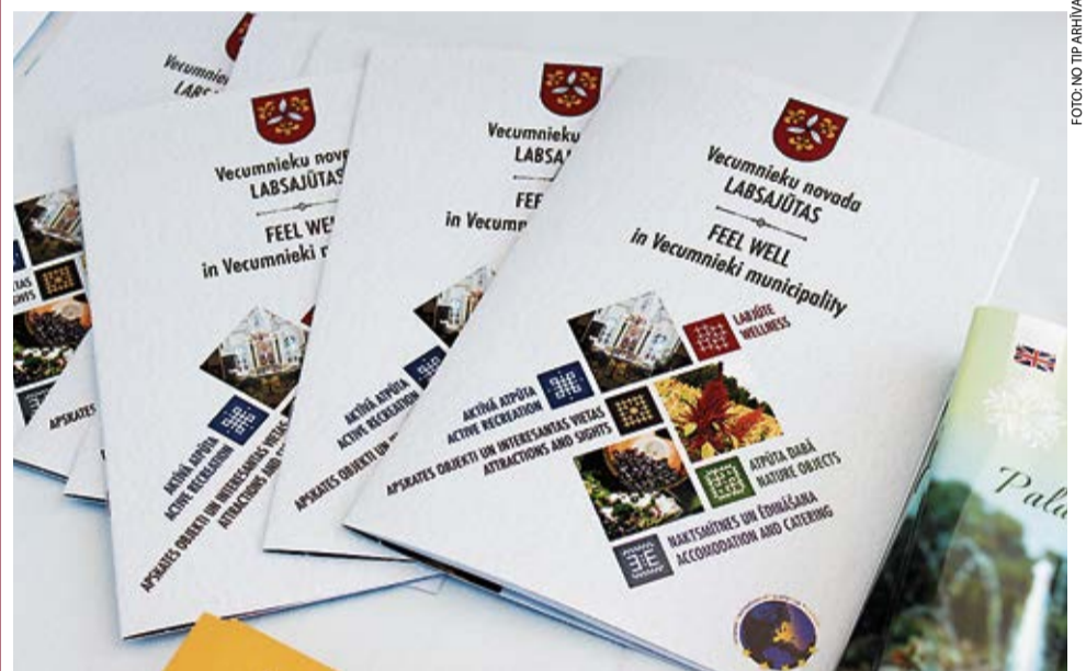
Jaunais buklets ir ērts un pārskatāms, informatīvs un vizuāli pievilcīgs, ar Vecumnieku novada stāstu un praktiski lietojams.

Ir arī izveidoti vairāki jauni maršruti, ar kuru palīdzību ceļotāji var izbaudīt atpūtu Baldones un Vecumnieku novada dabas objektos, iepazīt pierobežas kultūrvēsturisko stāstu caur Bruknas, Bārbeles, Kurmenes un Skaistkalnes prizmu, kā arī vēltīt vairākas stundas kārtīgai pastaigai pa Vecumniekiem.