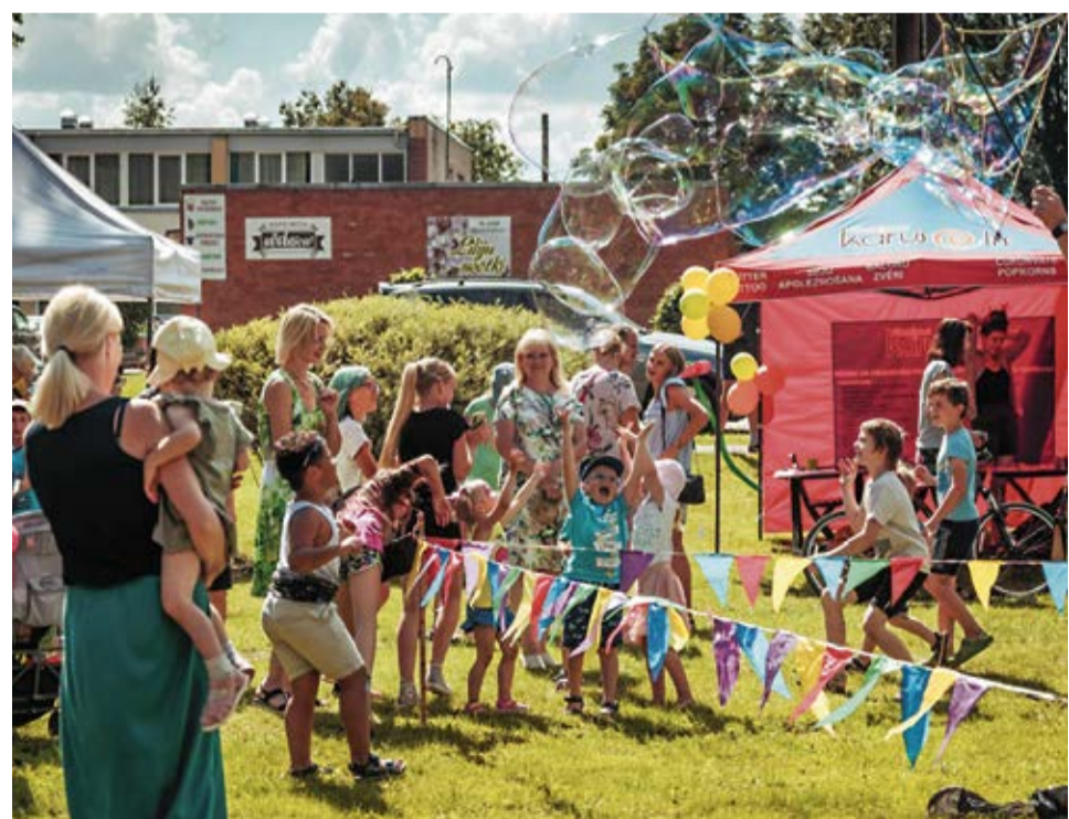
Mazie svētku apmeklētāji ar aizrautību un prieku baudīja piedāvātās izklaides iespējas.