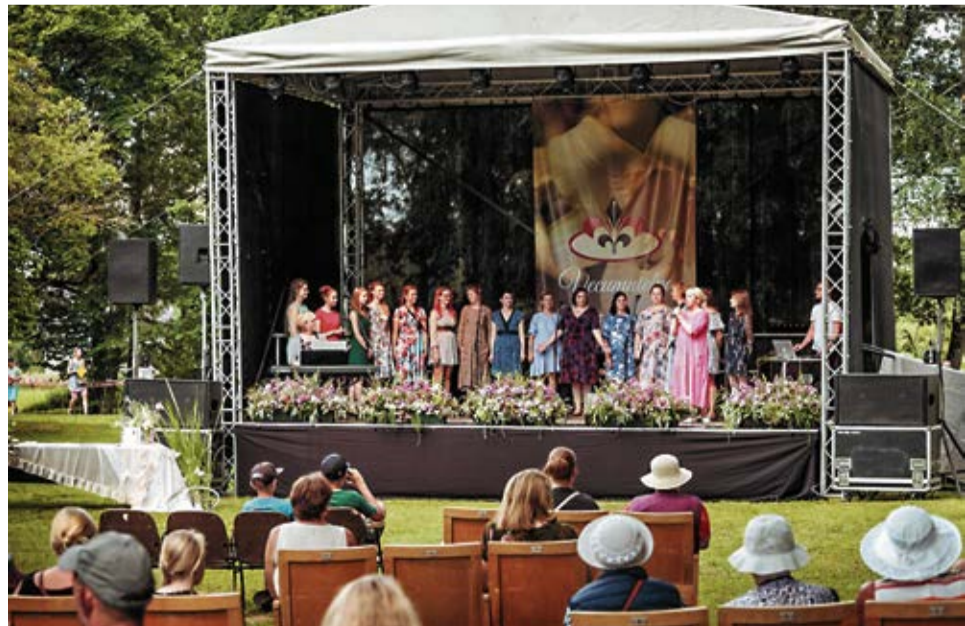
Amatierkolektīvi kopīgā koncertprogrammā izveda skatītājus cauri laiku lokiem, ļaujot baudīt dziesmas, dejas, teātra uzvedumus.