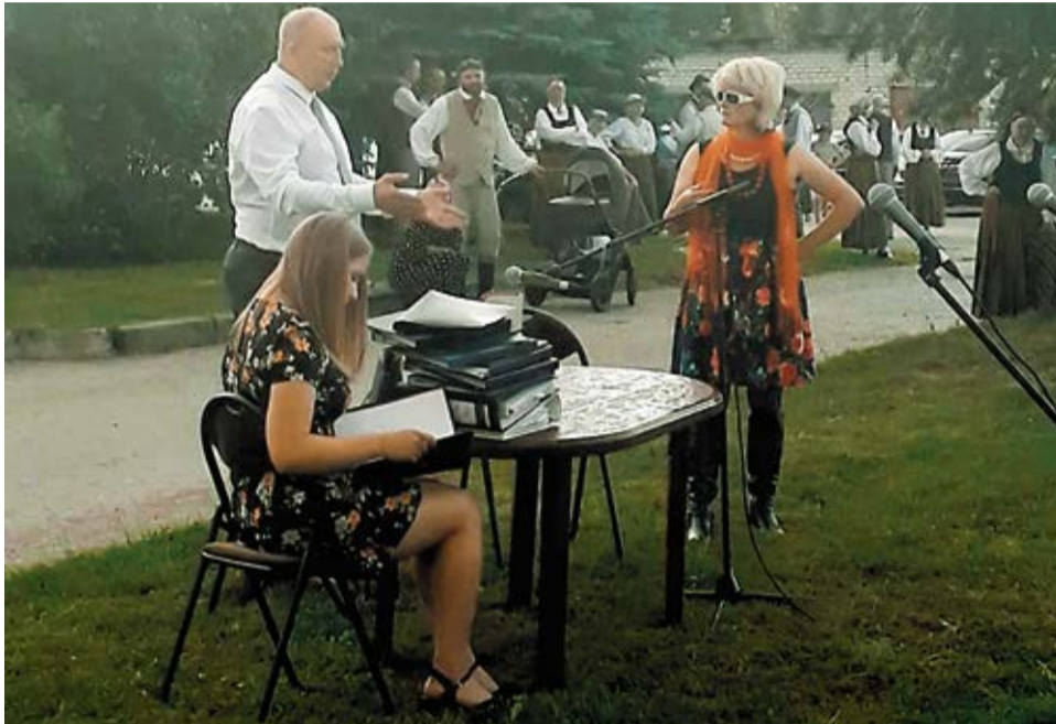
Valles amatiereteātris izrādīja skečus par aktuālām tēmām un apdziedāja Liepu ielas būšanas un nebūšanas.