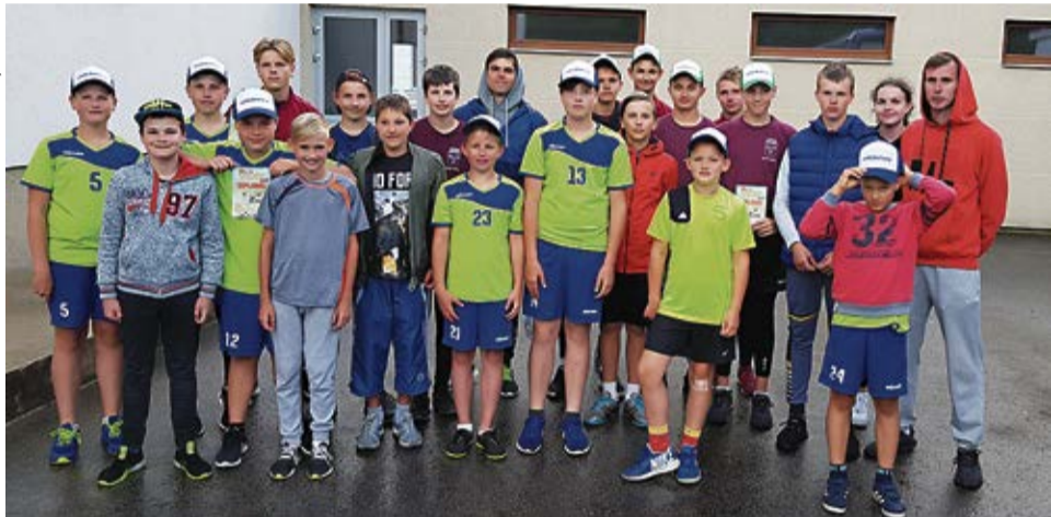
Prieks par labajiem rezultātiem - Vecumnieku Sporta skolas jaunie volejbolisti Latvijas jaunatnes Vasaras spēļu posmā Gulbenē