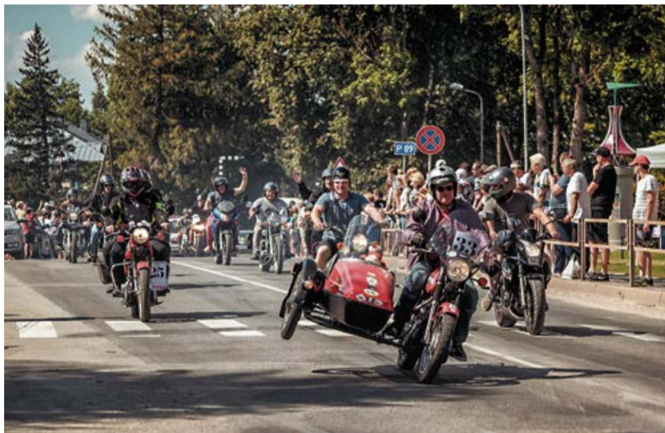
Skalākais svētku notikums noteikti bija auto/moto retro parāde, kurā skatītāju acis priecēja dažādi retro motocikli un auto.