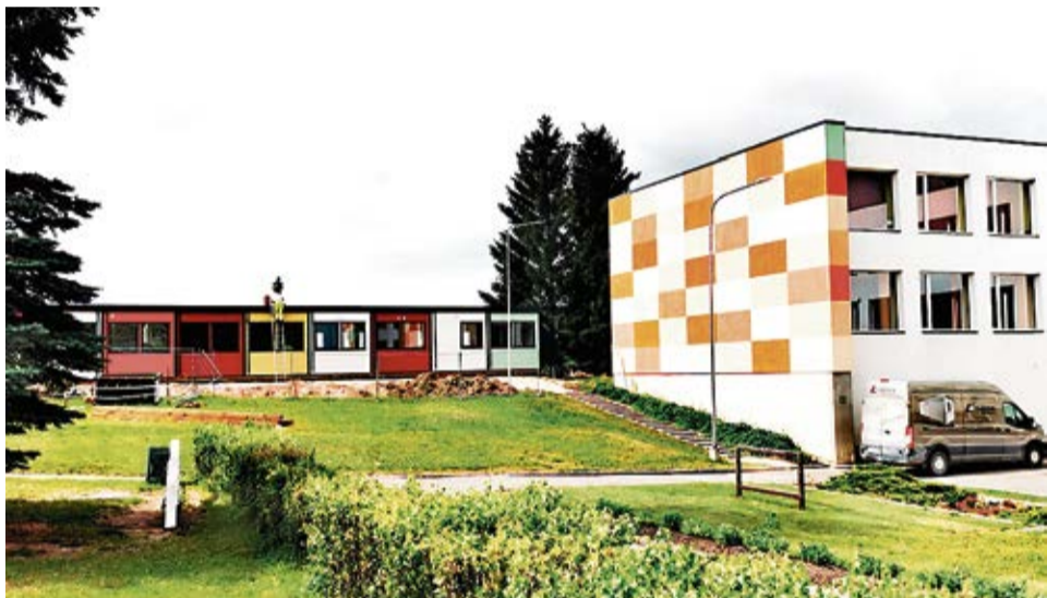
Šodien vietā, kur nesen zaļoja mauriņš, nu slejas acij tikama vienstāva ēka.

Lai arī turpinās pēdējie iekšdarbi ēkā, ar pārliecību varu teikt, ka bērnus 1.septembrī sagaidīs patīkams pārsteigums. Jaunās telpas tiks aprīkotas arī ar skaistām un acij tikamām mēbelēm. Parāli moduļu būvniecībai, bērnodārza otrā pusē rit darbi arī pie lielāka un ērtāka auto stāvlaukuma izbūves. Stāvlaukumam apkārt tiek izbūvēta gājēju ietve, lai mazie skolas apmeklētāji kopā ar vecākiem varētu droši nonākt bērnodārza teritorijā, nešķērsojot stāvlaukumu. Ir paredzēts, ka jaunajā auto stāvlaukumā varēs vienlaicīgi novietot 25-30 automašīnas. Auto virzību ir paredzēts organizēt apļveida kustībā, ko norādīs arī uzstādītās ceļa zīmes. Arī šie darbi tiks pabeigti līdz 10 augustam. VNZ