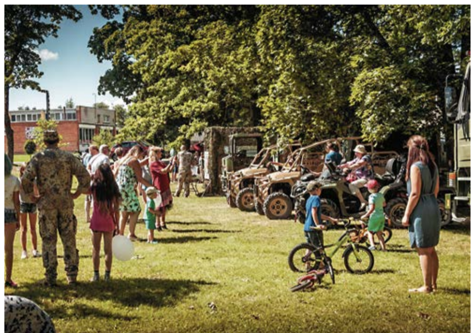
Zemessardzes 53. kājnieku bataljona organizētās aktivitātes - lielformāta puzzles, militārās tehnikas un ieroču demonstrācijas, kā arī kaujas simulācija, izmantojot peintbola ieročus.