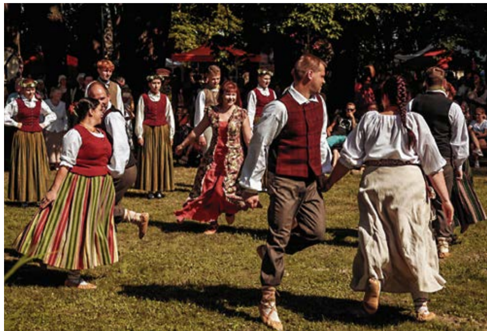
Dzīvesprieka papildītais sniegums deva pozitīvas emocijas gan pašiem dejotājiem, gan svētku viesiem.