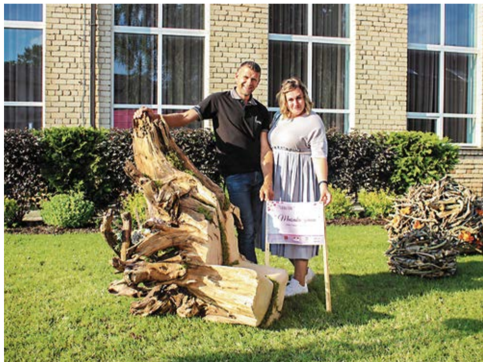
Šī gada Simpātiju balvu otro gadu pēc kārtas ieguva Maisaku ģimene no Skaistkalnes.