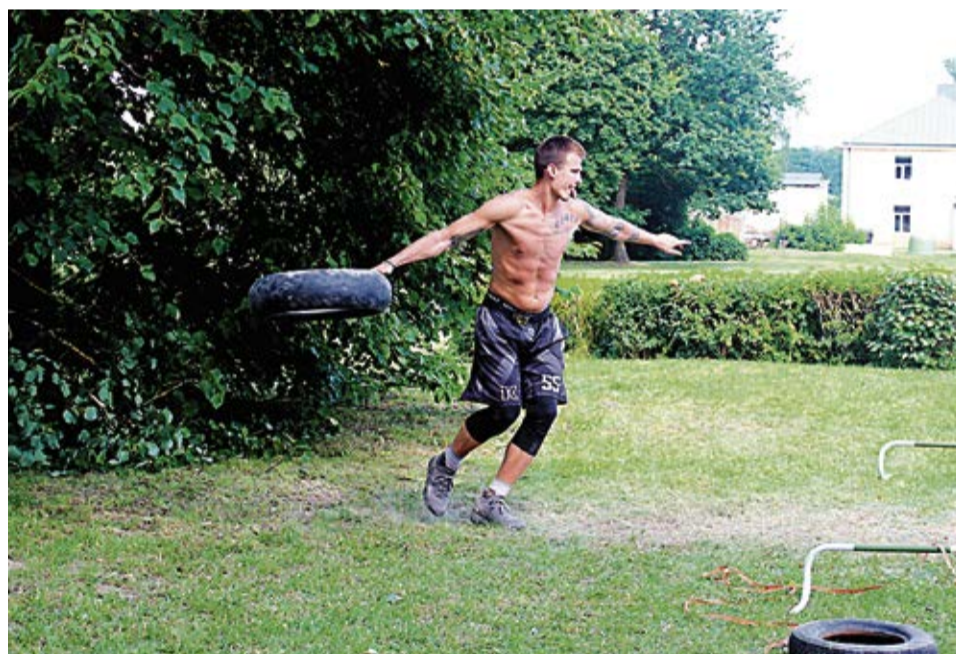
Vienā no sacensību veidiem - rīepas mešanā - piedalījās 51 dalībnieks.