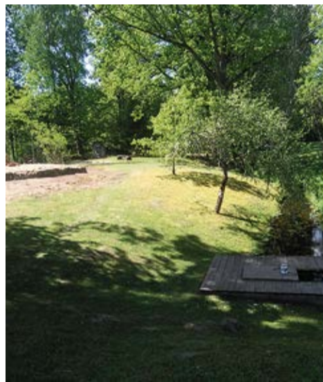
Sēra vannu mājas pamati, atsvaidzinātā apkārtnē tagad.