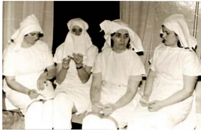
Dāmas isi pirms asins ziedošanas

«Donoru kustība Vecumniekos tika dibināta 1966. gadā, kad pirmie 35 cilvēki nodeva asinis bez