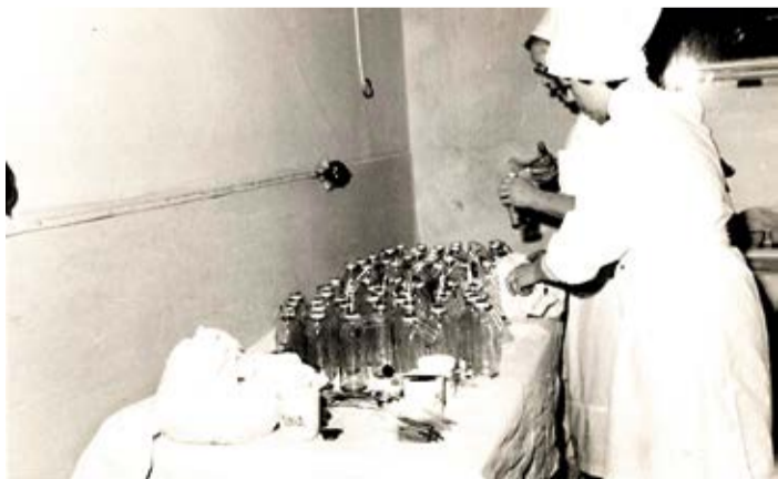
Sterilas pudeles asinīm.