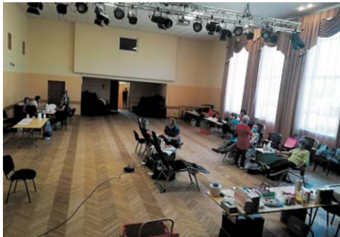
Mūsdienas. 2020.gada 2.jūnijs, Vecumnieku tautas namā donoru diena.

Apraksta sagatavošanā izmantotais informatīvais avots: https://www.vadc.lv/par-vadc/zinas-par-vadc/vesture un Vecumnieku pagasta Novadpētniecības centra materiāli. VNZ