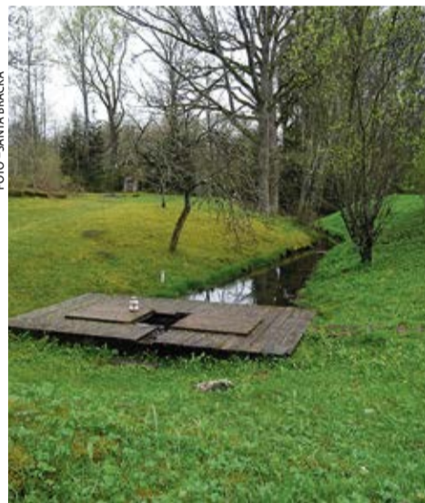
Sēravota apkārtnē pirms darbu sākšanas.

Bārbeles pagastā pērn pie sēravota bija uzsākti sakopšanas darbi. Tagad tie ir noslēguma fāzē. Sadarbībā ar ZS «Silavēji», Valles pašvaldības aģentūras un SIA «Jaunolis» speciālistiem ir izdevies sakopt Bārbeles sēravota teritoriju, kas gadu gadiem bija paslēpusies zem koku un krūmu apauguma. Pagājušā gada rudenī tika izcirsti un izzāģēti krūmi, zem kuriem parādījās vecie vannu mājas pamati. Šogad, pateicoties ārkārtas situācijai, Dome lēma par papildu finansējuma piešķiršanu sēravota sakopšanai un labiekārtošanai. Gada sākumā tika pasūtītas un atjaunotas norādes uz Bārbeles sēravotu. Tagad sēravotā ir atsegta senās vannu mājas pamatu aprises, sakopts lecavas upes krasts un labiekārtota ugunsкура vieta. Procesā vēl ir laipas atjaunošana un lapenes uzstādīšana, bet drīzumā arī šie darbi būs pabeigti. VNZ